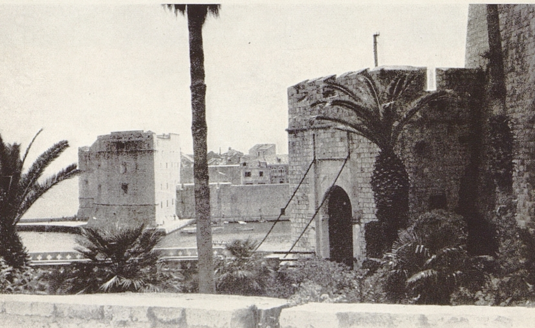
IL MURO VECCHIO DI DUBROVNIK

Nell'anno 1548 fu messo in scena il suo dramma pastorale TIRENA; e in quell'anno cominciò la sun