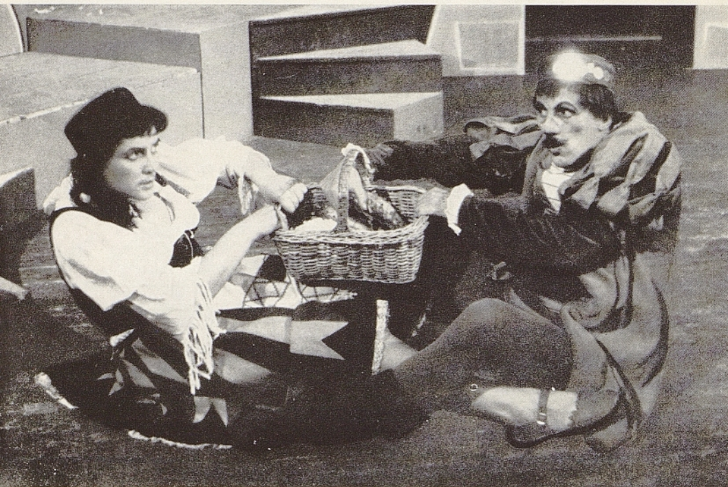
LA VISTA DA COMMEDIA »TRIPČE DE UTOLČE«

Adesso incomminano i guai per Tripce. Tripce, che teme di essere tradito dalla sua giovane moglie, è portato dalla sua immaginaria paura a chiudere Mande