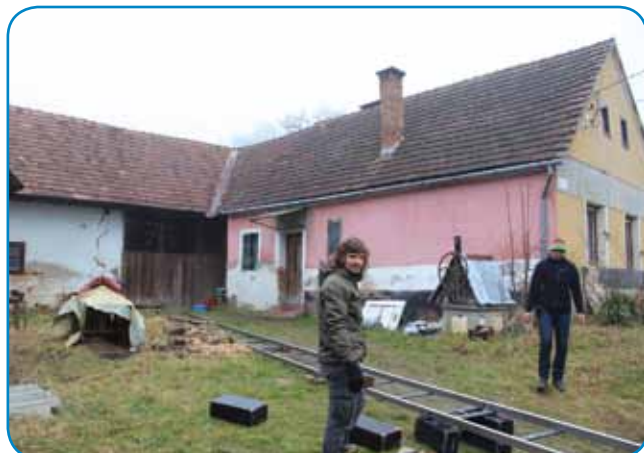
V gorenjesinički Soboti je ekipa pri rami cejlo malo štreko narejdla.