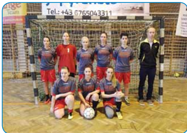
Že tretjič so v Monoštru priredili pokal ÁFÉSZ v dvoranskem nogometu, katerega se je udeležila tüdi ženska ekipa pod imenom Slovenska ves. Dekleta so zaradi športnega obnašanja postala priljubljena pri publiku.