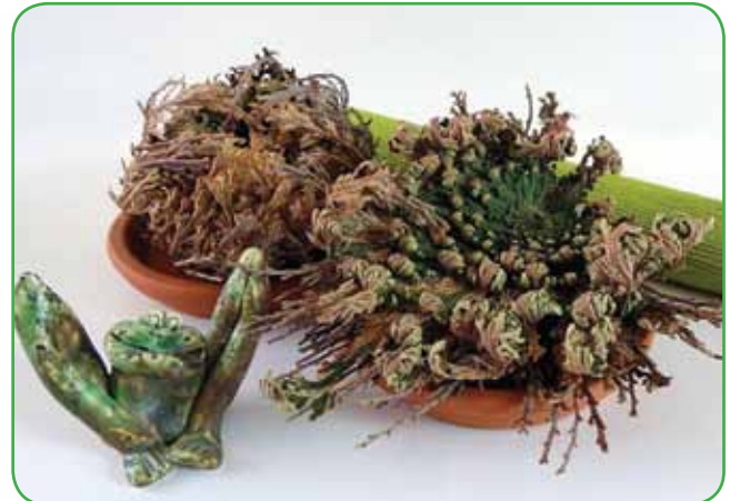
Jerihonska roža - puščavska rastlina, ki je večino svojega časa suha. Velja za simbol sreče, ljubezni in vstajenja ali čudež narave

do 80 centimetrov visoko. Za gnezdasti sršaj je značilno, da se čez nekaj časa na spodnji strani njegovih listov pojavijo rjavi progasti trosovniki. Je idealna rastlina za kopalnico. Pršimo jo z mehko vodo, od-