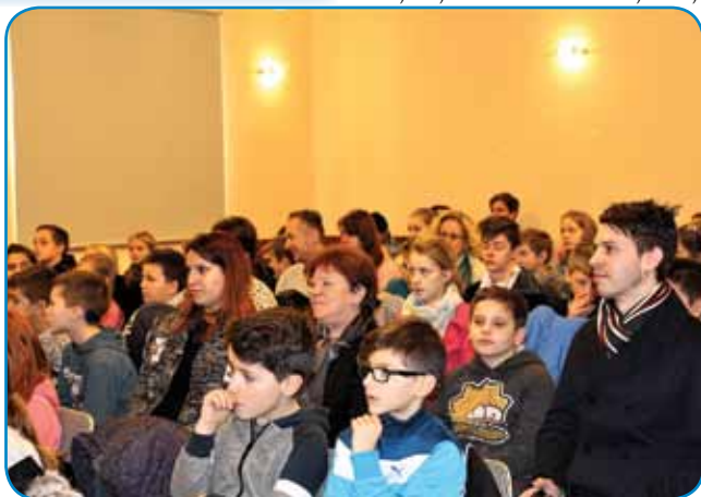
Otroška publika na Gornjem Seniku

venski literati (Andrej Rozman Roza, Slavko Pregl in Tone Partljič), svečana prireditev je bila v monoštrski gledališki dvorani. Svoj kratek nagovor sem zaključila takole: »In kako bo naslednjih 25 let? Slovenski umetniki bodo skupaj z društvom Bralna značka Slovenije zagotovo še prihajali v Porabje; koliko in kako jih bodo razumeli in čutili porabski šolarji, bo odvisno predvsem od vas, učiteljice in učitelji! Zgled branja slovenskih knjig ste lahko le vi, enako zgled slovenskega sporazumevanja v šoli in lojalnosti do slovenske materinščine. Ni druge poti, samo ta je, največkrat trnova, a vrtnice z najbolj ostrimi trni cvetijo naj-