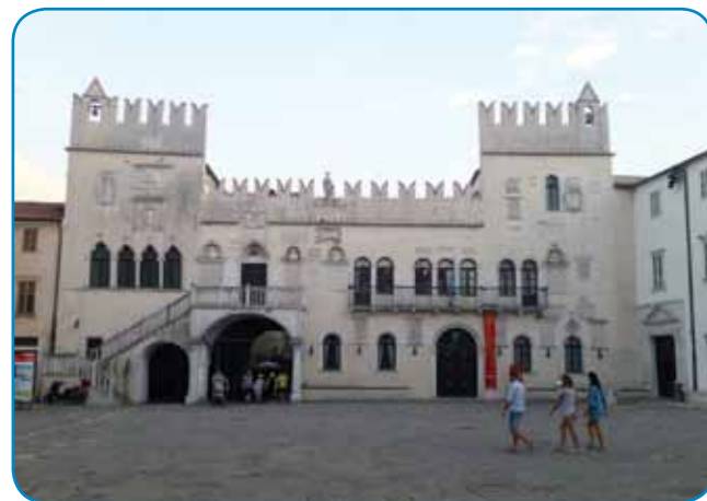
V pretorskoj palači v Kopri so ništerni kancelaji Univerze na Primorskom tó

na paut dale, depa naša padaškinja je pravla, ka una več néde nazaj na avtocesto. Ovaško paut sem ge tó nej pozno, gledati smo mogli navigacijski aparat, napo (zemljevid) pa eške čeden telefon. Müva na prejdnji sicaj sva mejla čütenje, kak liki bi se zvün nas niške nej po tej mali pa krivi poštijaj pelo.