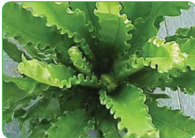
Gnezdasti sršaj s sijočimi nedeljenimi listi, ki dosežejo v premeru več kot meter in zrastejo do 60 centimetrov visoko

in filigranskimi lističi okrasijo vsak prostor, le zagotoviti jim moramo vlažen zrak, senčen ali polsenčen prostor, veliko svetlobe in ne prevroč prostor. Prav ob novoletnih praznikih sem podarila prijateljici luskasto praproti, saj sem vedela, da