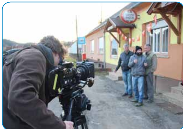
Režiser Ivanišin skrak Zavcove krčme tanače davle Škaper Tomini pa Lacini Lazar. Nad kamero direktor fotografije Gregor Božič gleda.