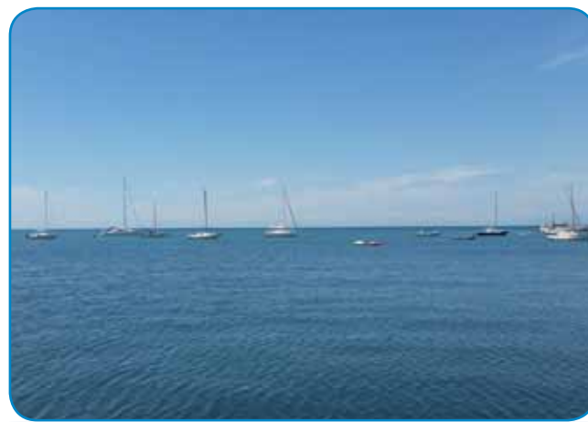
Maurdje je siva ravén brezi konca

maj smo naraučili kalamare ali tintne ribe na večéle moduše: pečene na grili, punjene s sirom pa z grbanji. Sejdli smo, gledali maurdje pa se na žmani nageli. V Kopri, šteri varaš je inda svejta na otoki (sziget) biu pa so ga samo kisnej vküperzozidali s kontinentom, je eške itak tak, ka je varaški štrand šenki za