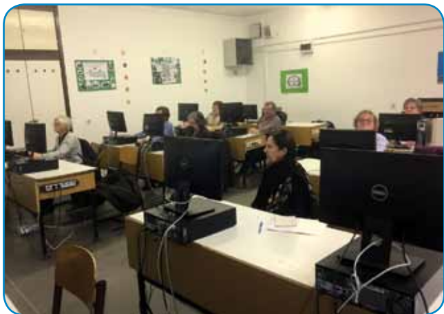
V monoštrskoj šauli je vsikši najgir penzionist daubo en mašin