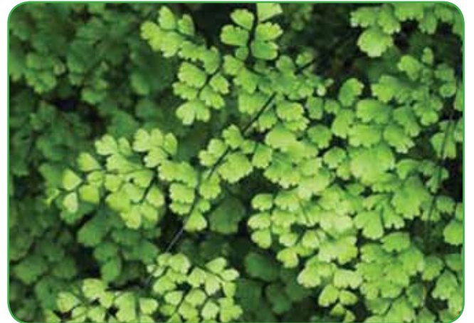
Adiantum ali venerini laski so nežna praproti, primerna za obešanke in tudi v floristiki

dajali tudi praproti z imenom gnezdasti sršaj. V Sloveniji je znanih najmanj enajst vrst te praproti. S svojo rozetasto rastjo in širokimi nedeljenimi svetlozelenimi listi in rjavim osrednjim rebrom lahko lepšajo velik del prostora, v premeru tudi do enega metra in