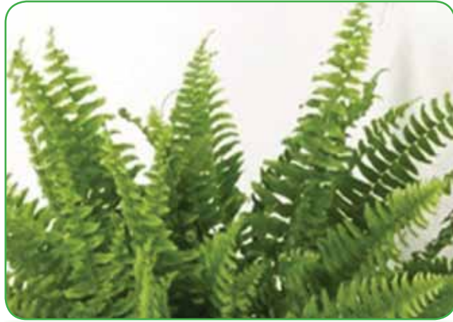
Luskasta praproti ima šopasto rast. Zagotoviti ji moramo svetlo do polsenčno mesto

Praproti so med ljubitelji rastlinja redko razširjene, tam pa, kjer jih najdemo, so prekrasne. Praproti s svojimi širokimi mahali (veliki deljeni listi)