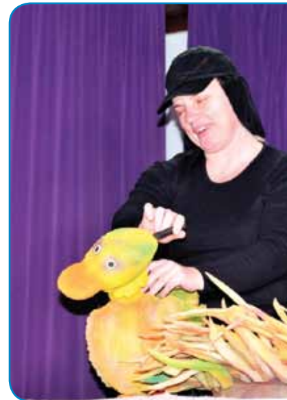
Prizor iz Andersenov

označijo za grdega. V ospredje je postavljen motiv drugačnosti