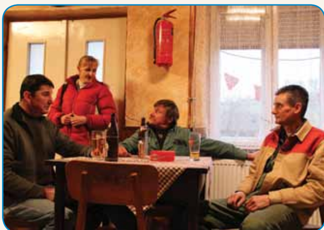
BREZI LIDI NEGA FILMA stran 4