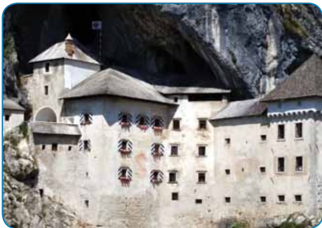
Velka črna lüknja za predjamskim gradom skriva paut na drugo stran

Nauč nas je najšla pá na Titovom trgi. Pá smo vidli tri erične zidine: Marijino katedralo, štera je center koprské püšpekije, pretorsko palačo, v šteroj so občinski pa županski kancelaji, pa »loggjo«, malo teraso z arkadami, gde je gnesneden oprejta kavarna. Na pretorsko paloto pelajo od zvüna stube, na štere smo gorsplezdili. Gnauk je samo prišo eden mladi moški, pa engleski pito, ka tam dela-