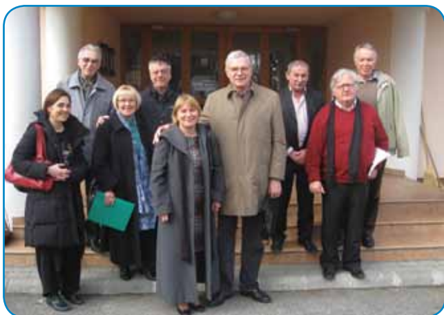
Slika s srebrnega jubileja Bralne značke v Porabju z eminentnimi slovenskimi literati in organizatorji prireditve

lepše...« Te besede veljajo tudi ob 30-letnici.