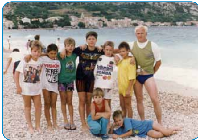
Kak škonik s šaulari na mordji v Baški