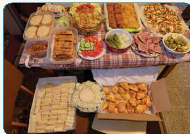
SREČALE SO SE »STARE KOKAUŠI« PA... stran 8