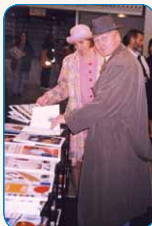
SLEDITI TRBEJ SVOJIM SENJAM stran 5