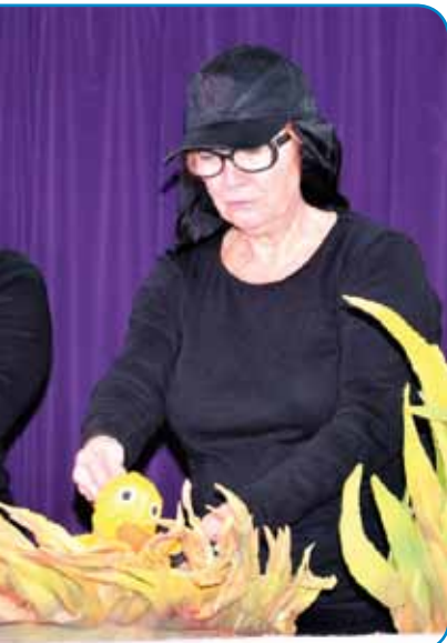
e pravljice Grdi raček

nejo naše najboljše prijateljice, kajti – kot je zapisal legendarni