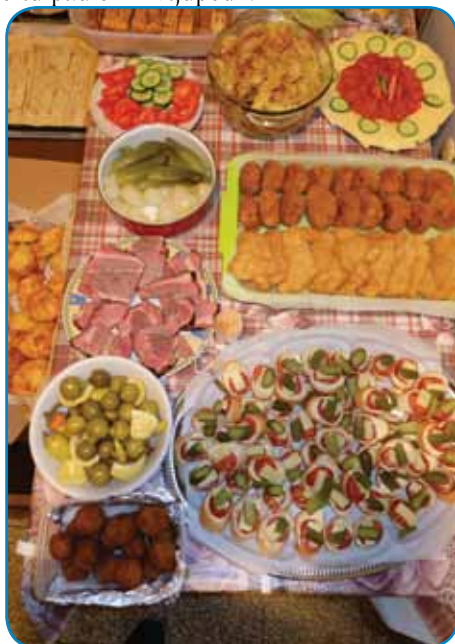
Na stauli je bilau telko vsega dobroga, kak če bi se pripravljali na gostüvanje