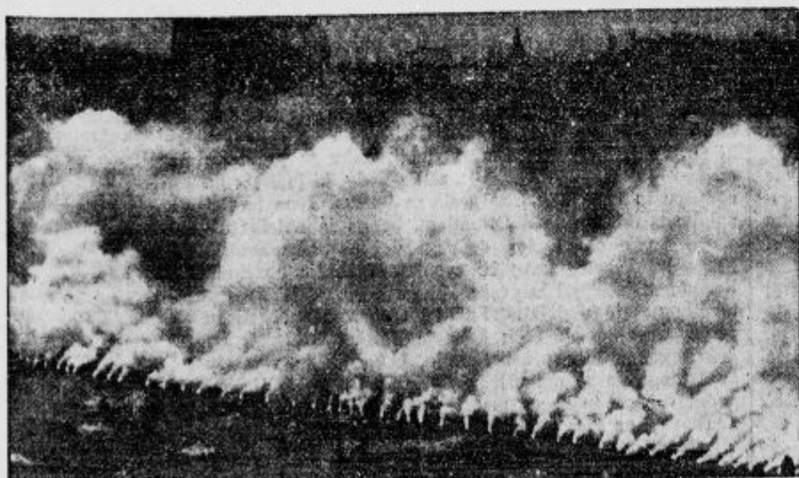
Na Poljskem so pred kratkim preizkusili obrambno moč Varšave proti napadom iz zraka. Slika nam kaže sameglitev poljske prestolnice. Okrog in okrog Varšave so postavili aparate, ki se kmalu izbruhali toliko megle, da se mesto ni več videlo.