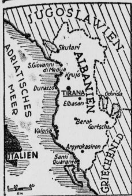
Zemljevid po Italijanih sasedene Albanije