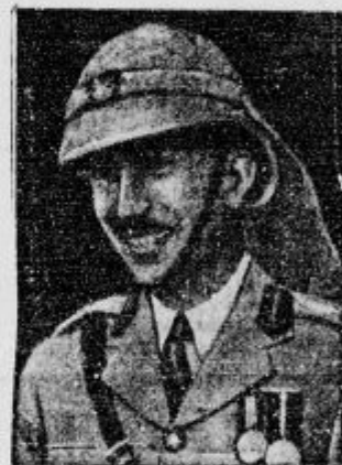
Iraški kralj Ghazi, ki se je prejšnji teden smrtno ponesrečil pri avtomobilski vožnji.