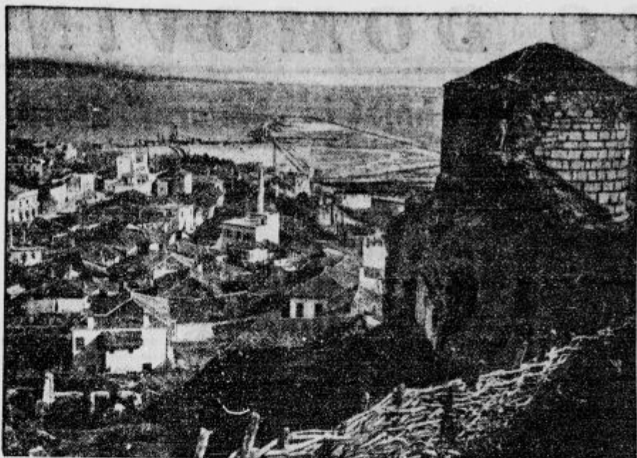
Albansko pristanišče Drač, kjer so se najprej izkrcale italijanske čete, čeprav so jih Albanci nekajkrat pognali nazaj.