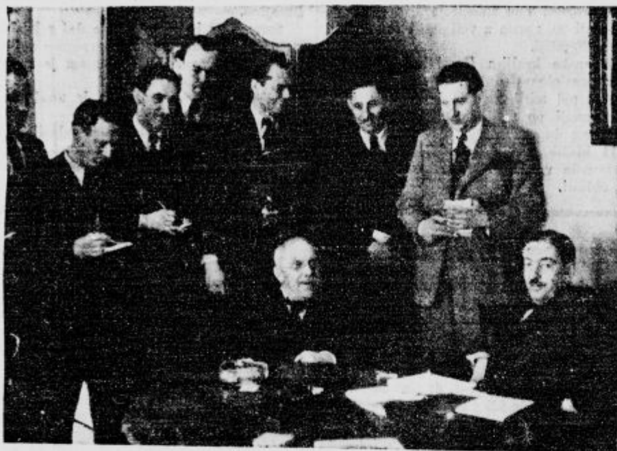
Predsednik vlade Cvetkovič in dr. Maček med časniki.