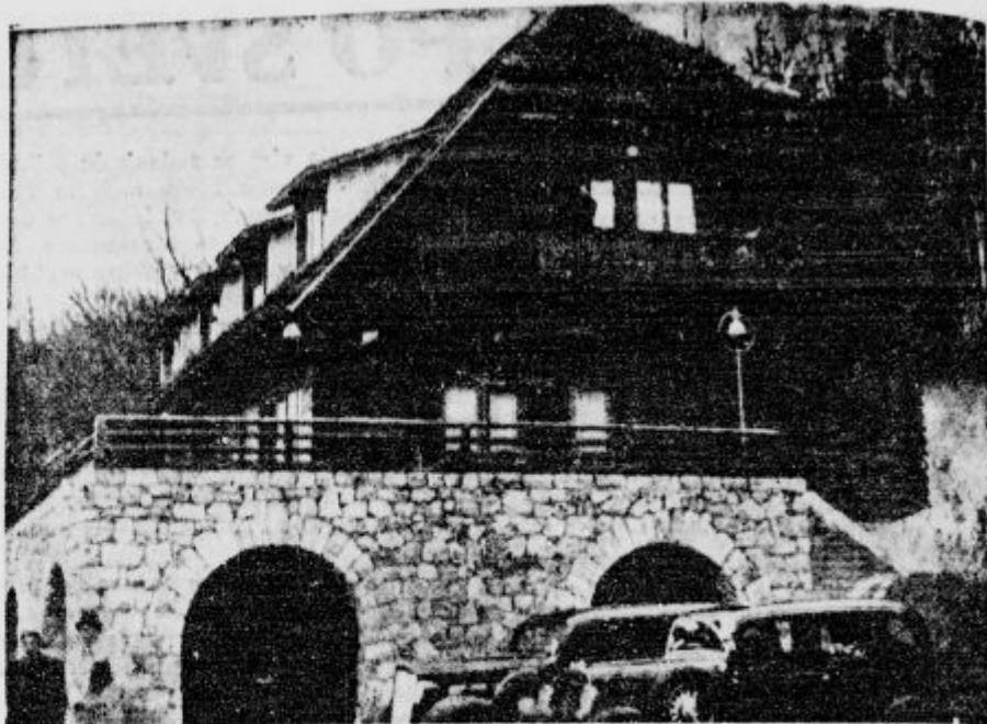
Vila Rebro pri Zagrebu, v kateri je te dni stanoval ministrski predsednik Cvetkovič.