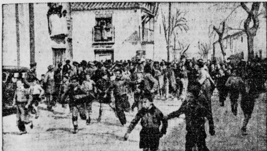
Slika nam kaže mladino v predmestju Madrida, ki je vsa vesela drla po ulicah, da čimprej vidi Francove vojake, ki so napravili konec neznošnemu stanju, ki je vladalo pod rdečimi.