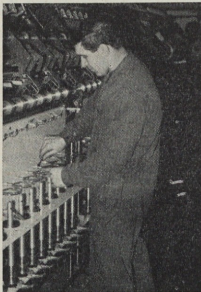
Montža drugega predilnega stroja

— v statutu so nova določila, ki točno določajo zahtevek po obveznem razpisu vseh vodilnih delovnih mest, kamor so vključena vsa ona, ki zahtevajo visokošolsko izobrazbo.