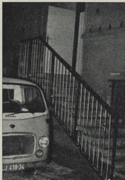
Vhod v upravo obrata za družbeno prehrano je sedaj drugod. Tja vodijo stopnice, na vzhodni strani stavbe Zg. Jarše 21

Na kvaliteto izdelkov ostalih obratov je, poleg slabe kvalitete surovin, vplivala premajhna kontrola proizvodnih procesov in nemalokrat tudi slab odnos do tkanin. To zadnje velja še posebno za tkanine iz sintetične in polsintetične, saj imamo tam manjvrednega izdelka več, kot pri ostalih grupah tkanin.