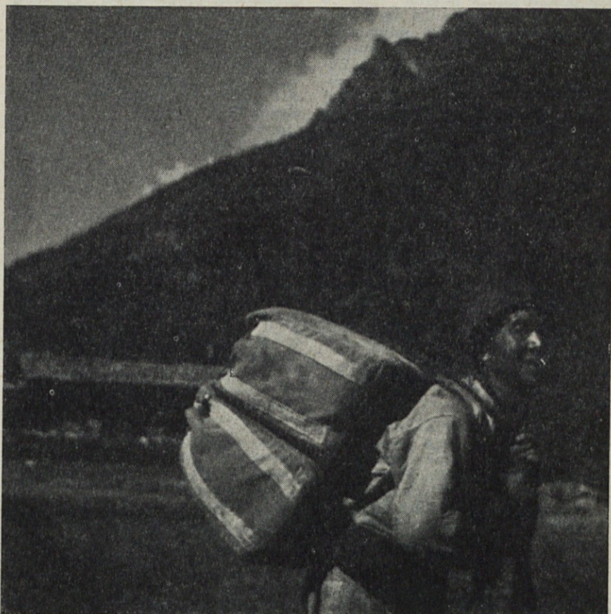
Prtljaga himalajske odprave je bila omotana v naše platno

Izdaja v 850 izvodih kolektiv tovarne Induplati. Odgovorni urednik Otmar Lipovšek. Natisnila in klišeeje izdelala Tiskarna »Jože Moškrič« v Ljubljani