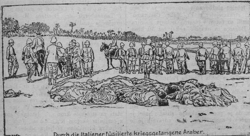
Durch die Italiener füsilierte kriegsgefangene Araber.

Naša slika kaže krvav prizor iz tripoličanskega bojišča. V ospredju vidimo kup mrličov na smrt obsojenih in postreljenih Arabcev. V ozadju pa je opaziti odhaja-