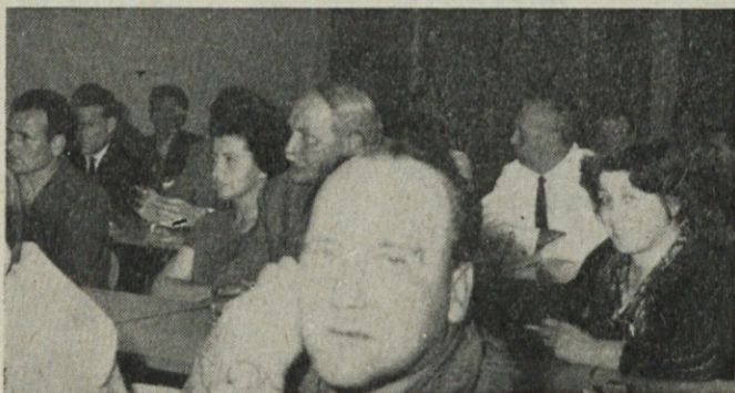
Konferenca ZK v Induplati