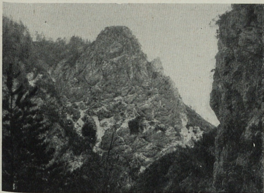
Tudi gore vabijo, da na njih preživite del svojega dopusta