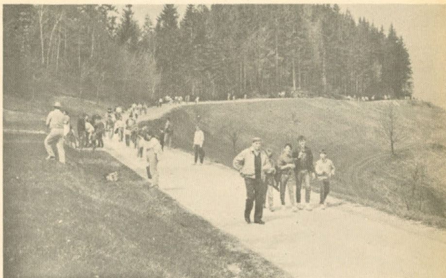
Če nam vreme ne bo ponagajalo, se 1. maja snidemo na Graški gori!

Tudi izenačevanje svobode in demokracije je torej nevarna zabloda.