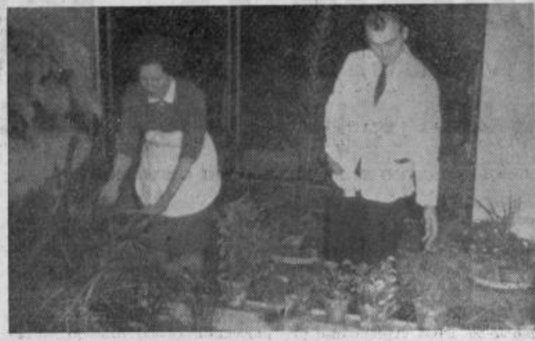
Skorajda bi mislil, da si v rastlinjaku — toda ta vrtič osvežuje prijetno vzdušje v velenjskem delavskem klubu, ki je postal središče kulturno zabavnega življenja v Velenju

za slabo udeležbo. Prav letošnje razprave morajo dokazati, da je sestava občinskega plana skupno delo, ki nastane ob sodelovanju vseh občanov. Seveda bo pri tem upravni aparat občine imel nekaj več dela. Dosegli pa bomo resnično socialistično demokratična načela.