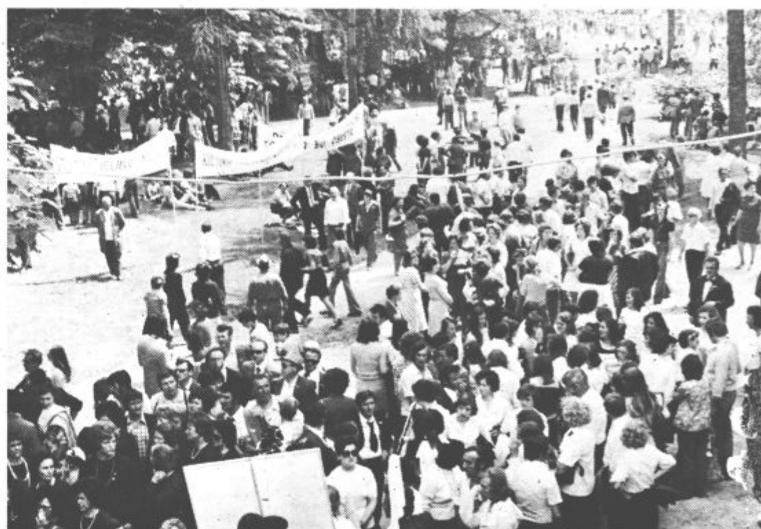
Nastopajoči na osrednji slovesnosti v Celju (levo) – Več tisoč udeležencev je prišlo v Celje s transparenti, pesmijo in vedrostjo.