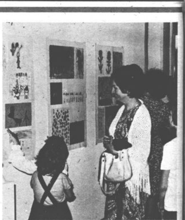
Mamice in očetje so si z velikim zanimanjem ogledovali risbe in druge izdelke svojih otrok.

Kot kaže, je našo dolino zajela pravcata trim mrzlica. Prejšnjo nedeljo je šoštonjski Partizan organiziral trim kolesarjenje, pojutrišnjem vabi vse ljubitelje na trim kolesarjenje s štartom ob Velenjskem jezeru komisija za šport in rekreacijo pri občinskem sindikalnem svetu. Medtem šoštonjski Partizan že napoveduje trim plavanje. Takšno zagnanost organizatorjev je vsekakor treba pozdraviti, saj so nam razne rekreacijske dejavnosti več kot potrebne. Prav pa bi bilo, da bi jih popestrili še z novimi, doslej še neorganiziranimi. Zato bi bilo vredno razmisliti o predlogu velenjskih vzgojiteljic – zapisan je na plakatu v Najdihojci, da bi kdo organiziral še trim ČVEKANJE. Verjetno bi bila to najbolj množična akcija. Žal, moški najbrž ne bi prišli do besede.