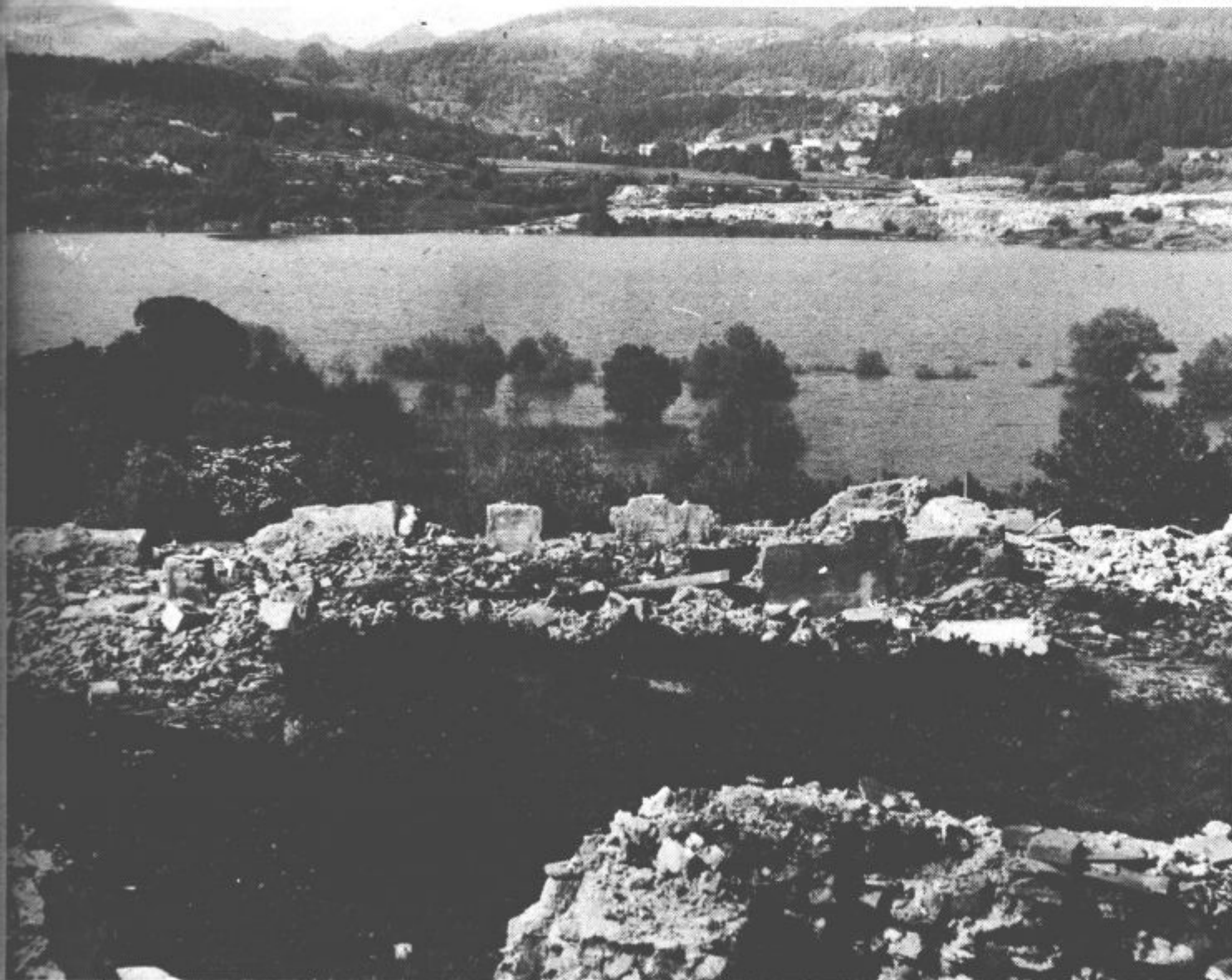
Zaradi pogreznosti zemlje nastajajo v Šaleški dolini večja jezera.

Navzlic vsem težavam pa bo delovni kolektiv zdravilišča Dobrna jubilejno leto nadvse slovesno proslavil. Poleg jutrišnje proslave, se bodo tja do konca leta zvrstile številne kulturne prireditve.