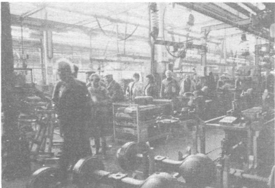
Viški avtoprevozniki v mariborski tovarni motorjev in avtomobilov

Obisk krajanov svojcev cicibanov je bil proti pričakovanju zelo velik, saj je bila dvorana polna. T. SLOBODNIK