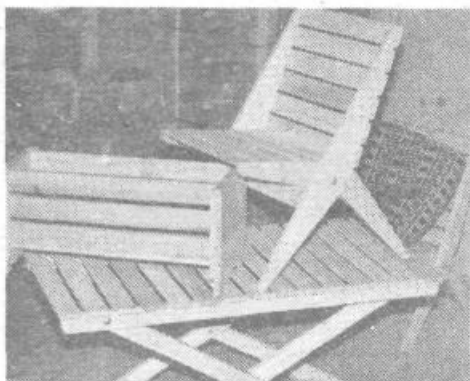
440x45x10 mm velike lesene letvice so uporabne za številne namene, predvsem radi pa jih imajo v otroških vrtcih in šolskih delavnicah, saj omogočajo otrokom in šolarjem enostavno in hitro oblikovanje najrazličnejših predmetov iz lesa

Vsi delavci HOJE iz Roba, Podpeči, Polhovega Gradca, Ižanske, Kopske in Langusove ceste se zahvaljujejo kupcem za zaupanje v 1986. letu in želijo svojim poslovnim družabnikom, naročnikom in še posebno kupcem na Koprski 92 zdravo in uspešno 1987. leto.