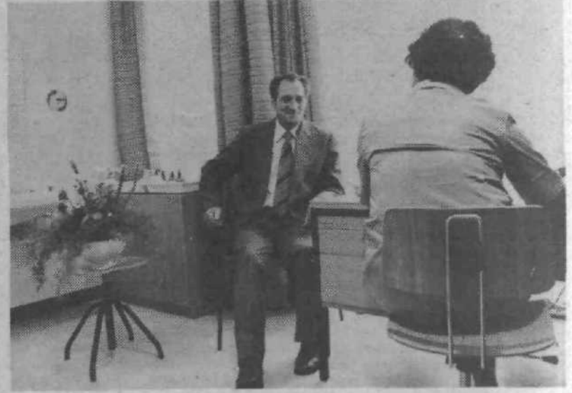
Nova ambulanta v Zdravstvenem domu na Kržičevi za borce NOV bo delovala vsak dan, tako da bodo praktično vsi borci deležni zdravljenja in preventive