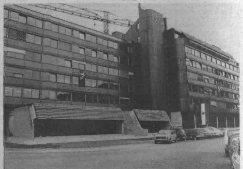
Delovna organizacija Commerce se je dolga leta stiskala v neprimernih prostorih. Končno so vse svoje dejavnosti spravili pod novo bleščečo streho v Einspielerjevi ulici