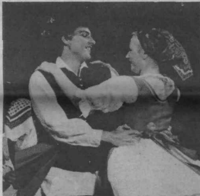
Nastop folklorne skupine iz Savelj je tudi pripomogel k slavnostnemu razpoloženju v Beričevem.