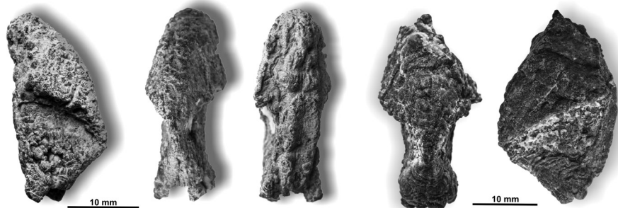
Ostanki rinholitov rodu Nautilorhynchus iz karnijskih plasti pri Crngrobu.

Iz crngrobškega najdišča smo odkrili devet prepoznavnih ostankov, od katerih so štirje z značilnimi morfološkimi znaki rinholitov. Med najbolj ohranjenimi smo razločili dva morfološka tipa, ki se ločita tako po obliki kot dimenzijah. Večje rinholite (trije primerki) smo taksonomsko lahko pripisali rodu Nautilorhynchus .