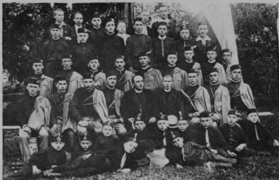
Orlovski odsek pri Sv. Marjeti niže Ptuja je slavil 18. julija tega leta petletnico svojega obstoja.