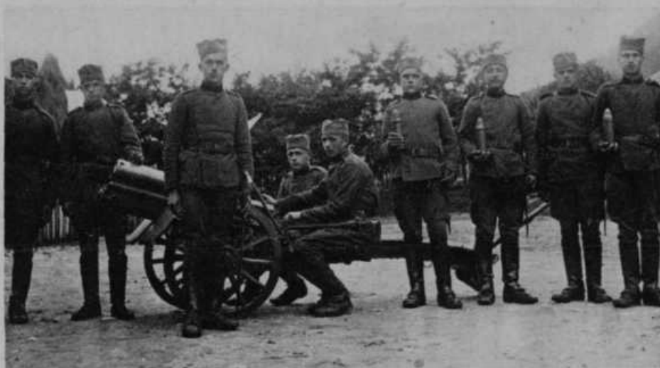
Ko pa minejo naborni dnevi vriska, petja in godbe, tedaj je kmalu treba pripasati »bridko sabljico« in resni dnevi vojaškega življenja se začno. Slovenski fantje so znani kot dobri in vestni vojaki, ki delajo čast jugoslovanski armadi. — Slika nam predstavlja naše fante topničarje ob njihovem topu.