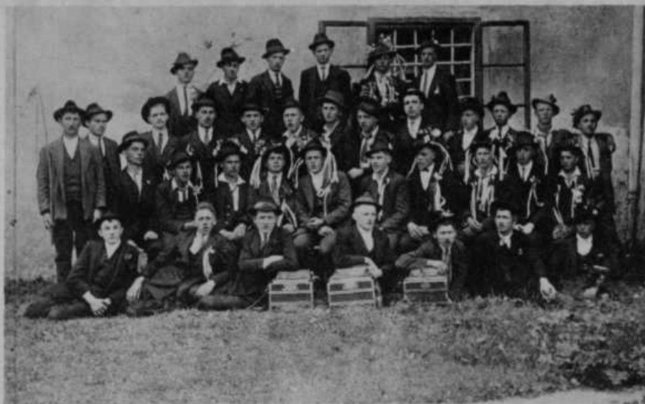
Kadar gredo naši fantje na nabor, tedaj so veseli in glasni. Okinčajo se s pušeljci — roženkravt, rožmarin, rosetelj, nagelj in gartroža, to so fantovske rože — in s slovenskimi trakovi. Godcev ne sme manjkati, če ne, ni stopnje in pavze so dolgočasne. Ostuden pa je nabornik, ki je pijan. Slika nam predstavlja letošnje nabornike iz občine Rovte nad Logatcem.