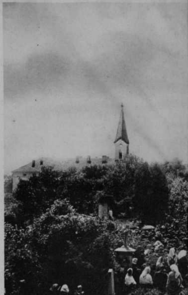
Ob priliki kmetijskih dnevov ob velikem Šmarnu in svetega škofa Antona Martina Slomška. Ob katerem je slikal življenje svetega vladike kot ljudstva. Iz njegovega svetega življenja so se za procesa, da se proglasi za svetnika. Mnogo ljudi