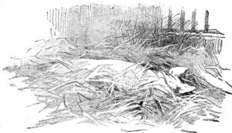
Pod. 32. Prasič, bolan na rdečici.

Znaki bolezni so sledeči: Prasič, ki je mogoče še zvečer z veseljem jedel, drugo jutro ne pride h