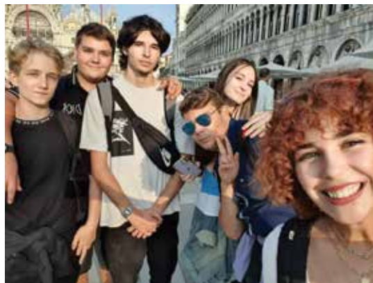
Slika 3: Dijaki na ekskurziji v Benetkah, septembra 2021

Delavnica, kjer smo hoteli dijake ozavestiti o kompleksnih sodobnih problemih, je bila izvedena na primeru Benetk, kjer se soočajo s sobivanjem prebivalstva in potrebami podjetnikov, prisotnostjo masovnega turizma in odločitvami na občinski in regijski ravni. Za to tematiko smo se odločili zaradi ekskurzije v Benetke, kamor so dijaki šli septembra 2021.