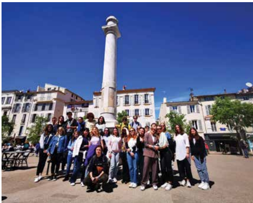
Slika 4: Udeleženci jezikovnega tečaja in izleta v Antibes, april 2022

Wikipedia. https://upload.wikimedia.org/wikipedia/commons/thumb/6/63/A_large_blank_world_map_with_oceans_marked_in_blue.svg/1280px-A_large_blank_world_map_with_oceans_marked_in_blue.svg.png