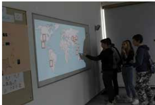
Slika 2: Geografska delavnica med dnevom odprtih vrat, novembra 2018

Delavnico so nato preizkusile med poukom geografije v 3. letniku in tako preverile, ali so njihovi opisi dovolj natančni in je igra izvedljiva in za »igralce« zanimiva.