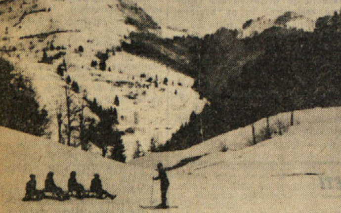
Smučišča na Livku

SPDT priredi v nedeljo 7. t.m. smučarske tekme na Livku. Tekmovalci bodo razdeljeni v tri skupine: