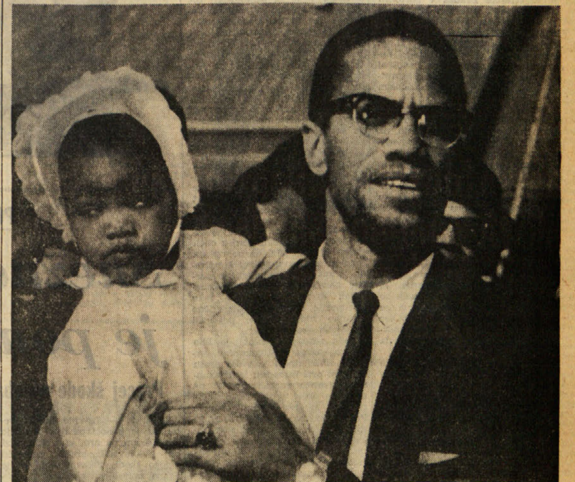
Slika kaže ameriškega črnega voditelja Malcolm X, ki je bil nedavno umorjen, s hčerko Ilyeah na letališču Kennedy