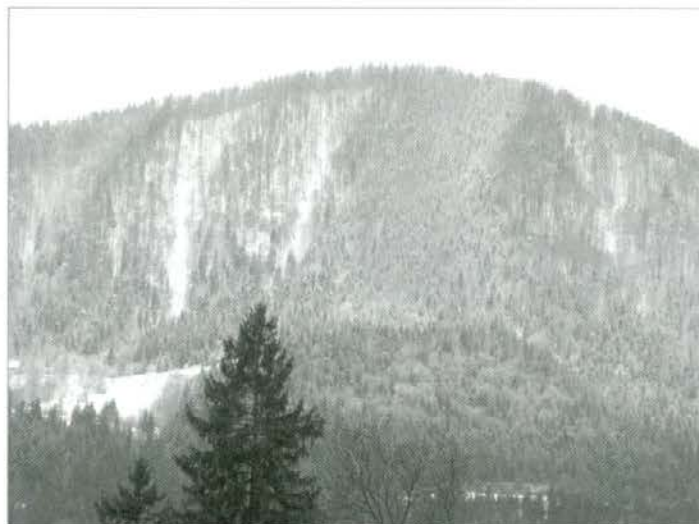
Rahlo zasneženi Hom z Navrškega vrha (3.2.2008)