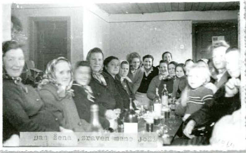
Dan žena na Razborju leta 1964

Lepo smo se imele in sprejele sklep, da bomo tako praznovali vsako leto. Pa ni bilo vedno mogoče. Leta 1974 je zapadlo toliko snega, da so bile poti skoraj neprehodne. Tako smo praznovanje prestavile na mesec april. V tem času sem se mudila v Slovenj Gradcu in srečala novinarko radia Slovenj Gradec. V pogovoru sem omenila, da praznujemo dan žena. Zdelo se ji je tako zanimivo, da me je povabila v studio in sem morala o tem javno govoriti po radiu. Imela sem veliko tremo, vendar me je voditeljica spodbujala in tema je počasi izginila. Tako so minevala leta, danes praznujemo ta dan drugače, kakor pač kje.