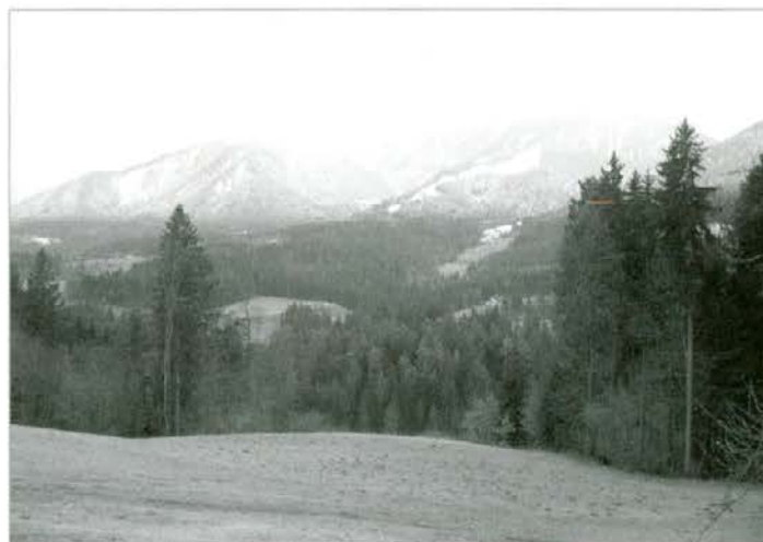
Snežna meja pod Uršljo goro (3.2.2008)

nem srečanju »Hrvaški dnevi varstva rastlin«. 8. februarja 2008 sta se srečanja udeležila direktor ZGS Jošt Jakša, ki je imel tudi strokovno predavanje, in vodja oddelka za gojenje in varstvo gozdov Zoran Grecs.