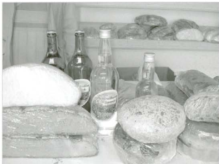
Česa vse ne ponuja Brdnikova kmetija ...