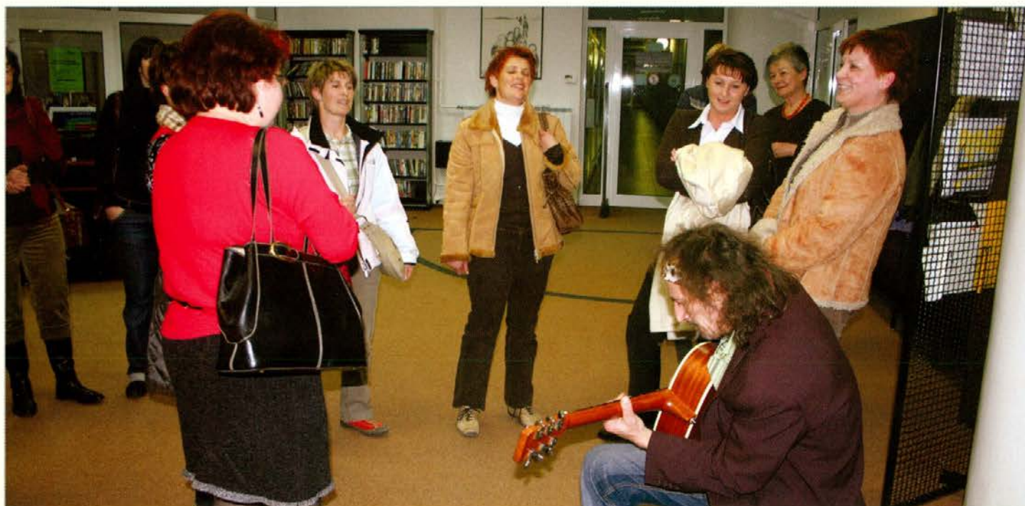
S skupino Kaplja čez rob