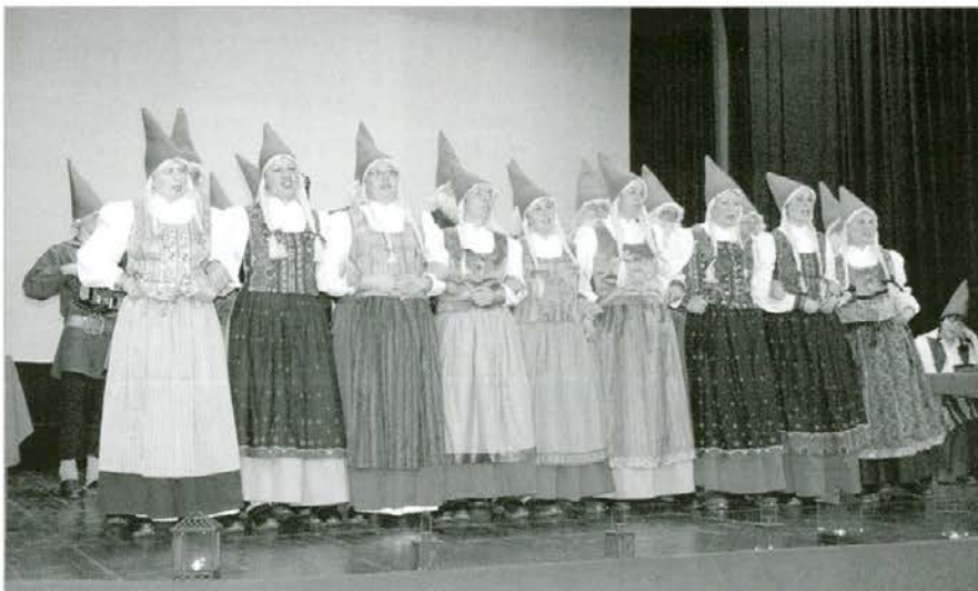
Priveditev so popestrili tudi pevci Škratov.