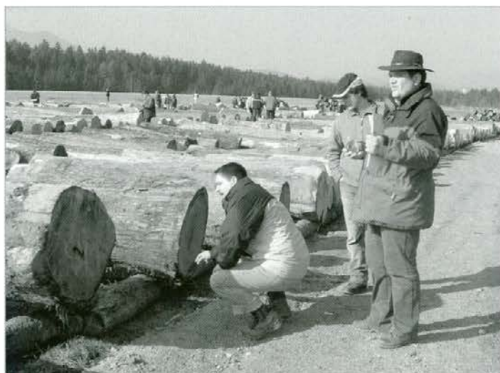
Na 2.licitaciji vrednejše hlodovine v Turiški vasi