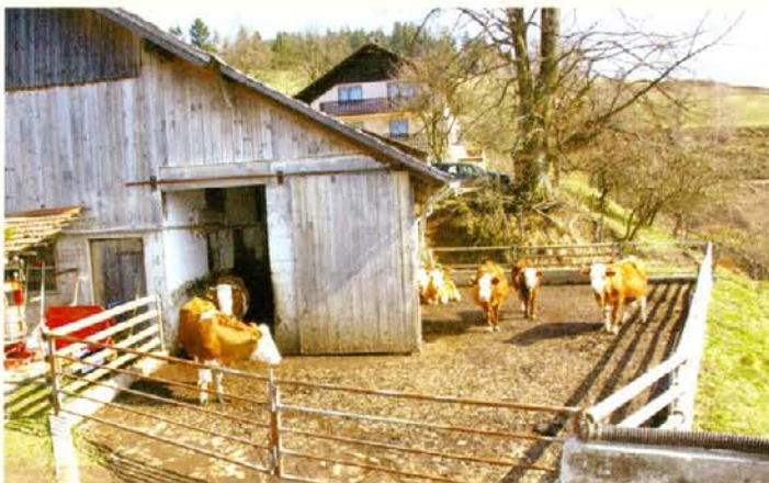
Črešnikova živina pred hlevom