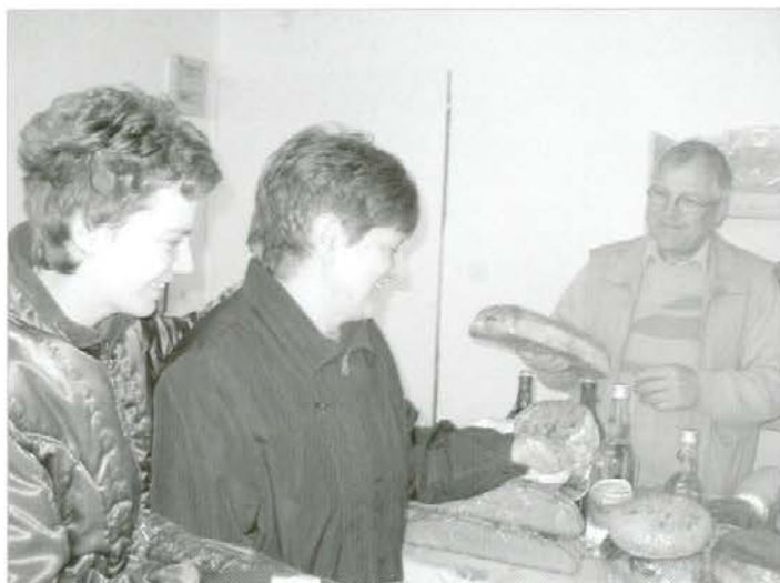
Kupci s s ponujenimi dobrotami doma pridelane hrane zelo zadovoljni.

dajalko in prodajalca iz okolice Ptuja. Oba trdita, da sta s prodajo zelenjave in drugih kmečkih pridelkov v Slovenj Gradcu zelo zadovoljna, zato se sprajujemo, zakaj se naši domači kmetje bolj ne poslužujejo teh oblik direktne prodaje. Morda pa jih bo k temu le vzpodbudil vzgled domačije Brdnik iz sosednje dravogradske občine.