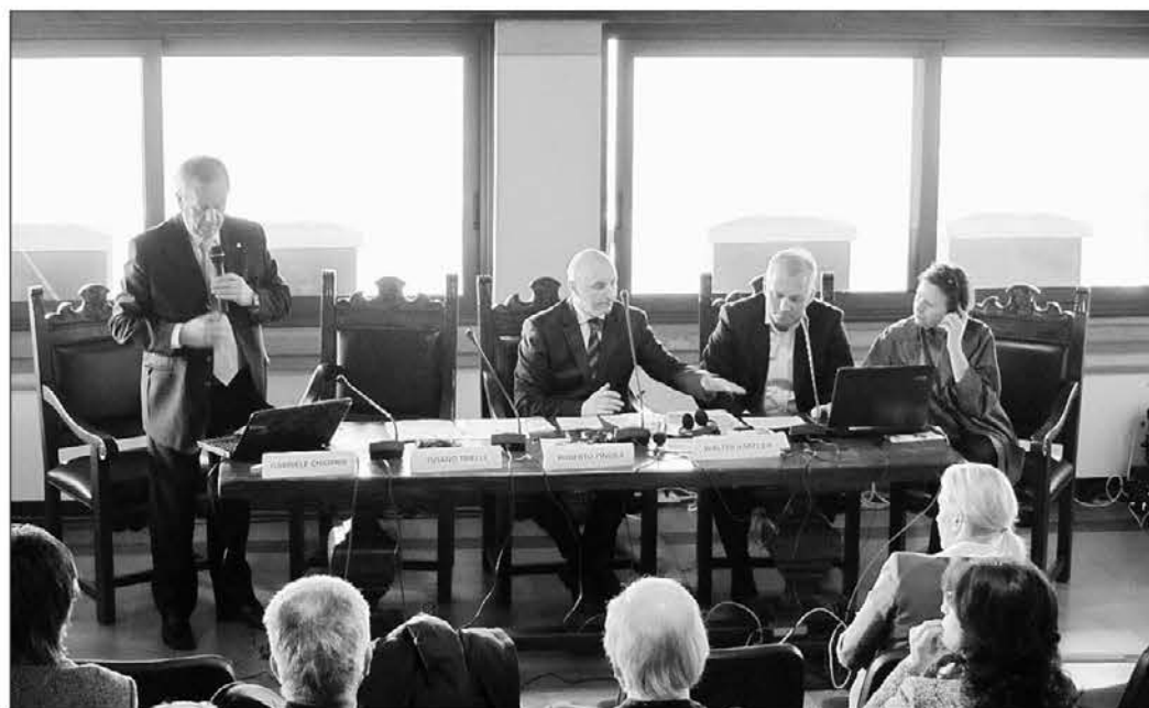
A sinistra un esempio di mini impianto fotovoltaico, sopra un momento del convegno tenutosi a Tarcento

Il dato che emerge è che la Carinzia è avanti anni luce rispetto a noi nello sfruttamento delle energie rinnovabili: fin dagli anni '50 la Regione incentiva l'utilizzo di impianti energetici ecocompatibili. In materia energetica per il 2007-2015 gli obiettivi sono assai ambiziosi: un aumento del 50% del teleriscaldamento; un impianto fotovoltaico ogni tre edifici; un aumento del 7% dell'energia elettrica da centrali mini idroelettriche e lo sfruttamento dell'80% del le-