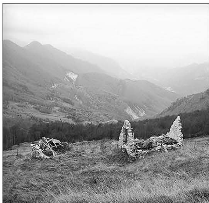
Panorama della Val Resia

del centro estivo per conto dell'Amministrazione comunale nel mese di luglio; il sostegno burocratico a diverse associazioni e manifestazio-