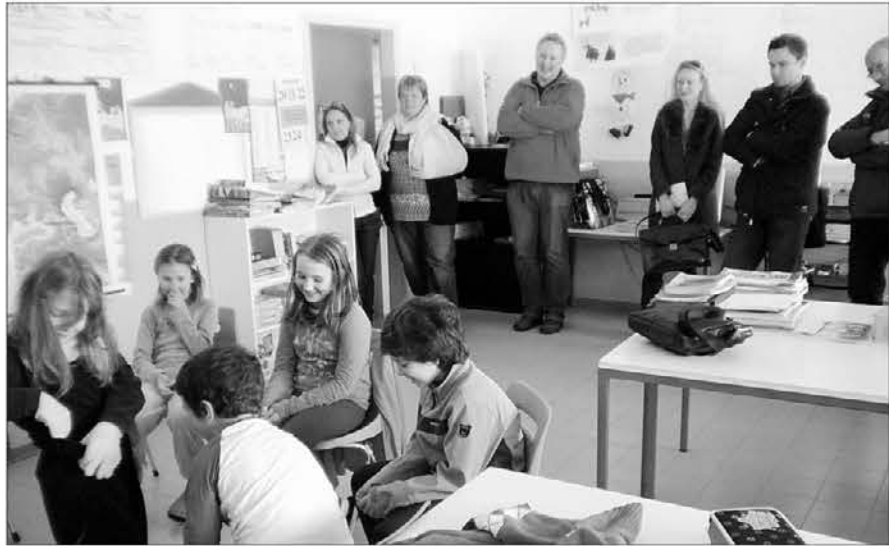
S srečanja v Kanalski dolini, spodaj sedež Sks Planike

O poučevanju slovenščine v Kanalski dolini s predstavniki Slovenije