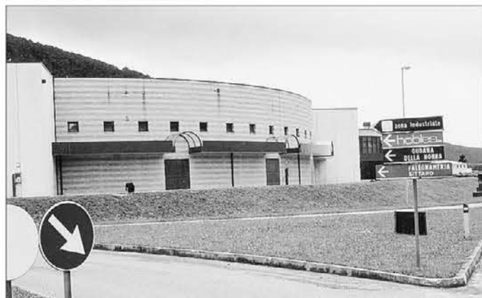
Un'immagine del Piano di insediamenti produttivi di S. Pietro