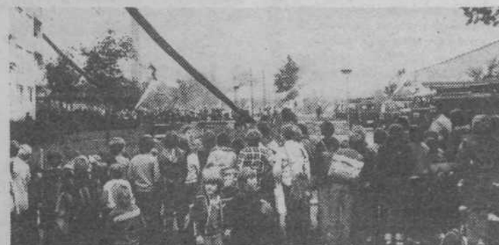
Iznenada se lahko zgodi marsikaj. Zato moramo biti vedno pripravljene na vsakršne nepredvidene nesreče. Nedavna družena akcija vseh reševalcev v naši občini je pokazala, kako je treba hitro, organizirano in nesebično reševati ljudi in imetje naših delovnih ljudi in občanov. Šolo so v trenutku izpraznili, iz stolpnice so reševali ponesrečene, težko ranjene so obvezovali itn. Akcija je povsem uspela.