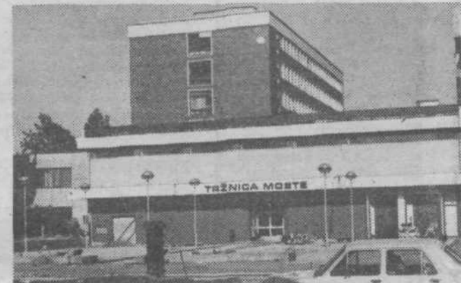
Če ne bo več nobenega če... se bodo tule čez mesec dni med prodajalci že drenjali kupci.

O prostorih bivše lekarne na Zaloški cesti št. 47 je razpravljali izvršni svet naše občinske skupščine. Občinski samoupravni stanovaljski skupnosti, ki upravlja s temi prostori, je predlagal, da jih odda Ljubljanski banki — Gospodarski banki za poslovalnico na našem področju, vendar pod pogojem, da bo v njih opravljala gotovinsko poslovanje z občani.