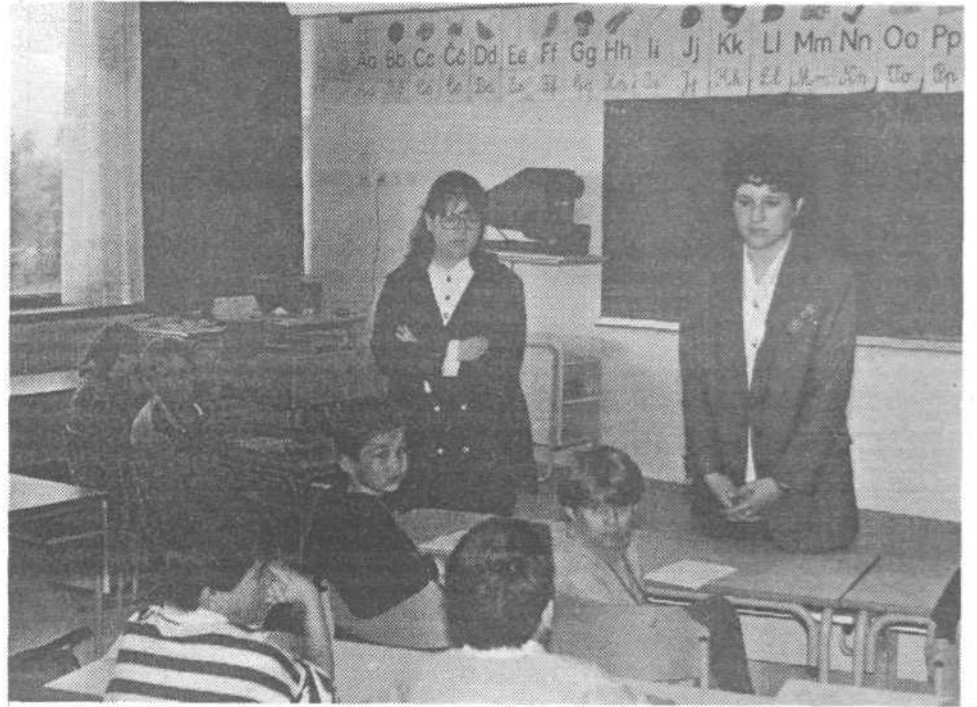
Z dvema učiteljicama je lažje