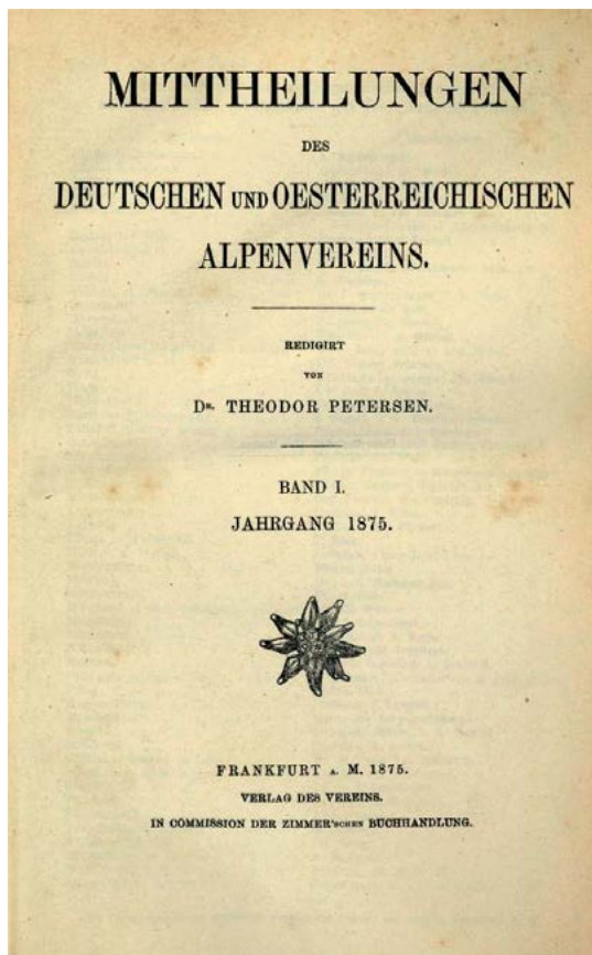
Naslovnica uradnega lista nemško-avstrijskega planinskega društva DÖAV iz leta 1875.

Zaradi vse širše dejavnosti društva in podružnic je od leta 1881 naprej časopis izhajal vsakega 20. v mesecu,