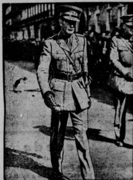
Bivši angleški zunanji minister lord Eden je pred kratkim oblekel vojaško uniformo in stopil prostovoljno v vojsko kot pehotni major.