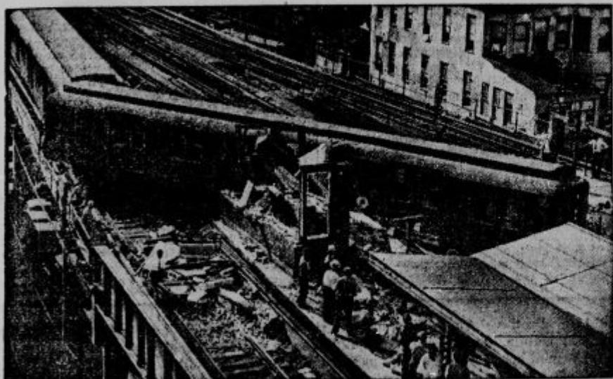
Na nadecestni železnici v New Yorku je eden izmed voz skočil s tira, podrl čuvajnico in poševno obledel na progi; 16 oseb je bilo ranjenih.