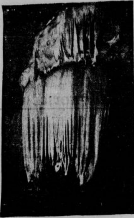
Ogromen kamenit slap, ki visi s stropa velike, na novo odkrite jame v Županovi jami pri Grosuplju.