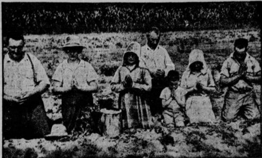
V okolici mesta Long Island je letos vladala velika suša. Slika kaže verno družino nekoga kmeta, ki na polju moli za dež.