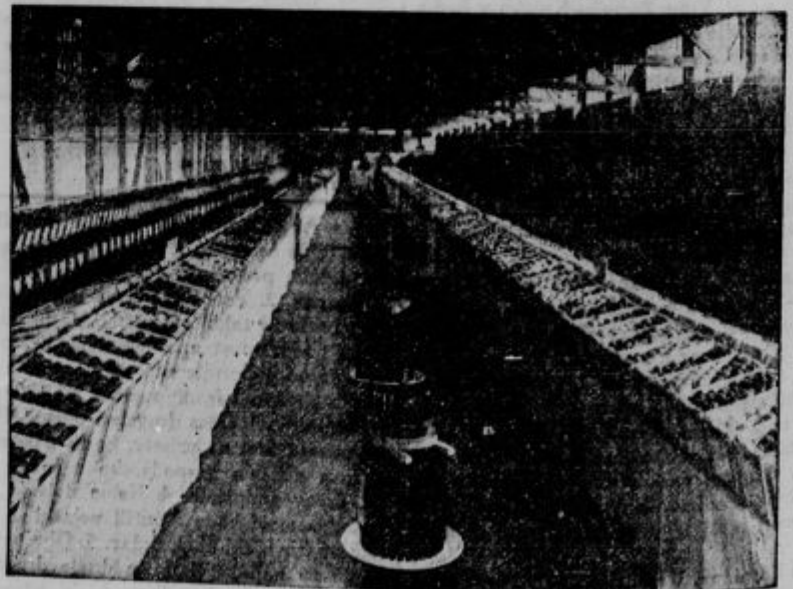
Kmetijska razstava na velesojmu. — Oddelek za sadje.