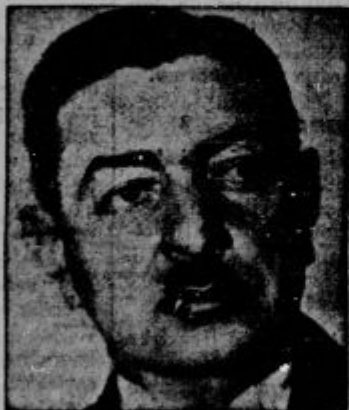
Predsednik Dragiša Cvetković

Pa še iz enega razloga smo veseli sporazuma. Naše gibanje gleda lahko s ponosom nazaj v borbe zadnjih let. Pokazalo se je, da je bila naša pot pravilna. Vedno smo govorili, da je treba v državi sodelovati, da se je treba boriti za svoje pravice korak za korakom. Kdor hoče uspehov, ne more stati ob strani. Danes tudi Hrvatje za nami ubirajo isto pot. Hrvatski voditelj dr. Vl. Maček ne stoji več ob strani, ampak sedi v belgrajski vladi in z njim še štirje njegovi ministri. Hrvatje in en njegov stalni zaveznik iz kmetsko demokratske koalicije. Sodeloval