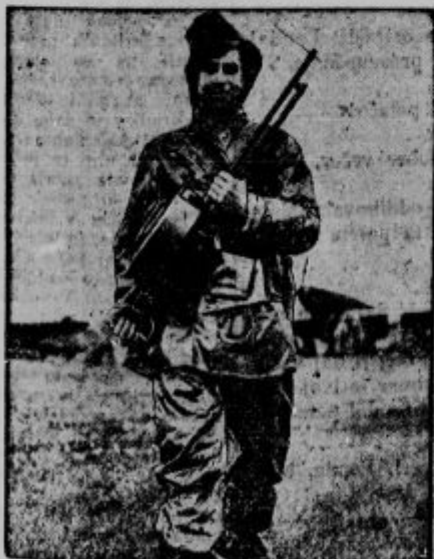
V angleških vojaških letalščih ima osebje posebne vrste obleke, skozí katere ne morejo strupeni plini. Te obleke bodo uporabljali v bodoči kemijski vojni.