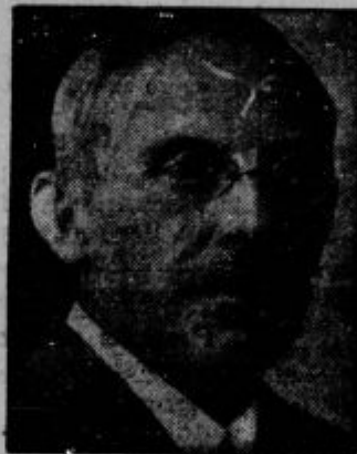
Podpredsednik dr. Vladko Maček

sko. In s posebno uredbo je spet določeno, da se morejo s kraljevimi uredbami razširiti predpisi uredbe o hrvatski banovini tudi na ostale banovine. Menda ni treba posebej poudarjati, da bomo Slovenci v smislu te zadnje uredbe zahtevali, da se prenašajo pristojnosti, ki se prenašajo na hrvatsko banovino, tudi na Slovenijo. Želeli bomo zdaj predvsem to, da se začne hitro v življenju izvajati vse, kar je v uredbi danega hrvatski banovini zaenkrat na papirju. Ko bo prihajala ta banovina dejansko do novih oblasti, bomo tudi mi prihajali stvarno do tiste samouprave, ki smo jo tako dolgo zahtevali in ki smo se ji zdaj končno vendarle približali.