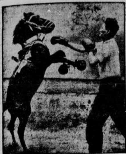
Nek Avstralčan je tako adresiral svojega konja, da se zna tudi boksati s svojim gospodarjem.