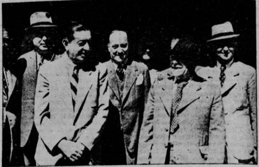
Predsednik vlade Cvetkovič in dr. Maček na Bledu.