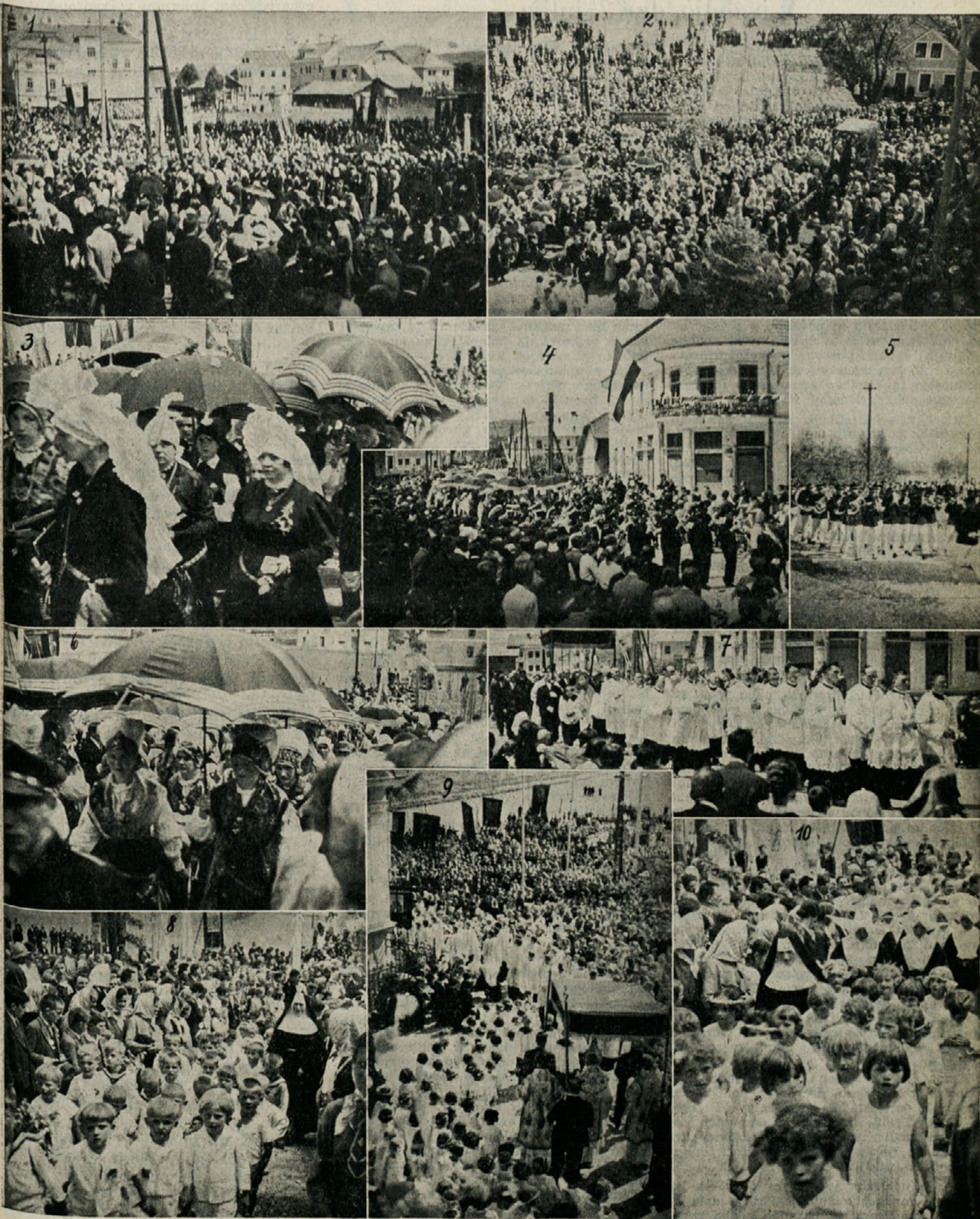
1. in 2. Celoten pogled na udeležence shoda. 3. Ženske in moške narod. noše v sprevodu. 4. Mengeška godba in nar. noše v sprevodu.