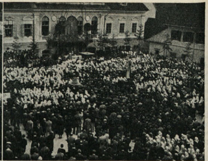
Zgoraj na desni: Med sv. mašo na Glavnem trgu. — Na levi in spodaj: Pri blagoslovu na koncu procesije pred župno cerkvijo.