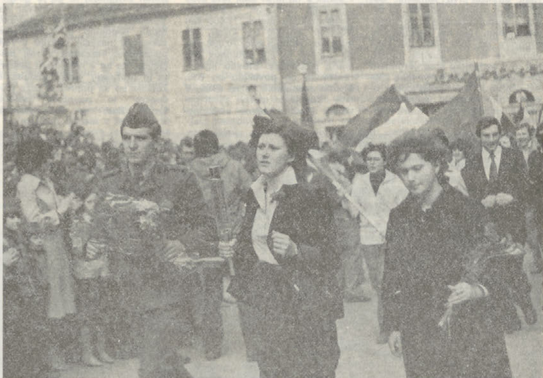
V nedeljo 25. marca se je ob sprejemu Titove štafeta zbrala v Ptuju tisočera množica iz mesta in okolice. Med to množico mladih, ki so simbolično prinesli pozdrave in lepe želje Titu za 87. rojstni dan, je bilo tudi precej delavcev naše DO. Štafeta nadaljuje pot proti Slovenski Bistrici