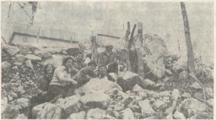
Le še vzpon na vrh stolpa pa bomo stali na višini 1000 m