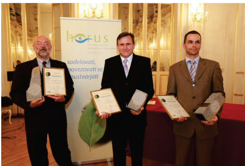
Nagrajena podjetja v letu 2009: Trimo Trebnje d. d., Atech elektronika d. o. o. in Informa Echo d. o. o.

Razpis za Slovensko nagrado za družbeno odgovornost HORUS 2010 sta objavila IRDO – Inštitut za razvoj družbene odgovornosti in PRSS – Slovensko društvo za odnose z javnostmi, v sodelovanju s številnimi podpornimi partnerji projekta. Nagrada je namenjena podjetjem, ki se zavedajo družbene odgovornosti in jo vključujejo v svoje poslovanje: v odnosu do okolja, do svojih zaposlenih in drugih deležnikov podjetja – poslovnih partnerjev in širše družbe – ter pri razvoju izdelkov in storitev. Še posebej pomembno pa je, da jo podjetja vključujejo v strateško vodenje ter v svoje poslovanje, ki naj tudi v času krize posluje družbeno odgovorno. Nagrada HORUS poteka pod častnim pokroviteljstvom predsednika RS dr. Danila Türka in v partnerskem sodelovanju s številnimi strokovno – interesnimi organizacijami, podeljena pa bo v drugi polovici novembra, ob 20. obletnici PRSS – Slovenskega društva za odnose z javnostmi. Finalisti nagrade v obeh kategorijah bodo znani 19. oktobra, nagrajenci pa 23. novembra v Kinu Šiška v Ljubljani.