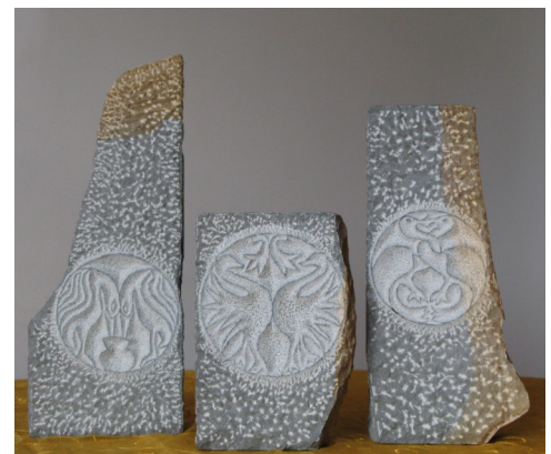
Nagrade Horus 2009

drugih deležnikov podjetja – poslovnih partnerjev in širše družbe – ter pri razvoju izdelkov in storitev. Še posebej pomembno pa je, da jo podjetja vključujejo v strateško vodenje ter v svoje poslovanje, ko naj tudi v času krize podjetja poslujejo družbeno odgovorno. Finalisti nagrade v obeh kategorijah bodo znani 19. oktobra. Kdo so prijavitelji preberite v novicah. Podelitev nagrade bo 23. novembra v Kinu Šiška v Ljubljani. Vabljeni!