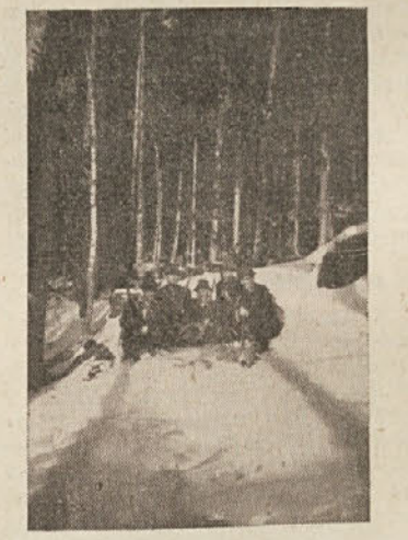
Lovci pred ustreljenim volkom

uspeh toliko večji. Tov. Sine je zelo dober lovec. Naj omenimo, da je do sedaj ustrelil med drugim tudi 40 divjih prašičev.