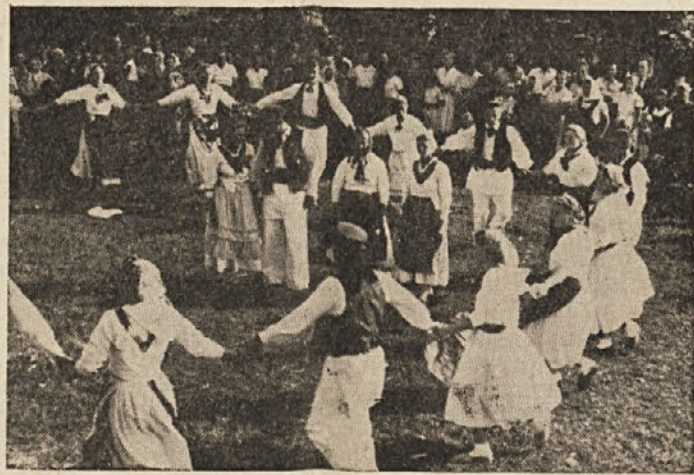
Poljska mladina pleše v narodnih nošah

V nedeljo, 17. februarja so se na zboru volivcev razgovarjali, da bi lahko v tem letu spravili šolo pod streho, v prihodnjem letu pa jo dokončno dogradili, če bodo dobili od okraja in občine primerno pomoč.