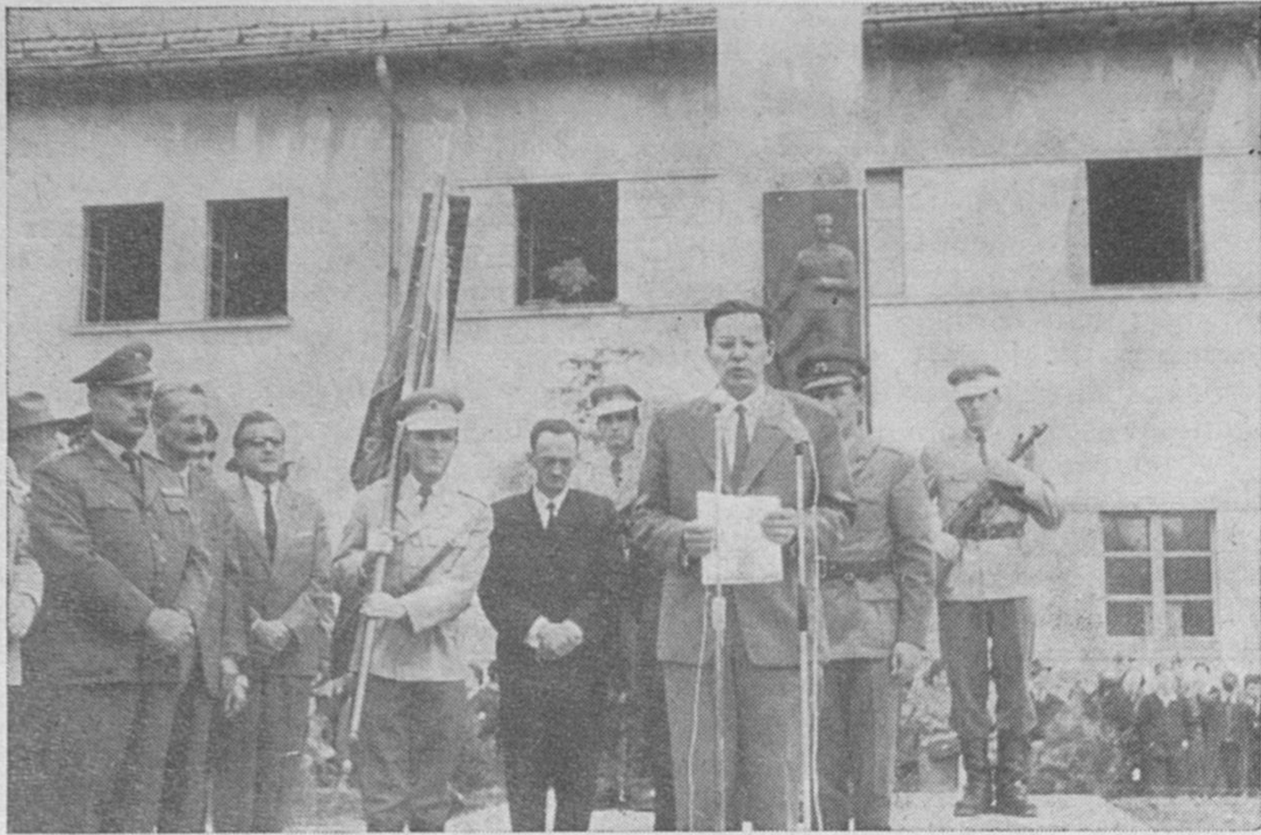
V imenu borcev, udeležencev srečanja, so z Blok poslali tudi pozdravno brzojavko tovarišu Titu. Na sliki: med branjem brzojavke, ki jo objavljamo na posebnem prostoru

Notranjski partizanski odred je bil trikrat organiziran in reorganiziran.