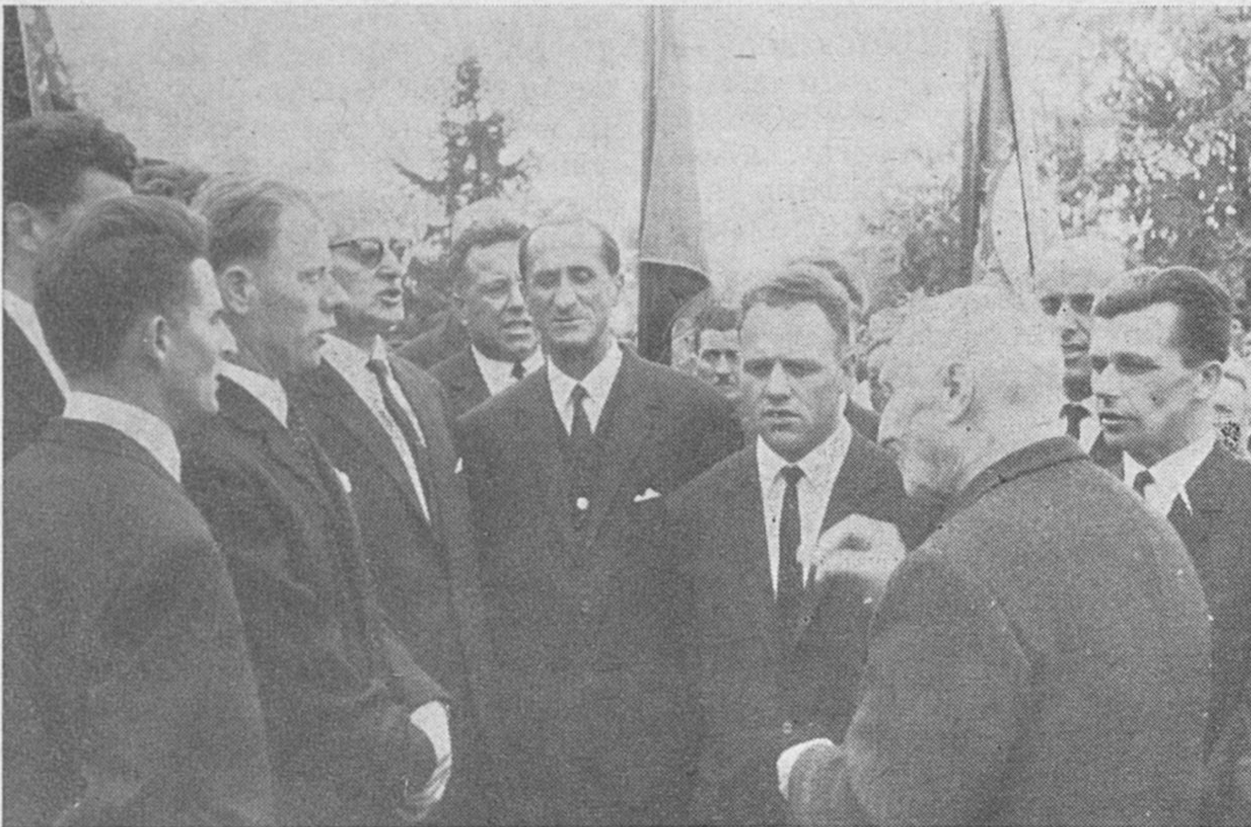
Ob otvoritvi spomenika je pel partizanske pesmi tudi moški pevski zbor »Svobode« Loška dolina pod vodstvom tovariša Mercine

V načrtu so predvideli tudi razgovor s predstavniki gospodarskih organizacij z namenom, da bi se tudi organizacije vključile v članstvo kot kolektivni člani. Prednost kolektivnega članstva bi bila predvsem v reševanju njihovih organizacijskih problemov pod ugodnejšimi pogoji od ostalih. Včlanjena podjetja bi plačevala letno članarino z ozirom na število zaposlenih. Bošt