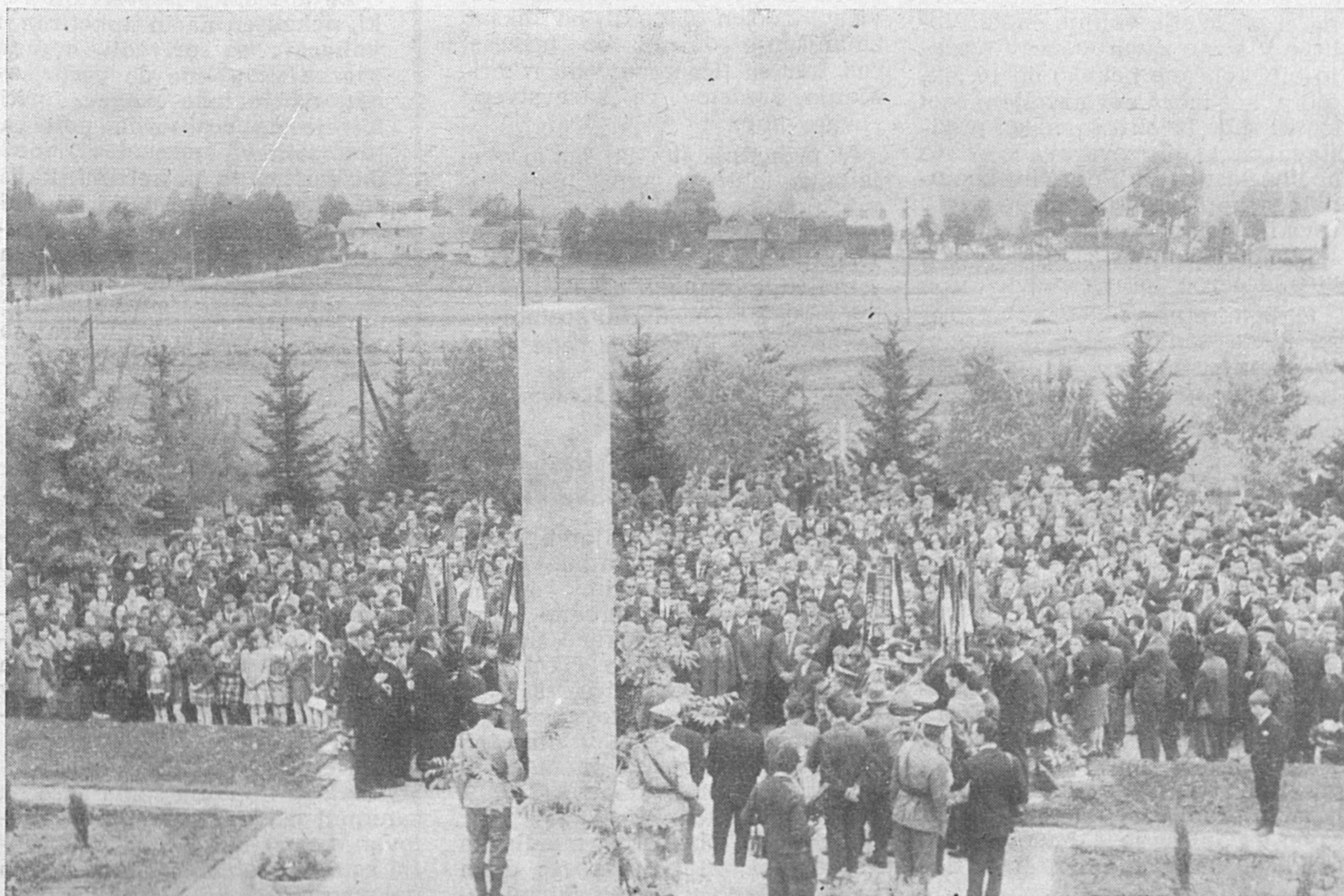
Velike Bloke, 18. septembra 1966. — Vse fotografije s proslave v Velikih Blokah