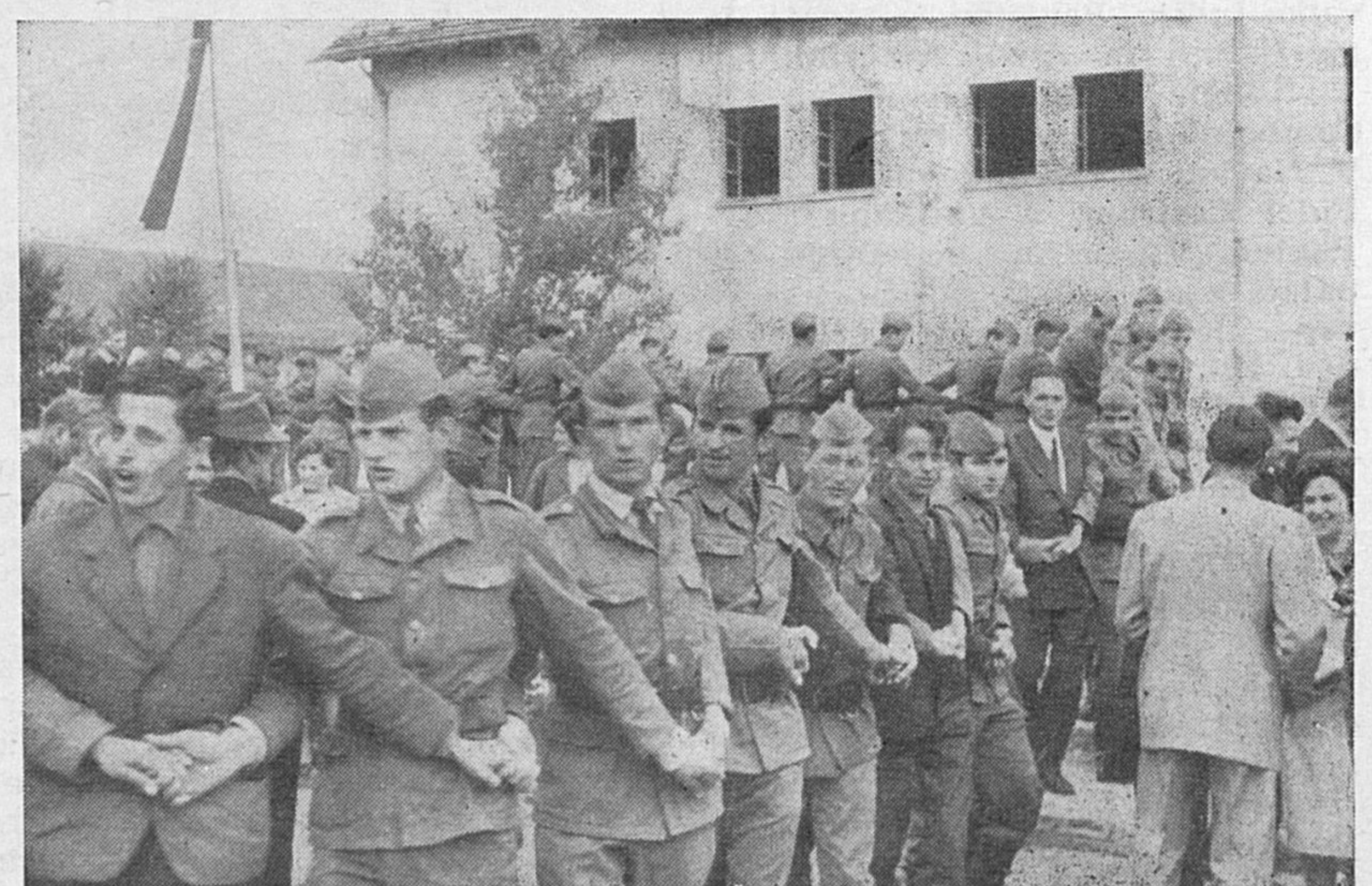
Na Velikih Blokah so zaplesali tudi popularno kolo...

lje je na Babni polici, Padežu in Pokojišču. Pri tem naj omenim, da so partizani namlatili na Babni polici sedemsto mernikov pšenice, ječmena in rži (tj. okrog šestnajst ton). Ko so se mudili borci Notranjskega odreda v borbenih akcijah v Gorskem kotoru, je neki falot Italijanom izdal skrivališče pšenice, ki so jo po-