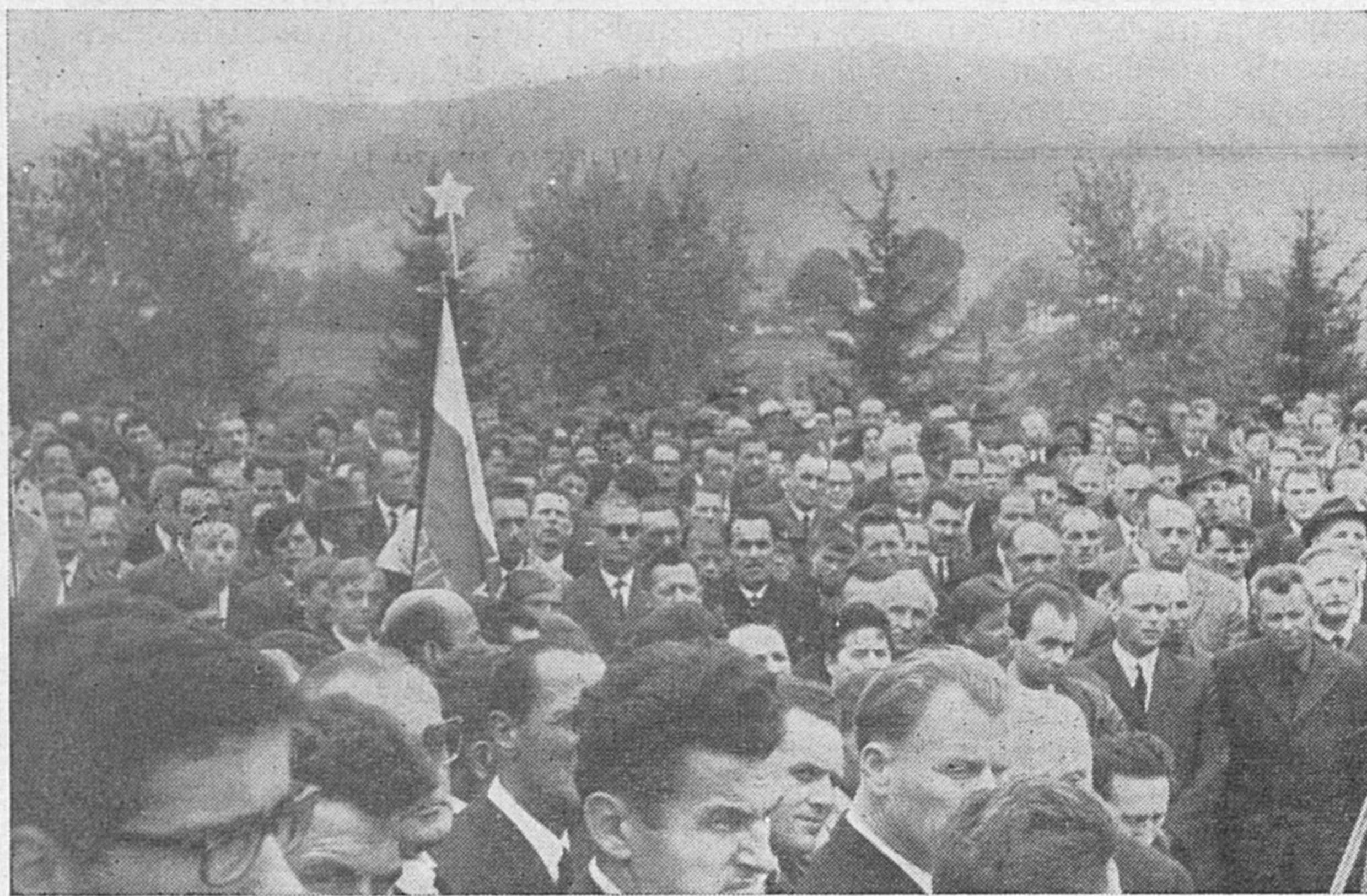
Pogled na del udeležencev proslave na Velikih Blokah

Značilno za Notranjski odred je tole: splošna italijanska ofenziva proti notranjskemu ozemlju se je pričela ob skrbni italijanski topniški in letalski pripravi dne 16. julija 1942. Takrat so motorizirani fašistični in italijanski oddelki prodirali proti Notranjski iz Ljubljane, Reke, Postojne in Trsta. Da so prišle v osrčje Notranjske, to je na Bloško planoto in v Loško dolino, so potrebovale te elite italijanske enote natančno trinajst dni. Vseh partizanov, vaške zaščite in aktivistov je bilo takrat na Notranjskem pet tisoč osemsto. Pri tem ne štejem tistih tri tisoč petsto notranjskih mater, žena in deklet, ki so kuhale, prale, šivale in oskrbovale partizansko vojsko. Italijanskih in fašističnih vojakov, ki so z najmodernejšo opremo operirali proti partizanom, je bilo nad sedemdeset tisoč. Naj omenim, da partizani niso imeli niti enega topa ali minometa. Imeli so puške — avstrijske, stare jugoslovanske,