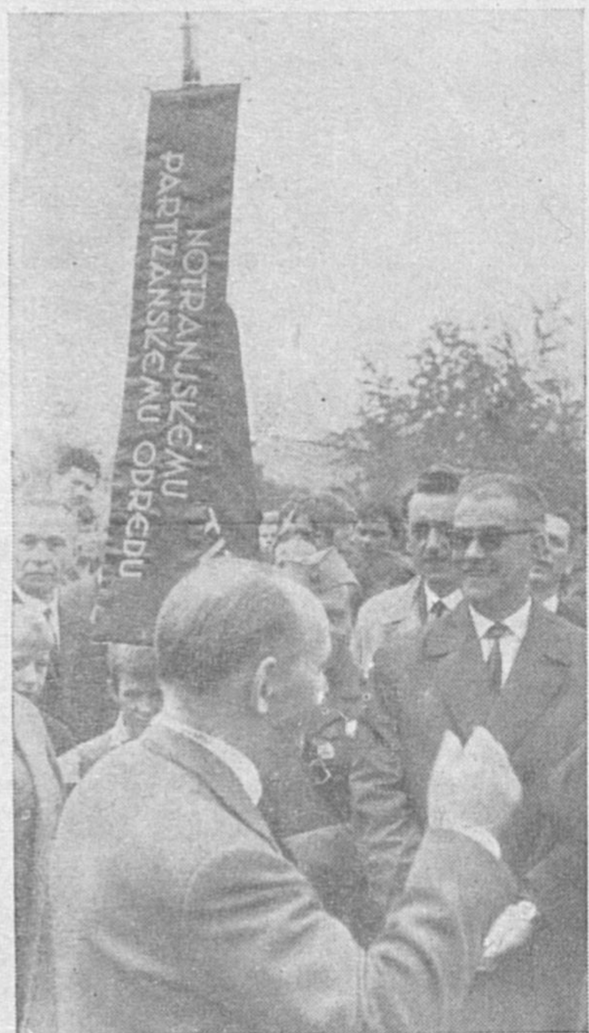
Del nekdanjih borcev Notranjskega partizanskega odreda

V spomladanskih dneh leta 1942 je odred žel velike uspehe pri osvobajanju Notranjske. Cete takratnega Krimskega odreda so se bojevale tudi v Gorskem kotaru, okrog Prezida in Gerovega, ne glede na to, kje je slovensko-hrvaška meja. Partizani obeh sedanjih republik so si vzajemno pomagali. Borci Notranjskega odreda so se tolkli celo v neposredni bližini Ljubljane.