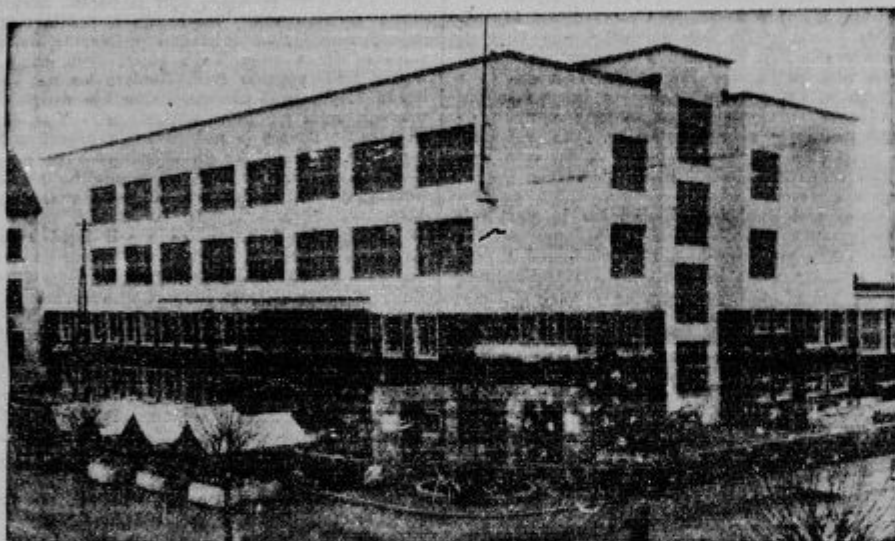
V nedeljo bo odprta nova meščanska šola na Viču. Stroški za zgradbo šole z vso opremo, z ureditvijo vrta ter igrišče znašajo 4.600.000 din