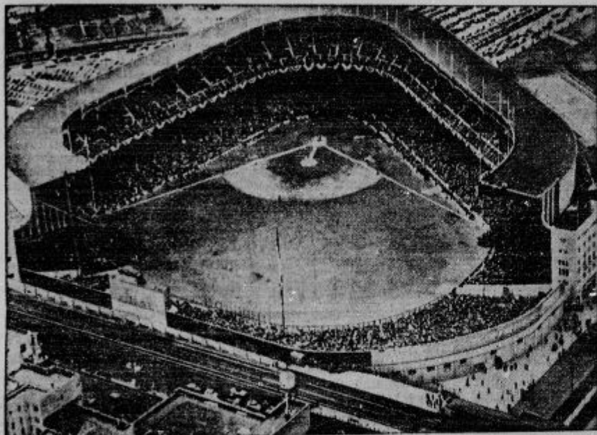
Njujorski stadion, kjer je 50.000 gledalcev opazovalo igro s povodno žogo. — Slika je posneta iz letala.