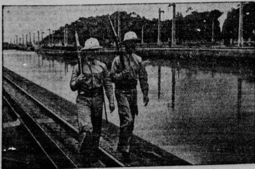
Amerika na strali Panamskega prekopa.

Trajen mir je mogoč le, če bodo državniki in državljani spoštovali krščanska moralna načela.