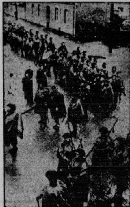
Prihod angleških čet na francosko bojišče. Čete korakajo skozi francosko vas.