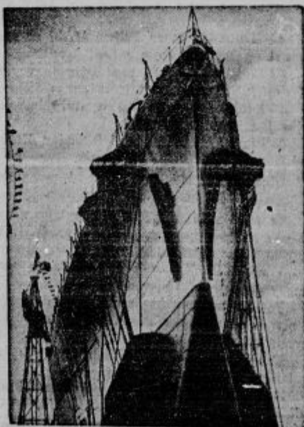
Najnovejša italijanska bojna ladja, 85.000 tonska križarka »Impero«.