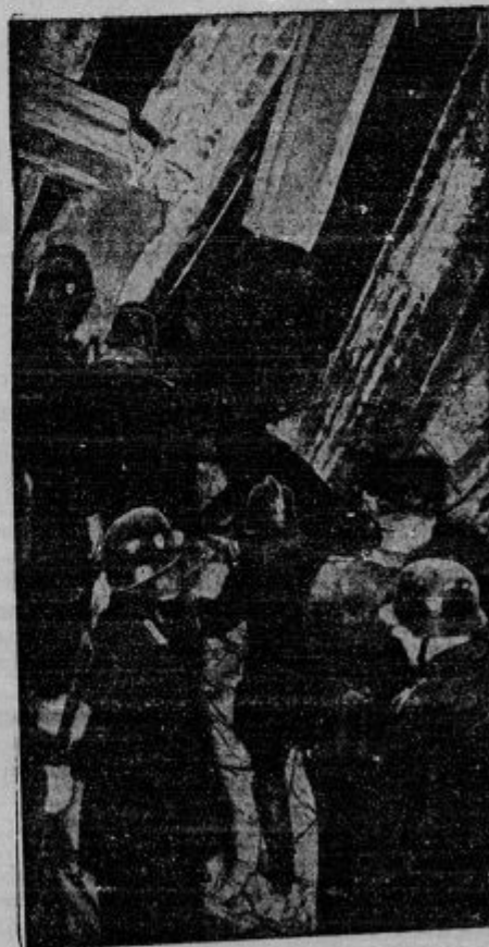
Razbita dvorana v monakovski pivovarni, kjer je bil izvršen atentat