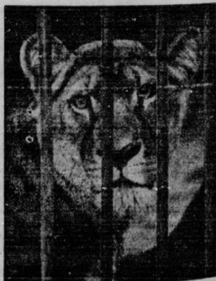
Levinja v berlinskem levinjaku radovedno opazuje mimoidoče.