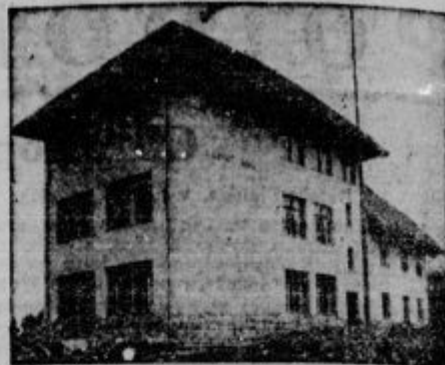
Nova šola v Svečinal nad Skofjo Loko je bila dne 29. oktobra blagoslovljena. Veljala je brez prostovoljne tlake in materiala, ki je bil darovan, nad 400.000 din. Šola je ponos škojloškemu okraju.