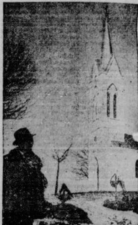
Pred nekaj leti prenovljena kapela na največjem bregu na pokopališču v Vučjigomili