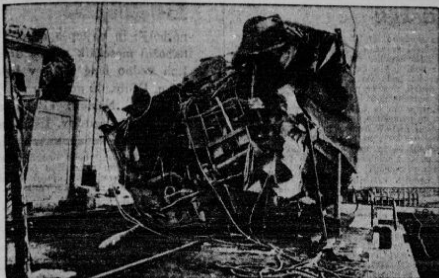
Ladje, ki so jih potopili Poljaki, dvigajo in jih popravljajo v Gdinji (Gdansk).