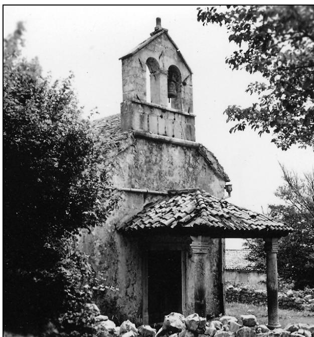
Sl. 9: Stanje cerkve leta 1968.

Fig. 9: The church's state in 1968.