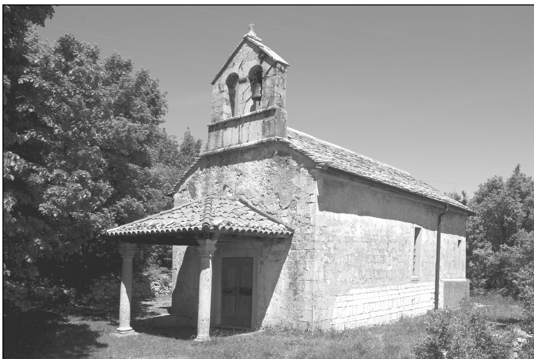
Sl. 1: Pogled na cerkev sv. Helene z jugozahoda. Fig. 1: A south-western view of St Helen's Church.

Cerkev stoji na položnem prisojnem pobočju hriba Škale tik nad vasjo. Obdaja jo razpadajoča snizka zidana kamnita ograda. Nekdaj so jo na zahodni strani zapirala železna vrata ali porton . Cerkvena ladja oblikuje s prezbitერიem, ki je triosminsko oz. tristransko zaključen, enovito kamnito stavbno lupino s strmo skrilnato streho. Oba prostora imata v južni in severni steni po eno pravokotno okno s poševno posnetimi ostenji. Zahodno pročelje s strmim zatrepom se vzpenja v zvončnico z dvema ločnima linama, zidano iz klesancev in pokrito z dvokapno strešico iz klesanih plošč. Cerkveni vhod v pročelju varuje trikapna korčasta streha lope ali klonice , ki jo podpirata dva stebra. S takšnim pročeljem, zvončnico in lopo se uvršča cerkev sv. Helene v ožjo družino cerkva, ki jo sestavljajo še cerkev Sv. Trojice v Dolnjih Ležečah ter cerkvi sv. Tomaža v Famljah in sv. Križa v Škofljah. 2 Izmed njih je edina ohranila skrilnato streho na ladji in prezbitერიju, medtem ko so bile druge prekrite s korci – razen lope cerkve v Dolnjih Ležečah, ki je tudi še krita s skrilami.