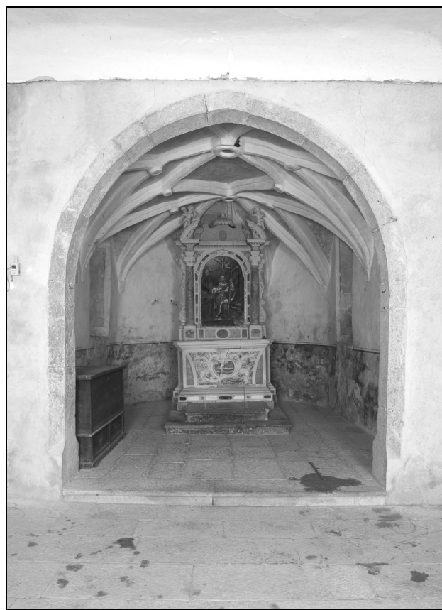
Sl. 5: Pogled v prezbiterij s slavolokom iz klesanega kamna.

nenavadnima ploščatima stiliziranimi rozetama, ki se v podrobnostih nekoliko razlikujeta med sabo, po simsu pa teče niz listnih okraskov, ki si sledijo v velikih presledkih. 10 Sočasno je cerkev dobila tudi dva para novih visokih pravokotnih oken s poševno posnetimi ostenji in železnimi križi. Dve izmed njih sta nadomestili prejšnji okni v stranskih stenah prezbiterija, tretje je razširilo in zvišalo prvotno tretje okno v južni steni ladje, četrto pa je na novo predrlo severno steno ladje. Nasadila na njihovih licih pričajo, da so nekdaj imela tudi oknice. Vsa okna so obdelana s krempačem in imajo rezane robove. Okni na severni strani sta nekoliko nižji in brez posebnosti, večji južni okni pa imata izrazitejše, nekoliko bolj izbočene zunanje in notranje robove lic, ki se s pokončnikov nadaljujejo do zunanjih robov preklade in spodnjega oknjaka.