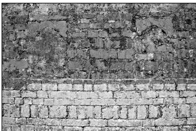
Sl. 3: Južna stena ladje z zazidanima prvotnima oknoma.

Fig. 3: The southern wall of the nave with two windows now walled-up.