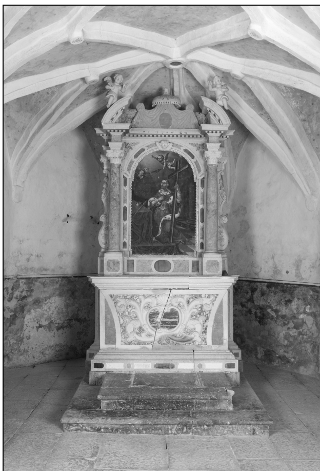
Sl. 8: Oltar iz leta 1744. Fig. 8: Altar dating to 1744.

ki jih je dajala v najem, od prodaje starih ovac in jag-njet, od pridelkov: volne, lanu, sira, meda, sena, pšeni-ce, rži, soržice ( mixtura ) in vina ter od miloščine v denarju ali blagu. Ob koncu leta 1710, na primer, je po obračunu prihodkov in izdatkov ostalo v blagajni 337 lir, 1716. leta 404 lire, 1753. leta 509 lir, 1756. leta 1211 lir in 1763. leta 994 lir (ŽAV, 2).