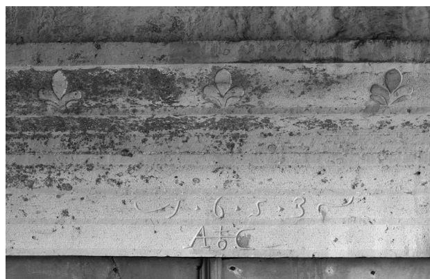
Sl. 7: Portal – detajl preklade z letnico in inicialkama A C.