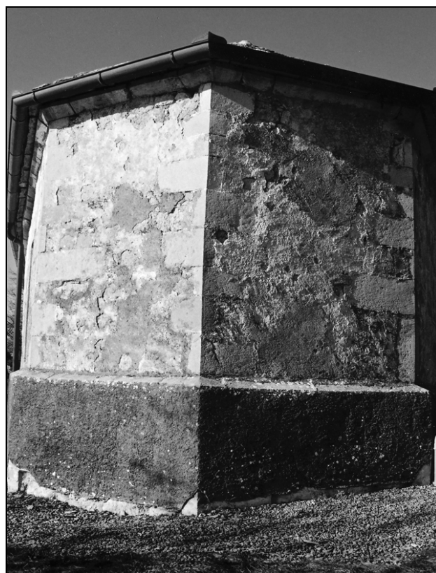
Sl. 4: Zunanjščina prezbiterija z značilnim gotskim pristrešenim talnim zidcem in šivanimi vogali.

iz grobe cementne malte. Iz ravnine stranskih fasad izstopa s pravokotnima zoboma, globokima 16 centimetrov. Ta zoba, ki nista zakrita z ometom, sta sezidana iz enakih klesancev kot stene ladje. Pri podrobnejšem ogledu spodnjih delov sten na stiku starejše ladje in mlajšega prezbiterija, kjer sta bila prvotna vogala ladje, opazimo manj pravilno zidavo in spremembo višin skladov iz polklesancev. Očitno je, da so pri dozidavi cerkve podrli tudi vzhodna vogala ladje, nastale vrzeli pozidali z manj kvalitetno obdelanim kamnom, klesane vogelnike pa smotrno uporabili za dozidavo tistih novih delov, ki morajo biti iz klesanega kamna – med drugim tudi za oba zoba talnega zidca prezbiterija.