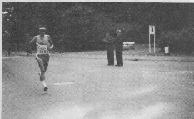
Na tako dolgi progi (42 km), je dovolj časa tudi za pozdrav.