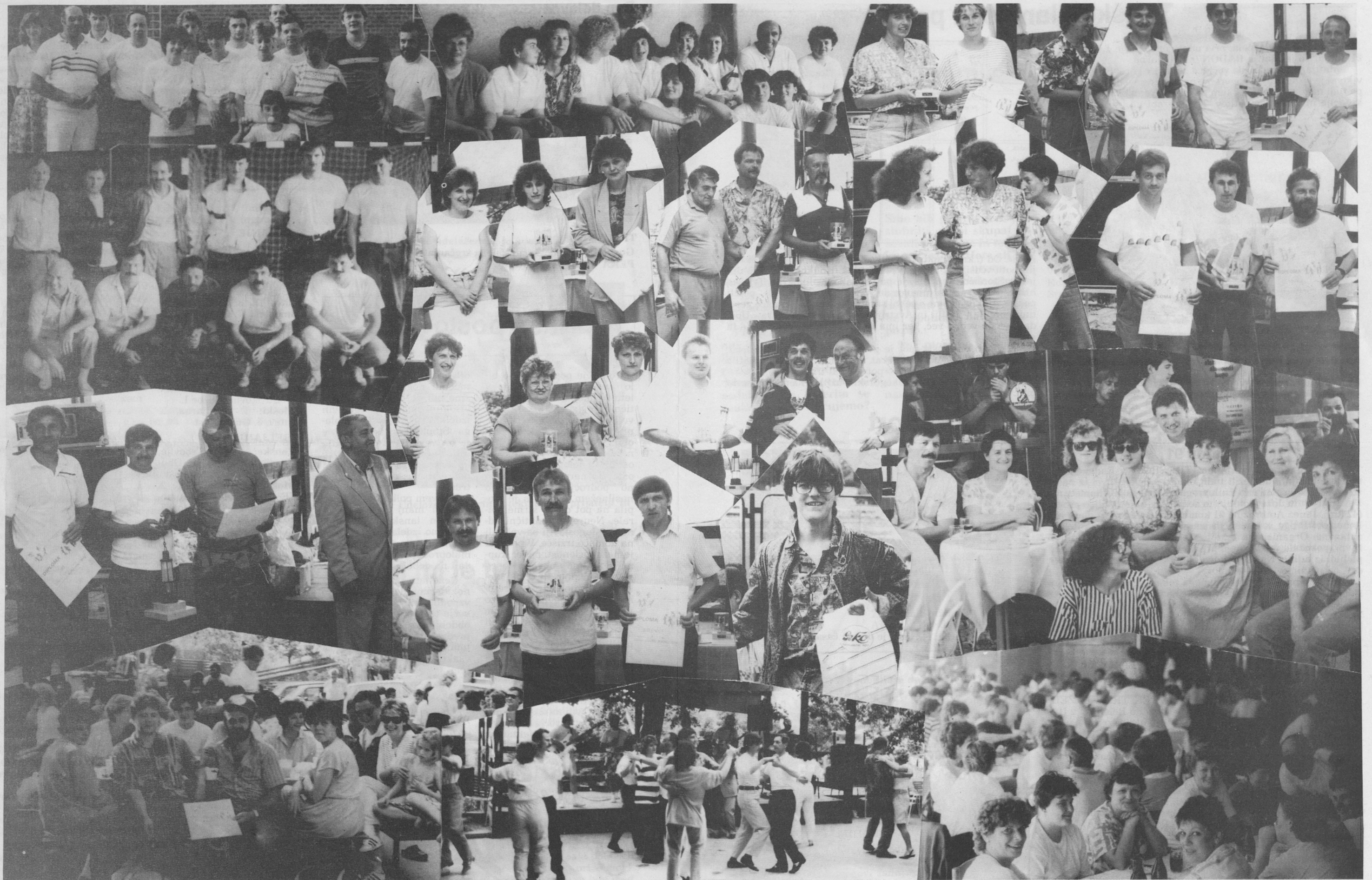
... ... ... ... ...