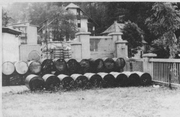
Sodi z odpadnimi snovmi so na tovarniškem dvorišču.

Drugi del odpadkov so ostanki destilacije, za katere ni postopka predelave, ampak sežig. Nekaj lastnikov peči za sežig takih odpadkov v Jugoslaviji je, take snovi so uničevali, teh možnosti pa sedaj ni več. Zato se spet kopičijo. Za potrebe slovenskega gospodarstva naj bi tako peč uvozila slovenska vlada, do tedaj je problem odprt.