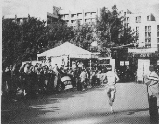
Še zadnji metri do cilja, gledalci vzpodbujejo.