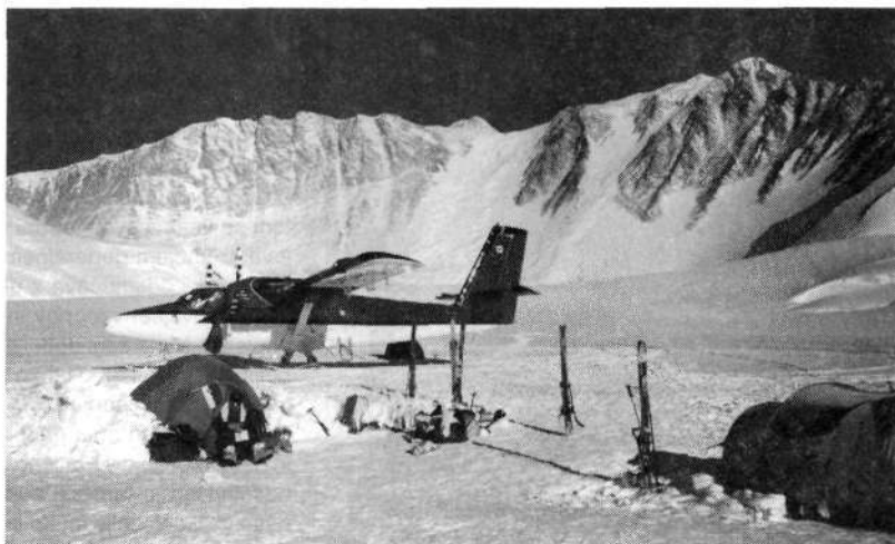
Bazni tabor pod najvišjo goro, v ozadju Mount Vinson.

gore. Z vso pozornostjo si pripnem smuči in se z njimi na nogah povzpnem do najvišje točke.