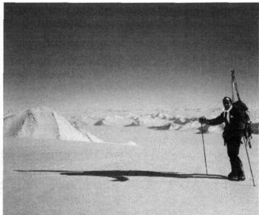
S smučni na ramah na enem od dotle še neosvojenih vrhov.