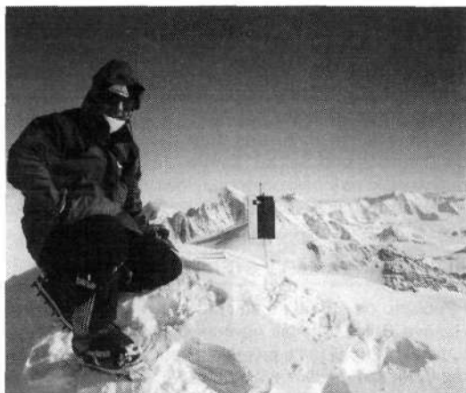
Dne 5. januarja 1997 sem stal na najvišjem vrhu Antarktike.

Na Antarktiki ni stalno naseljenih ljudi. Edini človeški prebivalci so delavci na antarktičnih postajah, ki se menjajo vsake pol leta. Zato pa je Antarktika imeniten dom za brezštevne primerke pingvinov, tjulnjev, morskih levov, kitov. Število ptic od galebov do albatrosov presega človeško domišljijo. Obalne vode Antarktike kar kipijo od življenja. Zaradi navpičnega dviganja globinske vode, ki na površino prinaša hranilne snovi, potrebne za razvoj planktona, so antarktična morja štiri- do sedemkrat bolj hranilna kot tropska.