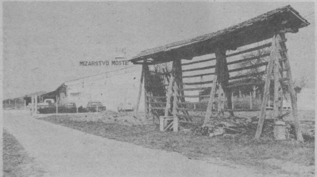
Nove proizvodne hale omogočajo Mizarstvu Moste uvajanje v proizvodnjo sodobne tehnologijo