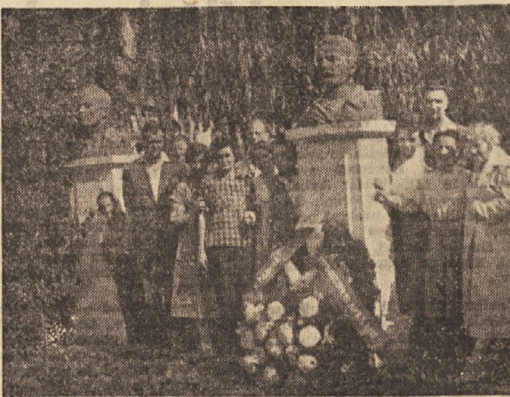
Skupina slovenskih prosvetnih delavcev pri spomeniku narodnih herojev Kosmeta v Peči

24. VI. zjutraj odpotovalo iz Ljubljane proti Beogradu, odkoder smo po kratki prekinitvi vožnje nadaljevali potovanje proti Peči. V Peči so nas toplo sprejeli tamkajšnji prosvetni delav-