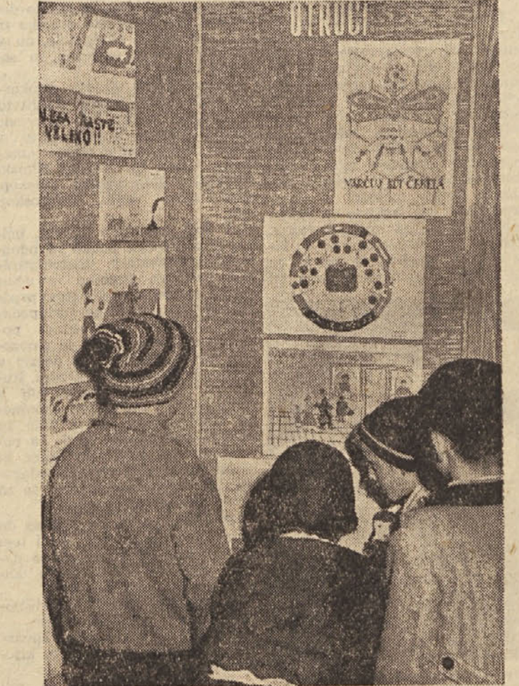
Okrog 700 risb z najrazličnejšimi motivi varčevanja so poslali šolarji ljubljanskega okraja za razstavo; izbranih je bilo 165 risb, ki jih lahko vidite v dvoranci Gospodarskega razstavišča v Ljubljani. Od teh je bilo 81 risb nagrajenih z denarnimi nagradami. Mestna hranilnica, ki je pripravila razstavo in nagradila najboljše risarje, je zabeležila v zadnjih letih velik porast šolskih hranilnih vlog: od 3885 vlog v letu 1952, na 30.821 vlog v 1959 l. ali od 6.320.000 namoženih dinarjev (1952) na 221.747.000 (1959).

Te želje in zahteve pa niso nove. To so znane stvari, ki jih od časa do časa znova obudimo na tej ali oni konferenci poklicnih ali nepoklicnih ljudi. Stvari se kljub temu niso dosti spremenile. Upravičeno se sprašujemo, kje so vzroki, da vzgojno delo