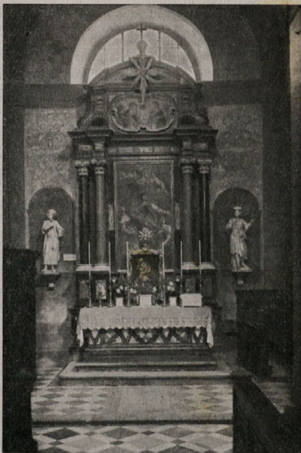
Kapela Marije Pomagaj