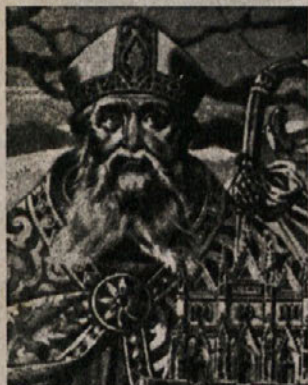
Bl. Janez Montekorvinski

Kubilaj, veliki mongolski kan in obenem kitajski cesar, je l. 1266 prosil papeža po beneških trgovcih Nikolaju in Mateju Polo, ki sta ga bila seznanila s katoliško Cerkvijo in ga zanjo navdušila, naj mu pošlje sto učenih mož, da bodo njegovo ljudstvo podučili o katoliški veri. Prošnjo mu je zaradi ovir izpolnil šele papež Nikolaj IV., ki je poslal l. 1289. na Kitajsko kot svojega poslanika dvainštiridesetletnega Janeza Montekorvinskega,