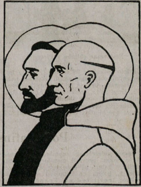
Sv. Bruno in sv. Frančišek (Slikal p. Ayrald O. Cart.)

S kleriki se je preselil iz Novega mesta tudi redovni frančiškanski noviciat z magistrom p. Salezijem in s štirimi novinci.