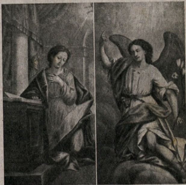
Marijino Oznanjenje s kronogramom

Ob oznanjenju nadangela Gabrijela je prebl. Devica Marija glasno izrekla svoj vdani Fiat — Zgodi se. Kolikokrat pa je ob raznih, njej neumljivih dogodkih, onemela ter skrivnost ohranila v svojem Srcu. Tako je storila tedaj,