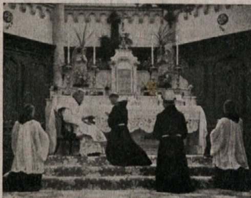
Neslovesne obljube v Pleterjih

V kartuzijanski cerkvi v Pleterjih se je dne 12. oktobra preteklega leta vršil obred po frančiškanskem ceremonialu. Ta dan sta namreč dva novince, klerika-begunca, kon-