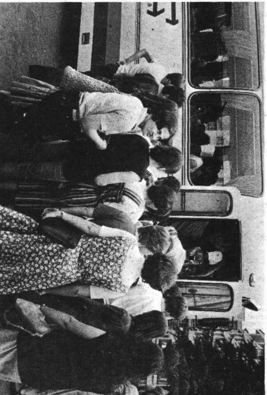
So vrata delovnih organizacij tudi tako ozka kot avtobusna?