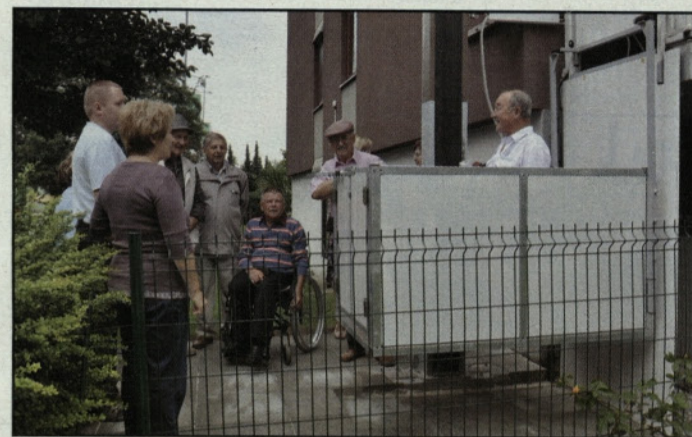
Poslej se bo dalo hitreje priti v stanovanje in iz njega

Odločitev za ureditev takšnega dvigala je dozorela letošnjega maja. Po operaciji se je njegovo zdravstveno stanje močno poslabšalo. S pomočjo sponzorjev, Medobčinskega društva invalidov Žalec, Občine Žalec ter Zveze paraplegikov Slovenije in Društva paraplegikov JZ Štajerske, se je ta