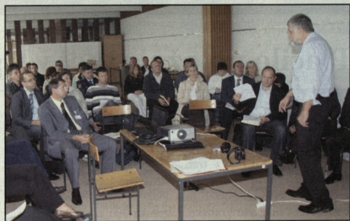
Z delavnice Skrbimo za porečje Savinje

Načrt upravljanja voda bo vključeval tudi načrte po povodjih ter v njih povezoval okoljske cilje, socialna vprašanja in gospodarske dejavnike z vsemi vrstami vodnih teles - rekami, jezeri, rečnimi ustji in drugimi somornicami, obalnimi morji in podzemnimi vodami. T. Tavčar