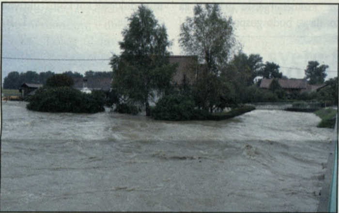
Hiša po domače Mlinarjevih v Kaplji vasi je vedno najbolj na udaru