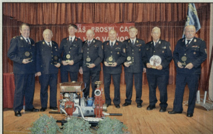
S slovesnosti ob 90-letnici PGD Prebold-Dolenja vas-Marija Reka

V Gasilski zvezi Prebold so letos slovesno obeležili kar tri visoke jubileje. V Kaplji vasi so praznovali 100-letnico društva, v Šeščah 90-letnico, prav toliko let pa so dejavni gasilci PGD Prebold-Dolenja vas-Marija Reka, ki so v Dvorani Prebold pripravili osrednjo slovesnost s podelitvijo priznanj najzaslužnejšim članom.