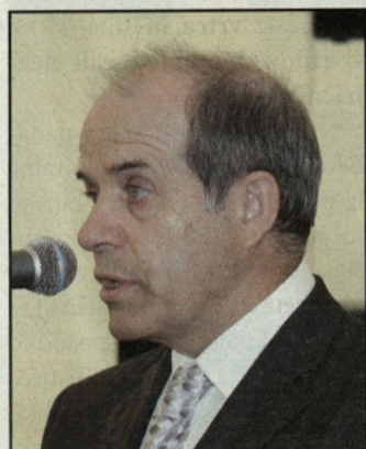
Minister dr. Ivan Svetlik

V času občinskega praznika je eno najživahnih prizorišč park Dvorca Novo Celje. Vsako leto se zadnji avgustovski petek tam zberejo tudi rejniške družine iz vse Slovenije in se nato odpravijo na izlete in ogled po občini. Osnovni namen srečanja je preživeti sproščen in lep dan med družinami s podobnimi izkušnjami.