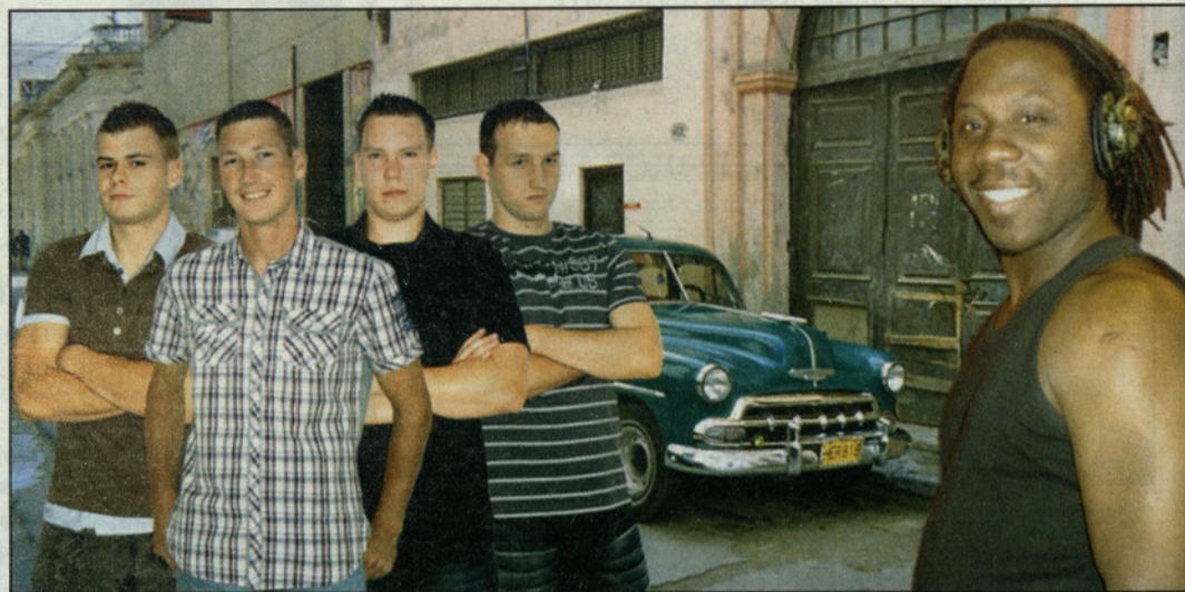
Skupina RešParD s kubanskim reparjem

Člani skupine RešParD svojim oboževalcem sporočajo, da bodo kmalu posneli tudi videospot. T. T.