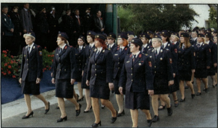
V paradi so sodelovale tudi gasilke

V žalski občini so dan gasilcev Gasilske zveze Žalec združili s