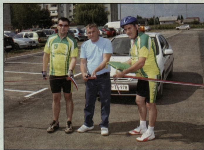
Prerez traku v Soseski V

Žalčani so od septembra bogatejši za dve pomembni parkirišči s skupaj 137 parkirnimi mesti. Prvo so odprli drugo septembrsko nedeljo v Soseski V., drugo pa prejšnjo soboto pri pokopališču v Žalcu.