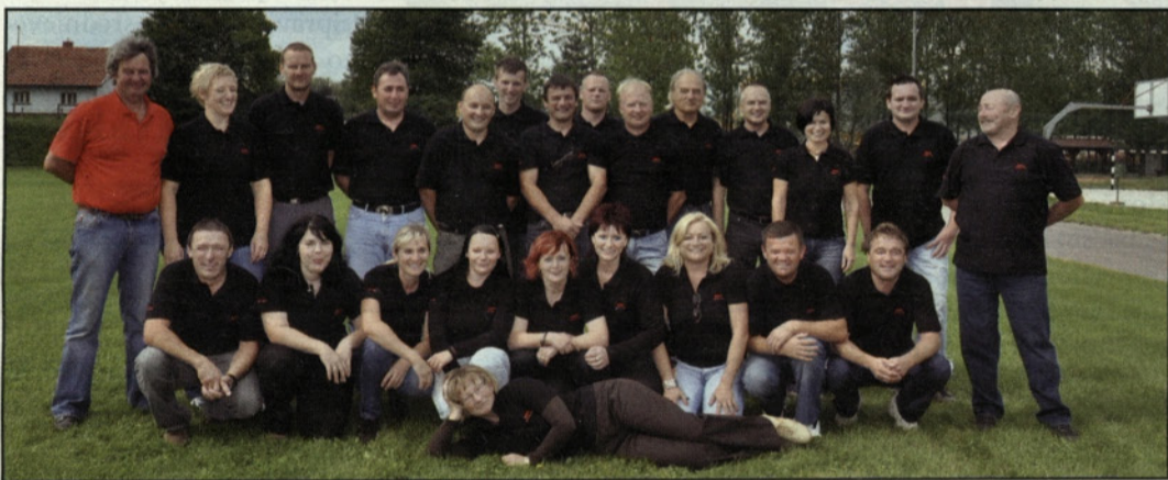
Kolektiv prodajnega centra Sam Latkova vas skupaj z direktorjem (prvi z desne) v popoldanskem dnevu praznovanja

V Občini Prebold je že 15 let prisotno trgovsko podjetje Sam iz Domžal, ki ima svoj prodajni center na območju industrijske cone v Latkovi vasi. Ob 15-letnici prodajnega centra v Latkovi vasi so pripravili prijetno praznovanje, na katerega so povabili vse občane preboldske občine in ostale Savinjčane, zveste kupce, svoje poslovne partnerje in vse, ki so kakorkoli povezani z njihovim podjetjem.