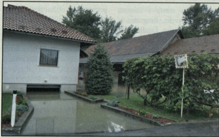
Poplavljen hiša Potočnikovih v Kaplji vasi