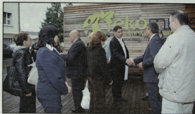
Dobrodošlica v ekomuzeju

Zadnje srečanje je nadgradilo dve dosednji srečanja v Sloveniji in tri srečanja v Srbiji, v okviru katerih so sodelovali predstavniki občin, nosilci razvojnih institucij, javnih institucij, podjetij, osnovnih šol, mentorji ekošol, Unesco šol, predstavniki knji-