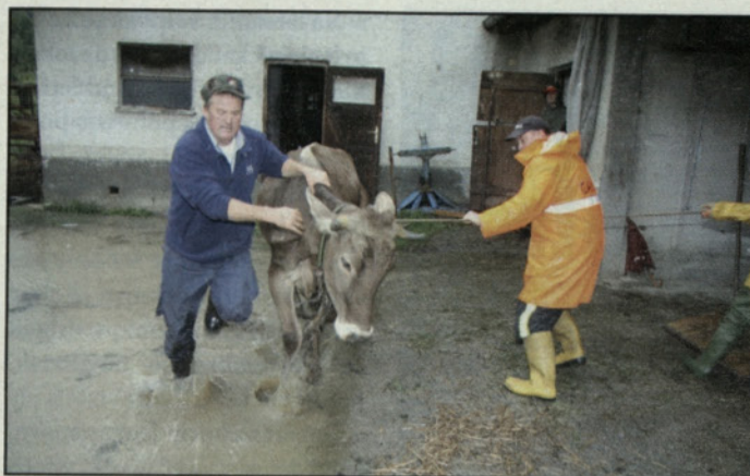
Voda je zalila številne hleve, tudi v Ločici pri Vranskem so reševali govedo