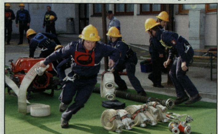
Aktivno na gasilskem tekmovanju