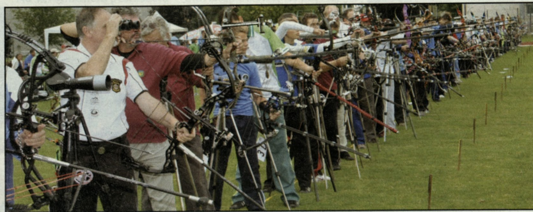
Utrinek s tekmovanja

Na nogometnem igrišču v Športnem parku Žalec so pripravili državno prvenstvo, absolutno državno prvenstvo in tekmovanje za slovenski pokal FITA 900 krogov v lokostrelstvu. Na tekmovanju je nastopilo rekordnih 165 tekmovalcev iz 23 klubov iz vse Slovenije.