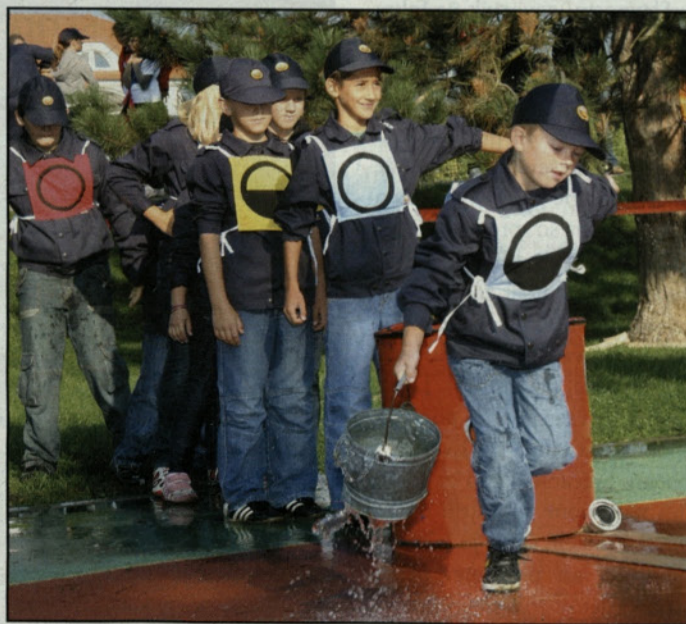
Utrinek s tekmovanja

Na nogometnem stadionu Športnega centra Žalec je potekalo mladinsko tekmovanje Gasilske zveze Žalec, ki je bilo tudi zadnje, četrto tekmovanje v mladinski ligi savinjsko-šaleške regije. Pionirke in pionirji so tekmovali v vaji z vedrovko in štafeti s prenosom vode, mladinke in mladinci pa v vaji z ovirami in štafeti z ovirami na 400 metrov.