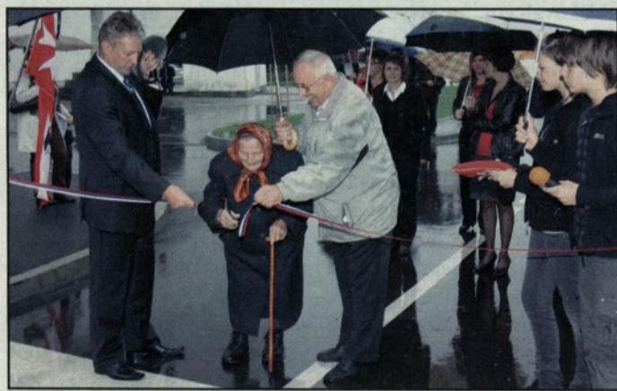
S slovesnosti v dežju

V Občini Polzela so ob praznovanju letošnjega občinskega praznika slavnostno predali namenu prenovljen center naselja Polzela.