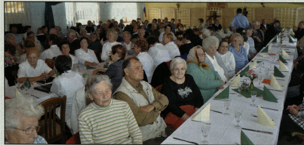
Množično obiskano srečanje za starejše od 70 let