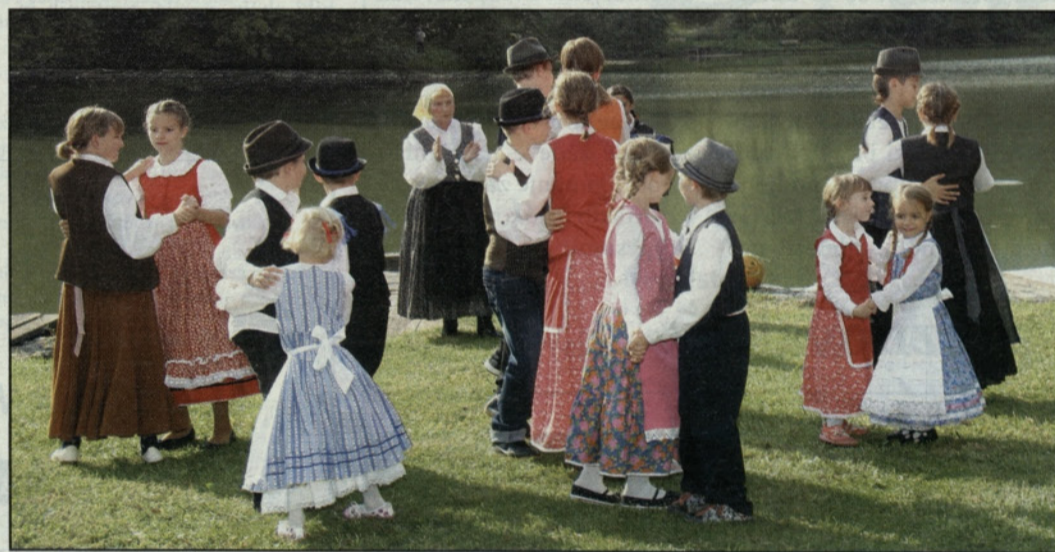
Nastop Folklorne skupine Ponikva pri Žalcu

Turistično društvo Braslovče je ob Braslovškem jezeru pripravilo prireditve ob odprtju preurejene sprehajalne poti in predstavitve Braslovškega jezera in drugih turističnih zanimivosti Občine Bra-