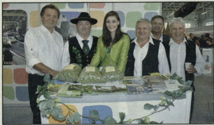
Hmeljski starešina in princesa z glasbeniki iz Vrbeja na sejamski predstavitvi naše doline

Na letošnjem 43. Mednarodnem obrtnem sejmu v Celju se je savinjska regija na področju turizma prvič predstavila s skupno, enovito podobo. Na razstavnem prostoru savinjske regije, v hali K, so vsak dan poskrbeli tudi za spremljalni program, ki so ga pripravile občine savinjske regije.