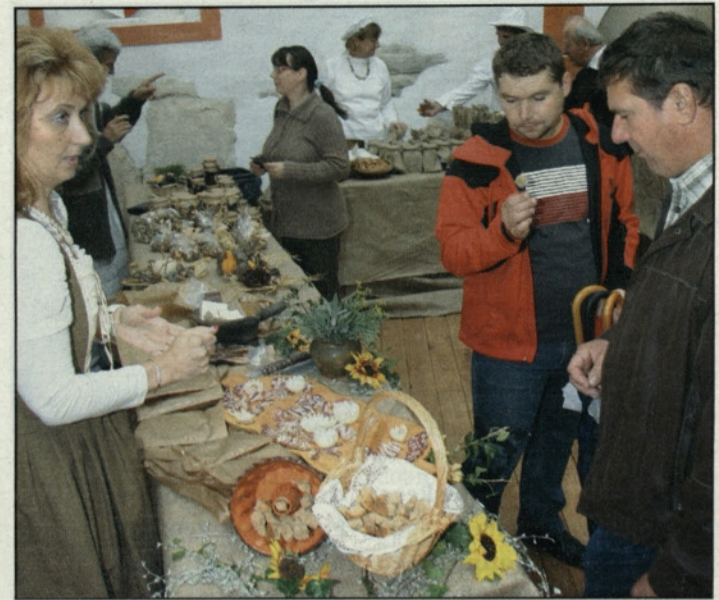
Del srednjeveške tržnice

V okviru praznika Občine Polzela so prejšnjo soboto odprli vrata Gradu Komenda. V popolni podobi in z dejavnostmi, ki ga bodo bogatile, bo grad zaživel prihodnje leto, ko bo končana druga faza izgradnje; zdaj je zaključena prva. Dokončani so prostori v kleti za turistično promocijsko in gostinsko dejavnost ter del pritličja.