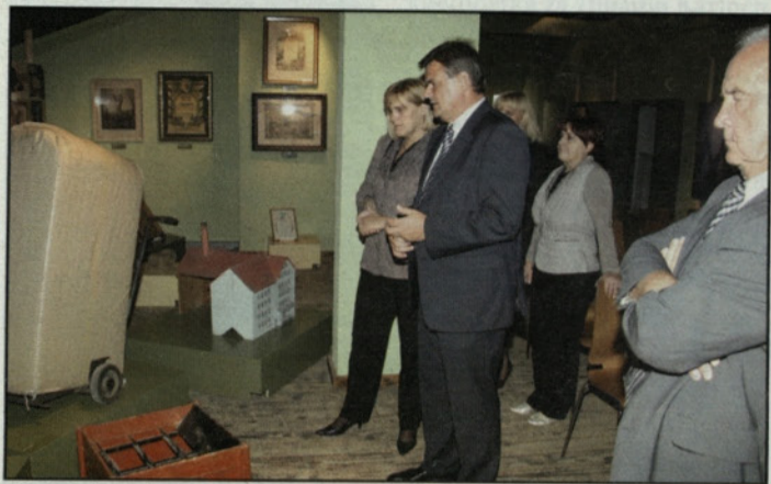
Med ogledom Ekomuzeja hmeljarstva in pivovarstva Slovenije

Partnerji podjetniškega družjenja in usposabljanja podpornega okolja v Spodnji Savinjski dolini, ki že deseto leto zapored organizirajo dneve podjetništva s ponudbo različnih oblik