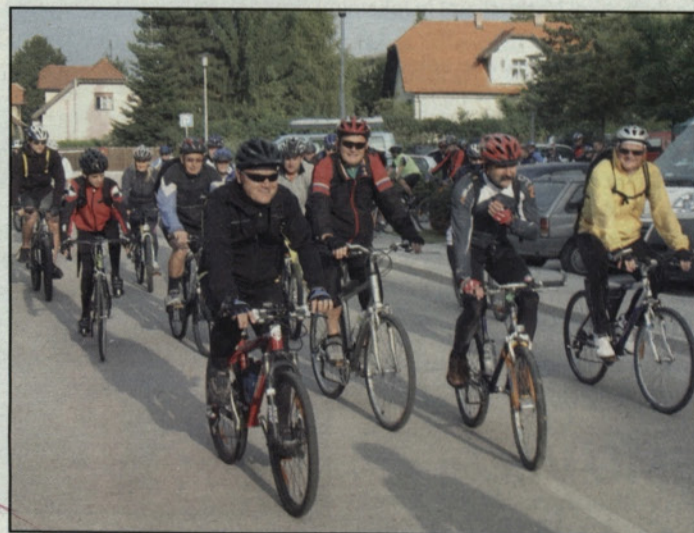
Takoj po startu v Žalcu

ZKŠT Žalec, OE šport, in Kolesarki klub Žalec sta v okviru prireditve praznika Občine Žalec pripravila kolesarjenje po vseh krajevnih skupnostih žalske občine.