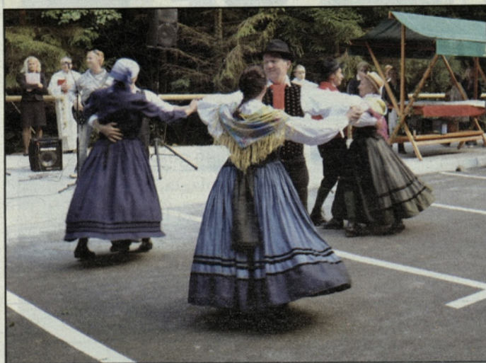
Ob zvokih ansambla Spekter so na novem parkirišču in cestišču veselo zaplesali pari FS Grifon

V začetku septembra so predali namenu 2400 metrov dolg odsek ceste iz Podloga proti Jami Pekel in Ponikvi ter parkirišče za obiskovalce Jame Pekel. Zbrane je ob oprtju pozdravil predsednik sveta KS Šempeter