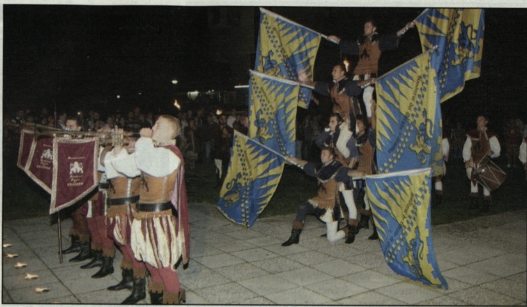
Med nastopom folklorne skupine iz Šempetra

Folklorna skupina KUD Grifon iz Šempetra in celjska folklorna skupina sta letos že petič pripravili mednarodni folklorni festival Od Celja do Žalca. Prireditve so se tokrat udeležile folklorne skupine iz Srbije, Italije, Grčije, s Portugalske in dve domači skupini, gostiteljici festivala. V teh festivalnih dneh se je zvrstilo veliko nastopov.