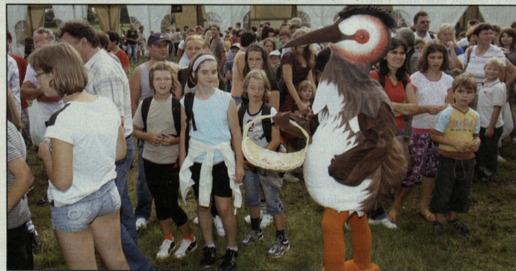
Otroke je na Ribnik Vrbje pospremil tudi »ponirek«