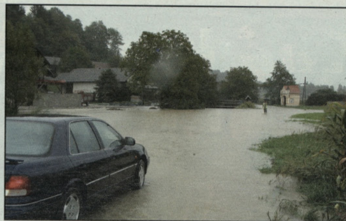
Po travnikih in cestah se je razlila tudi Ložnica v Založah