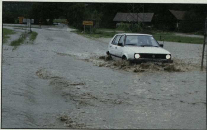
Merinščica je tekla tudi po cestah