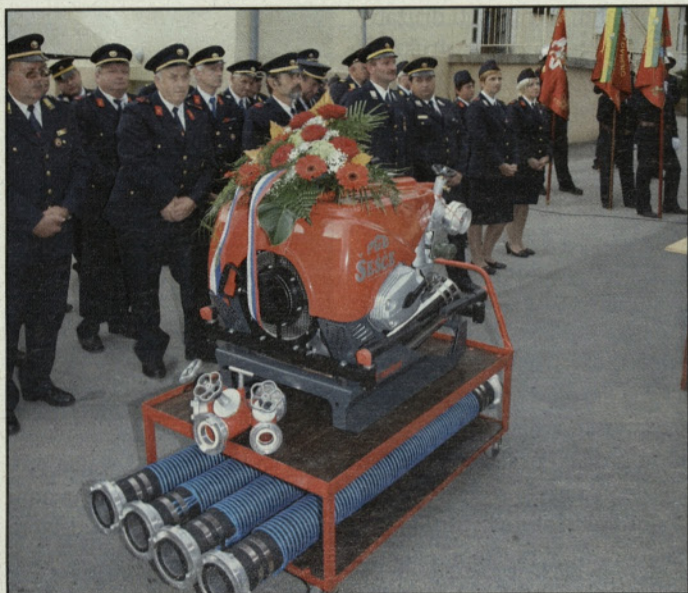
Gasilci PGD Šešče se veselijo nove brizgalne

Prostovoljno gasilsko društvo Šešče praznuje letos 90-letnico svojega delovanja. S praznovanjem so začeli že na 90. občnem zboru spomladi. Osrednjo jubilejno prireditev pa so pripravili konec prejšnjega meseca. Ob tej priložnosti so namenu predali tudi novo motorno brizgalno in podelili jubilejna priznanja.