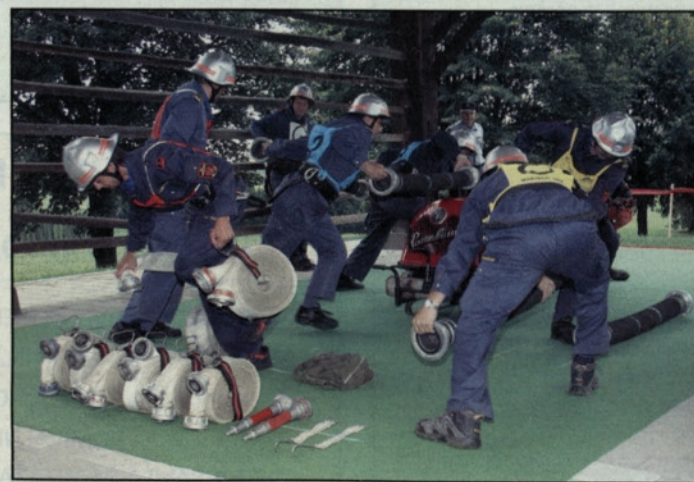
Med nastopom članske ekipe PGD Braslovče