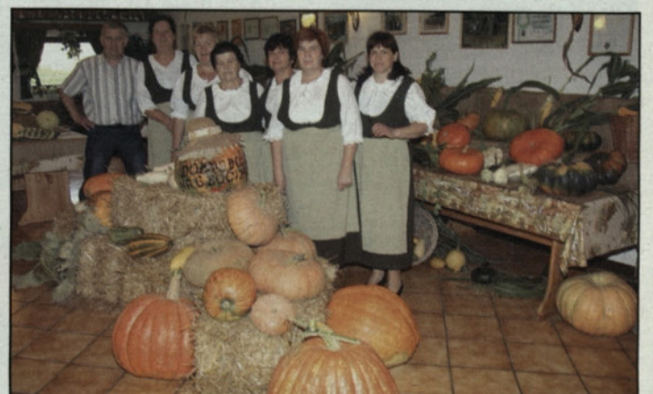
Članice društva, ki imajo največ zaslug za zanimivo razstavo