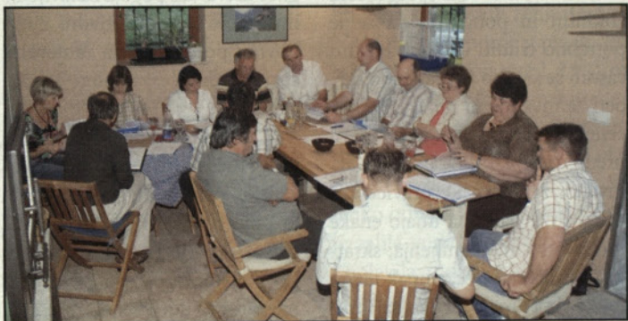
S seje Občinskega sveta Občine Tabor na domačiji Weiss