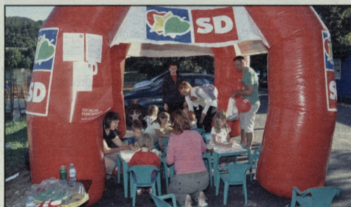
Poleg družabnih iger je bilo prijetno tudi ustvarjanje otrok

ni donatorji. Poskrbljeno je bilo tudi za hrano in pijačo in vsi so bili mnenja, da velja s tako obliko druženja nadaljevati tudi v prihodnje. D. N.