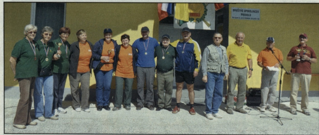
Veterani na srečanju v preboldskem Gaju

V preboldskem Gaju je prvo septembrsko soboto potekalo tradicionalno srečanje veteranskih organizacij, ki so pred leti podpisale sporazum o medsebojnem sodelovanju. Na srečanju, katerega pokrovitelj je bila Občina Prebold, so se tudi letos zbrali člani Zveze veteranov vojne za Slovenijo Spodnje Savinjske doline, člani borčevske organizacije za vrednote NOB Žalec in člani policijskega veteranskega združenja Sever – žalski odbor.