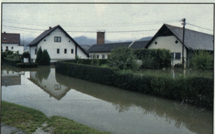
Poplava v delu Petrovč

Šale o pravilnosti vremenskih napovedi so preteklost. Vremenoslovci so za tretji konec tedna v septembru napovedali močno deževje ter skupaj s hidrologi sprožili rdeči alarm zaradi nevarnosti poplav. Čeprav Savinja ni prestopila bregov, so potoki in hudourniki zlasti na jugozahodnem delu doline skupaj s podtalnico poplavlili številne objekte, sprožilo pa se je tudi veliko plazov.