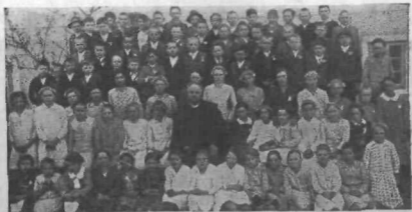
Marijin vrtec v Remšniku.