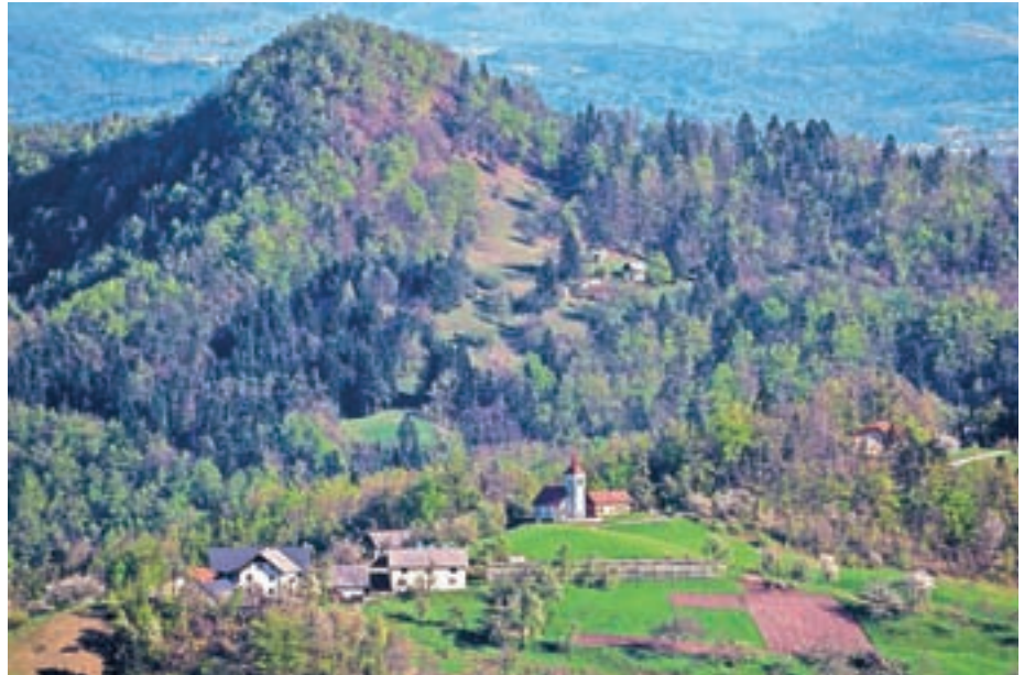
Vaška skupnost Tehovec je s 673 metri nadmorske višine najvišje ležeča skupnost v Medvodah in ima najmanj prebivalcev. Na sliki njen del okrog cerkve, ko je tam še stala mežnarija.