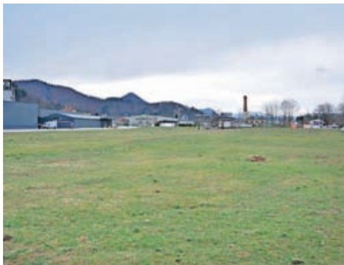
Javna dražba za zemljišča v Preski bo potekala 9. aprila na sedežu Občine Medvode.

Javna dražba bo potekala 9. aprila na sedežu Občine Medvode. Podrobnejše informacije so objavljene na spletni strani Občine Medvode.