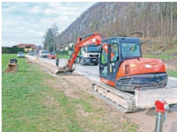
Promet bo v času delne zapore potekal izmenično enosmerno, urejen bo s semaforjem ali ročnim usmerjanjem.

"Začenjamo torej gradnjo plinovoda, fekalne in meteorne kanalizacije, optičnega omrežja, izgradnjo pločnika in rekonstrukcijo ceste na tej trasi. To je ena izmed zadnjih tras projekta Čisto zate, saj je večina tras kanalizacije že zgrajena ali v zaključevanju, s čimer se zmanjšuje tudi število tovornih vozil na tem območju. Zaključek del je predviden do konca septembra. V času del je izvedena omejitev in prepoved prometa z delno zaporo lokalne ceste LC 251011 (Tacen–Brezovec). Promet bo v času delne zapore potekal izmenično enosmerno, urejen bo s semaforjem ali ročnim usmerjanjem. V času jutranjih in popoldanskih prometnih konic pričakujemo za-