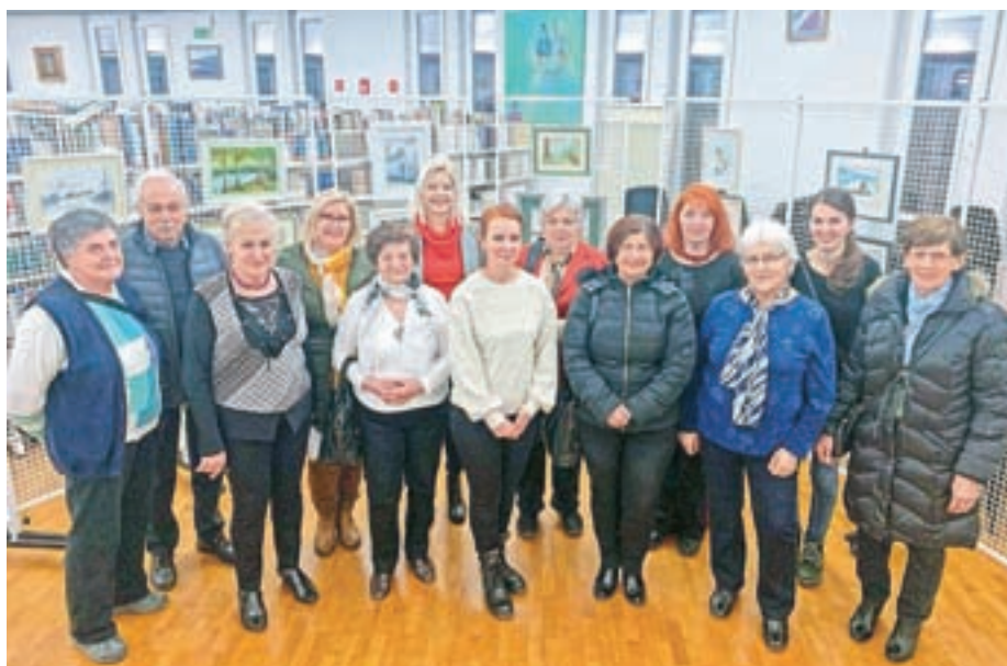
Člani likovne sekcije KUD Zbilje so se v Knjižnici Medvode predstavili z akvareli.