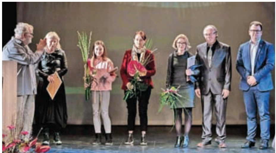
Podelili so štiri pletenice: dve za posebne dosežke in dve za življenjsko delo.