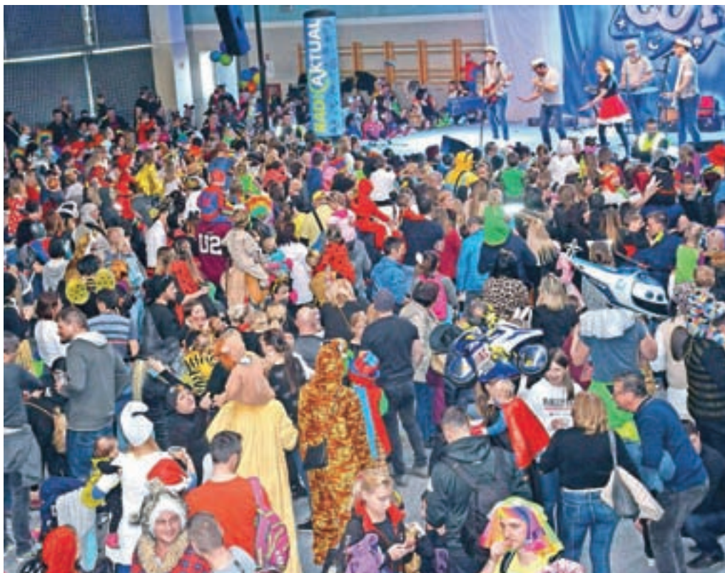
Polna dvorana pustnih mask, ki so jih zabavali tudi Čuki.

Organizatorji so bili zadovoljni. "Pustovanje je potekalo na nedeljo in ni več