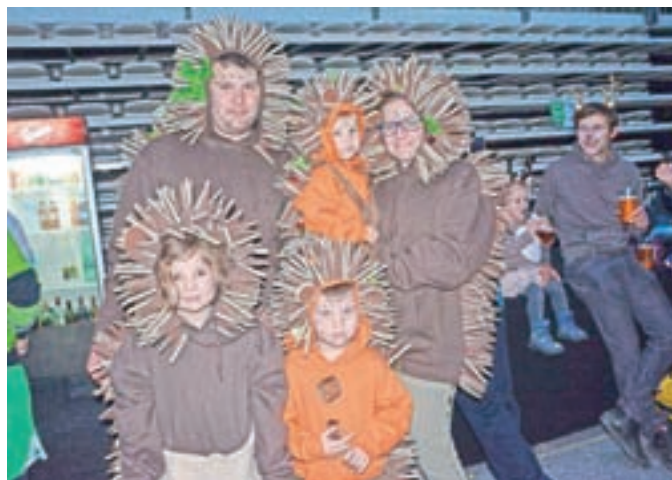
Nagrajeni ježki so v Medvode prišli iz Šmartnega ob Paki.