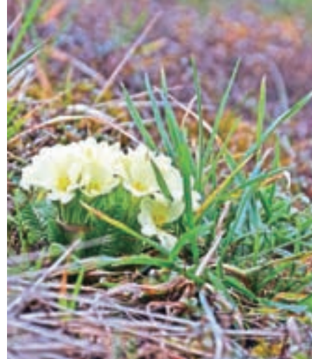
Trobentice lahko uporabimo tudi za čaj.

Čemaž ali divji česen je najboljši za čiščenje želodca, črevesja in krvi. Pri nas raste skoraj povsod. Je znana stara začimba in priljubljeno spomladansko živilo za pripravo mešanih solat. Uporabljamo lahko liste, čebulico in cvetove.