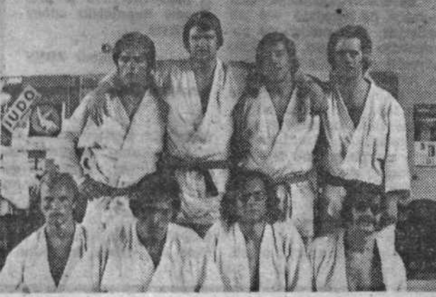
Ekipe Judo kluba Bežigrad, ki je zasedla prvo mesto v II. republiški ligi.