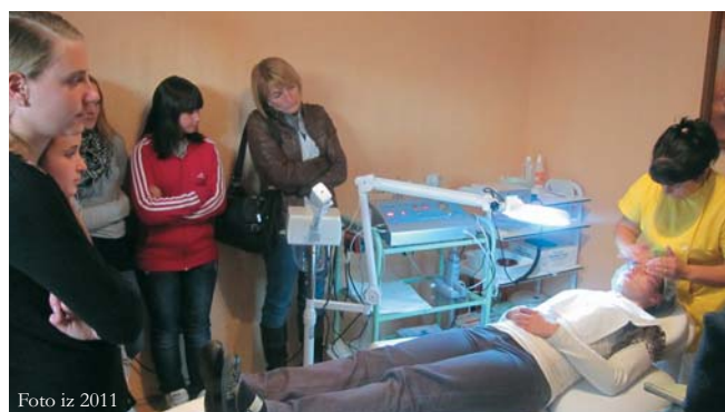
Foto iz 2011