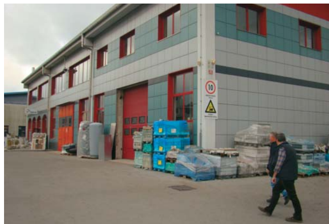
Poslovni objekt Trgocev v OIC Logatec