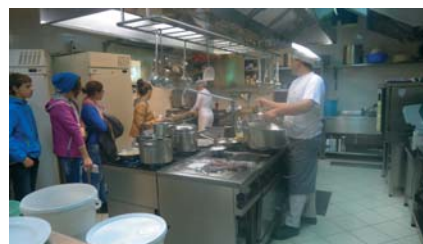
Kubinja Zelenčevih v Hotedrčici je pritegnila pozornost mladib, ki se odločajo za svojživljenjski poklic