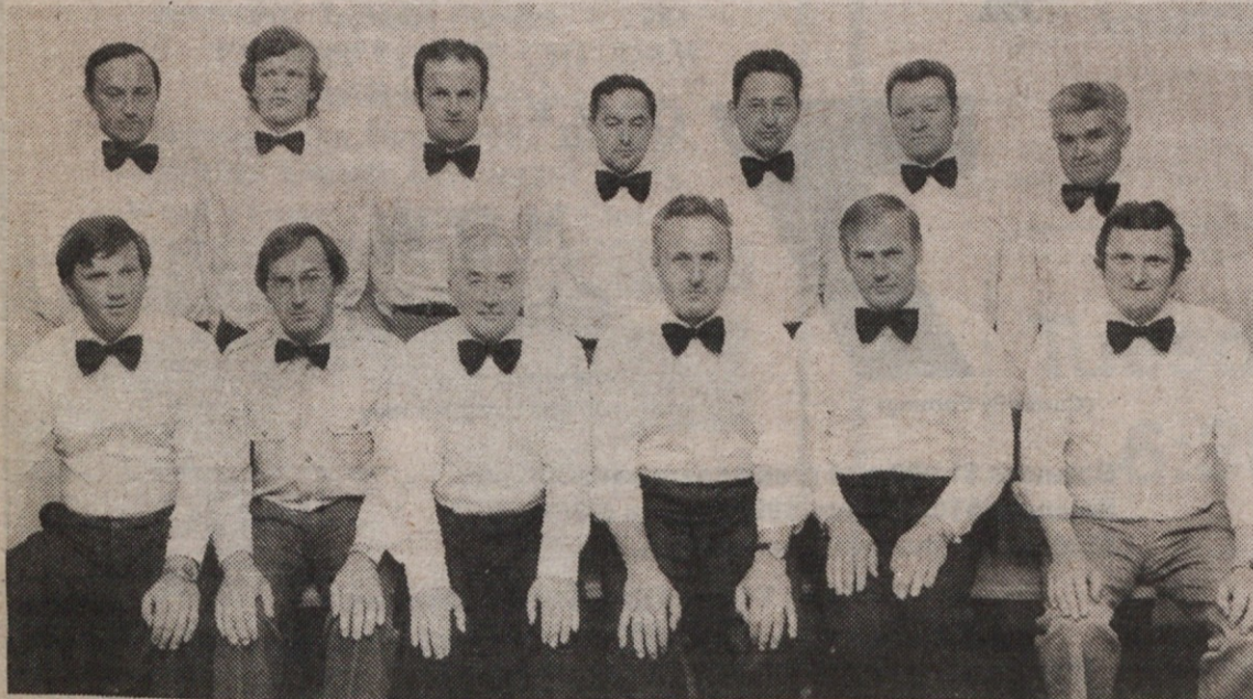
Singing group Kočna

Send to Lausche Edition, American Home, 6117 St. Clair Ave., Cleveland, OH 44103.