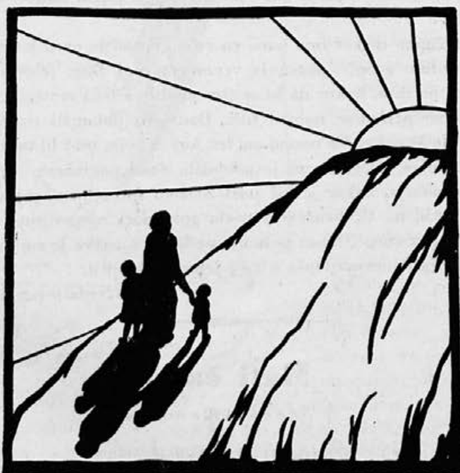
Nov rod gre soncu nasproti...