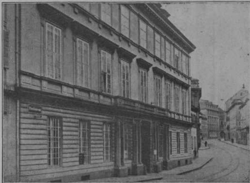
Poslopje reparacijske banke v Baselu. Novo ustanovljena svetovna banka za mednarodna plačila bo nastanjena v poslopiju bivšega okrožnega poveljstva v Baselu.

Aeroplani, ki jih mi navadno vidimo, so le ptičipritlikavci napram onim velikim aeroplanom, ki so jih gradili po svetu v l. 1929. Saj je že nekaj vsakdanjega aeroplan, v katerem se med vožnjo vršijo kino-predstave, v katerem se lahko vozi po 60 ljudi, v katerih so posebni prostori za spanje, pojedine itd.