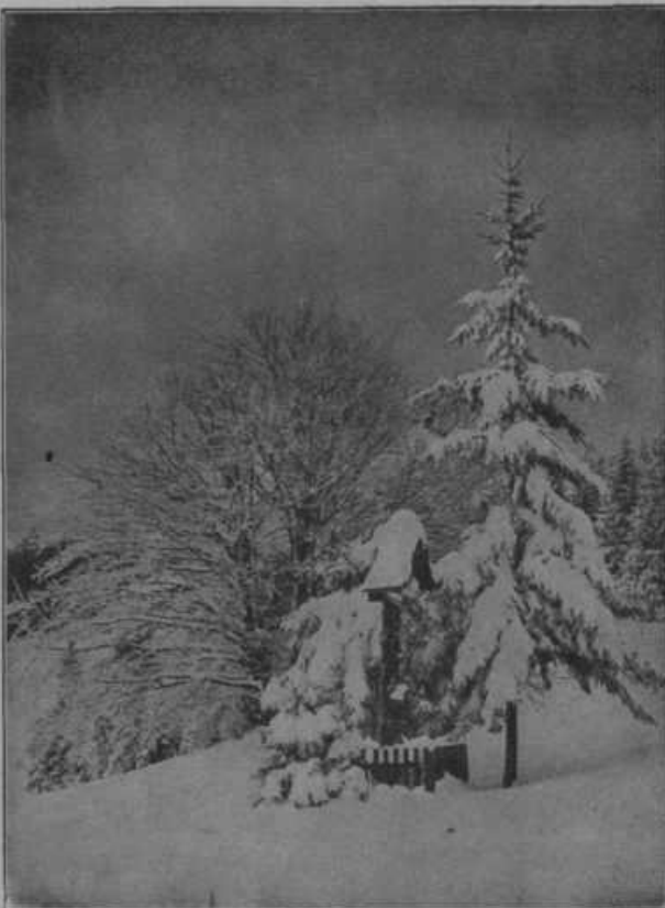
Zimska slika nam kaže lepoto pohorskega kraja v snegu.

mladine. — Dne 20. decembra 1929 je praznoval zlatomašniški jubilej in pri tej priliki kot prvi papež, po skoro 60 letih, prestopil prag Vatikana. Slovesnosti zlate maše se je udeležil iz lav. škofije tudi škof dr. Tomazič.