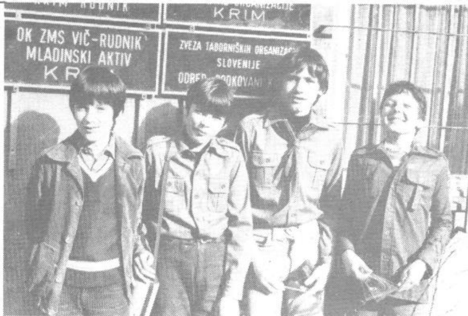
Na fotografiji so člani »domače« ekipe vod »Pobesnelih marsovčkov«

Taborniki odreda Podkovani krap so uspešno izvedli svojo največjo obvezo. Na svojem terenu so organizirali orientacijsko tekmovanje »Memorial Oskarja Kovačiča«. Letos se ga je udeležilo precej več ekip kot lansko leto in zato so imeli taborniki odreda Podkovani krap veliko dela. Več o tekmovanju pa naj povedo fotografije same.