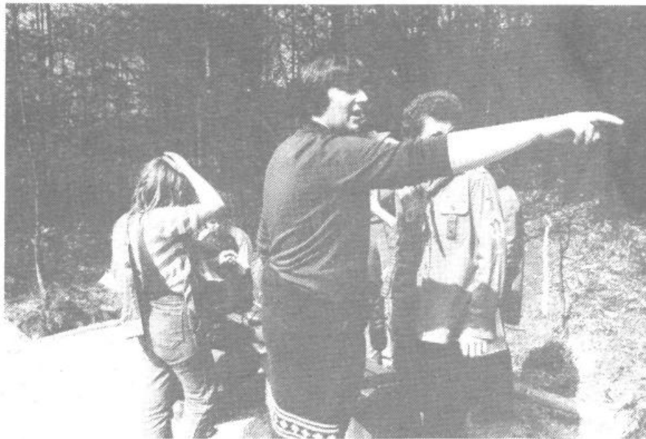
Dostikrat ni odveč pomoč izkušnejših in starejših kolegov