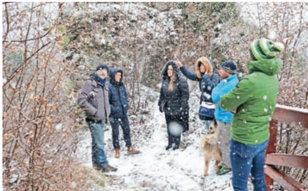
Na Zavodu za turizem, šport in kulturo Kamnik nameravajo pripraviti načrt dolgoročne sanacije obzidja Starega gradu.

cija je namreč potekala pred skoraj desetimi leti.« Kot pa dodajajo na ZTŠKK, bo že samo čiščenje zahtevno, saj bo treba na visoki višini porezati zelenje ter pri tem paziti, da se s trganjem rastlinja ne uničijo ostanki grajskega zidu. Ob napačno opravljenem delu bi se namreč obzidje lahko tudi porušilo, zato bodo vsa dela potekala pod strokovnim vodstvom kranjskega zavoda za varstvo kulturne dediščine. Očiščeno in sanirano obzidje je pogoj tudi za gradnjo razgledne ploščadi. Kot za-