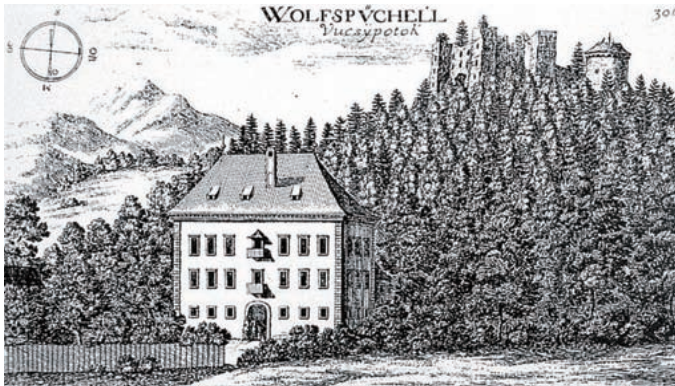
Valvasorjeva grafika Volčjega Potoka iz leta 1689

Prostore bi namenili različni rabi, ki združuje avditorij oz. prizorišče za prireditve, razstavišče za likovno umetnost in servisne prostore. Vsebine z likovno umetnostjo bi v dvorec umestili v sodelovanju z Narodno galerijo, ki bi del umetnin iz njene zbirke razstavila v novem dvorcu v Arboretumu Volčji Potok. Skupaj z Zavodom za varstvo kulturne dediščine Slovenije (ZVKDS) bodo v letošnjem letu izdelali projektno nalogo za arhitekturni natečaj, v katerem bodo opredelili dejavnosti, ki se bodo izvajale v dvorcu. Ker je eden od ciljev