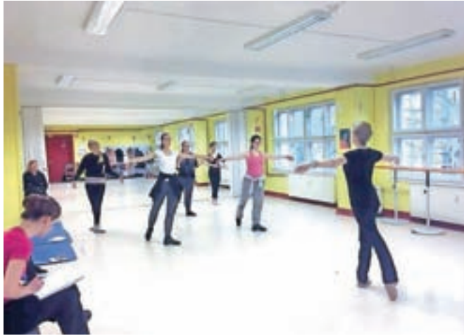
V Domu kulture Kamnik je potekal seminar za učiteljice baleta.

»Z organizacijo tovrstnih seminarjev sem želela dvigniti nivo baletne umetnosti pri nas. Glavni namen seminarjev je namreč nadgraditi in poglobiti znanje, ki smo ga učiteljice baleta dobile v slovenskem izobraževalnem sistemu. Royal Academy of Dance namreč sledi najno-