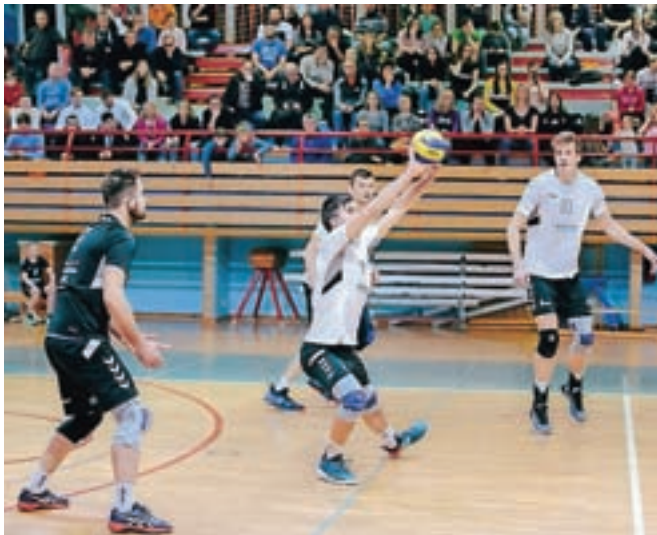
Odbojkarji Calcita Volleyja so se uvrstili med najboljših osem ekip v pokalu Challenge.

Z Monzo bodo v primeru uspeha na povratni tekmi ženskega pokala Challenge igrali tudi odbojkarice prve ženske ekipe Calcita Volleyja, ki so v sredo v Aachnu branile zmago s 3:1 na do-