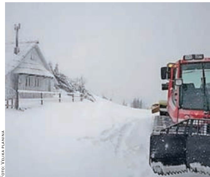
Na Veliki planini so pripravljeni na sprejem smučarjev.

Že dobra dva tedna pa smučajo na smučišču Osovje. Manjše smučišče, ki ga upravlja Smučarsko društvo Črna pri Kamniku, privablja precej družin, še zlasti odkar so v eni od minulih sezon kupili tudi smučarski trak za otroke. Smučišče med delovniki obratuje od 18. do 21.