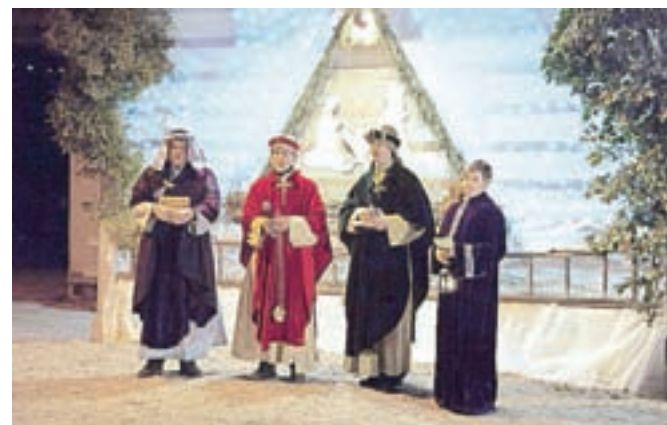
Koledniki pri Grošanovih jaslicah

valcev voščili sreče in zdravja v novem letu, zbrane prostovoljne prispevke pa so namenili misijonom. Tradicionalno koledovanje pa so Perovljani izkoristili tudi za druženje ob dobrotah, ki so jih napekle gospodinje.