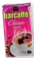
kava Barcaffe, 250 g