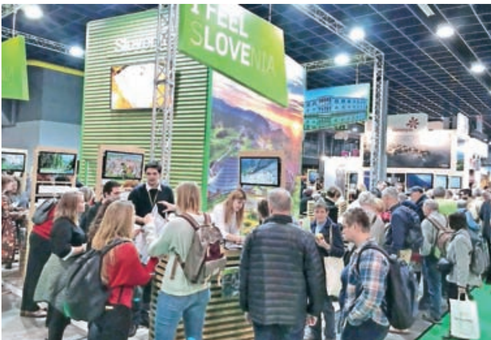
Obiskovalci sejmov so največ povpraševali po aktivnem preživljanju počitnic v kombinaciji s sproščujočim oddihom.