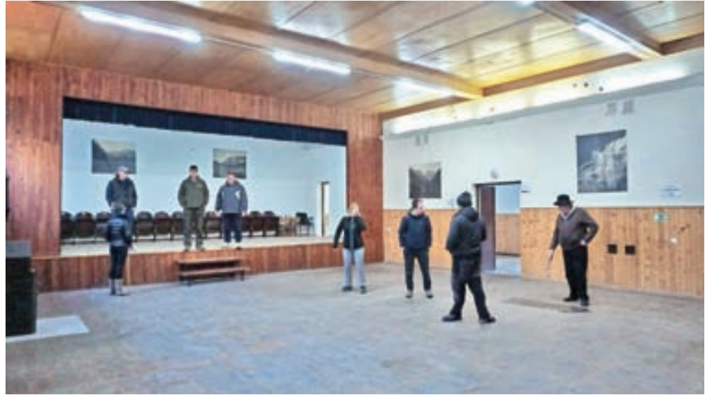
Člani KS Kamniška Bistrica na ogledu krajevnega doma

Kamniška Bistrica – Novi svet Krajevne skupnosti Kamniška Bistrica, v katerem je le en član nastopil svoj drugi mandat, je kmalu po novem letu začel z delom. Na drugi izredni seji so se seznanili s predvidenimi finančnimi prilivi v tem letu, ki znašajo okoli pet tisoč evrov dotacij iz občinskega proračuna in 12 tisoč evrov strogo namenskih sredstev od grobnin in najemov mrliške vežice v Stranjah. Kot eno izmed prioritet so si zastavili, da ugotovijo, v kakšnem stanju je Krajevni dom Krajevne skupnosti Kamniška Bistrica – Vegrad, ki je v lasti krajevne skupnosti, ter da na podlagi ugotovljenega stanja pripravijo vizijo za prihodnost doma, ki so ga v letih po drugi svetovni vojni zgradili krajanje sami. Sredi januarja so člani KS opravili ogled zapuščenega objekta in pregledali projek-