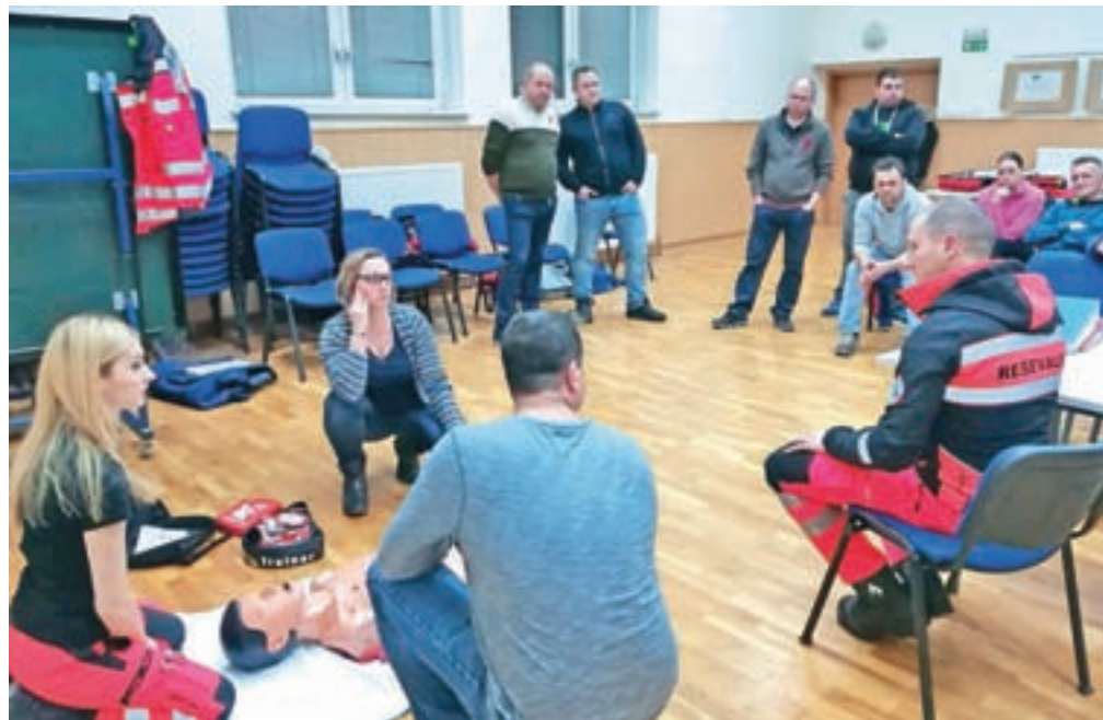
Sistem prvih posredovalcev je najprej zaživel na območju Motnika.

V sistem so se v začetku januarja kot prvi na območju občine Kamnik vključili prostovoljci iz Motnika, sledili pa jim bodo tudi drugod v občini. »Ker v kritičnih situacijah o življenju ali smrti odloča vsaka minuta, smo zlasti v krajih, ki so bolj oddaljeni od postaje Nujne medicinske pomoči Kamnik (NMP), z veseljem spoznali, da nismo povsem pozabljeni, saj smo na težave z dolgim čakanjem na prihod urgentne pomoči opozarjali že dalj časa. Jasno je, da reševalno vozilo do 25 in več kilometrov oddaljenih pacientov, ki so se znašli v življenjsko ogrožajoči situaciji, ne more priti v zgolj nekaj minutah, hkrati pa je žalostno, če ne že kar nedopustno, da so v bližini pacienta v kritičnem trenutku pogosto ljudje, ki bi s svojo voljo in znanjem