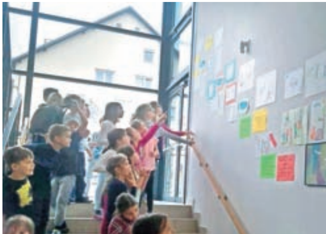
Na tematskih delavnicah so učence spodbujali k strpnemu odnosu do soljudi.

»Strpnost je spoštovanje, sprejemanje in priznavanje bogate raznolikosti naših svetovnih kultur, naših oblik izražanja in načinov biti človek. Spodbujajo jo znanje, odprtost, sporazumevanje in svoboda misli, vesti in prepričanja. Strpnost je harmonija v različnosti. Pomeni, da je posameznik svoboden, da se ravna po svojih prepričanjih in sprejema, da se drugi ravna po svojih. Pomeni sprejemanje dejstva, da imajo ljudje, narav-