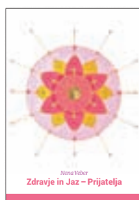
Nena Veber: Zdravje in Jaz - Prijatelj