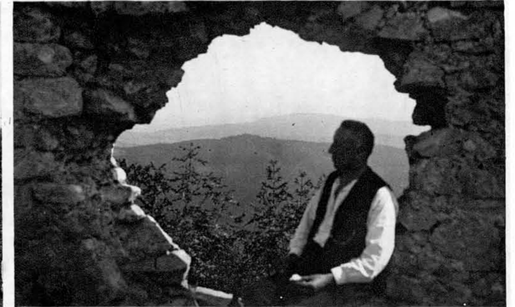
Pogled skozi razpadlo lino šumberskih razvalin na Kozjak, znan iz Jurčičeve povesti »Jurij Kozjak«.

Ljudstvo pripoveduje, da so zidali Kozjak in Šumberk istočasno z enim samim kladivom.