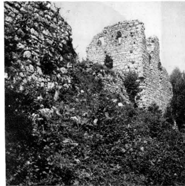
Del razvalin šumberskega gradu nad Seli.