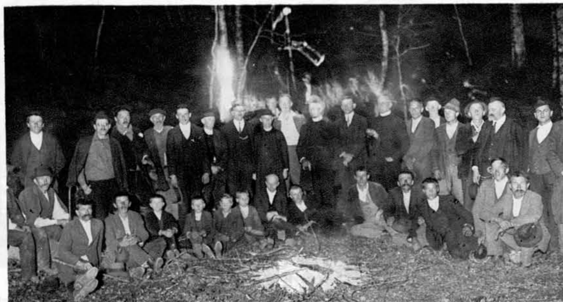
Polharska družba ponoči pri ognju v gozdu.

Popoldne nastavijo polharji po gozdovih pasti, zvečer se pa podajo vsi skupaj v šumo, kjer si zakurijo velik ogenj. Tam možujejo ter si pripovedujejo davne zgodbe. — Slika na levi: Stara dolenjska polšja past na bukvi z ujetim polhom.