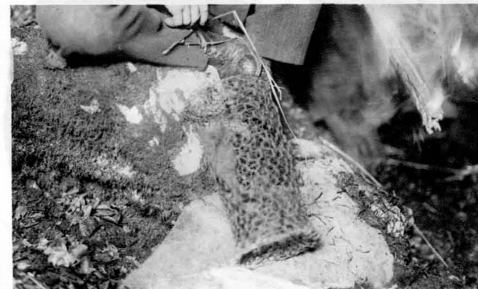
Polšja past (»raušel«),

Gorenjske naravne lepote so bahave, deloma celo kričeče, dočim ima naše dolenjsko gričevje s svojimi skromnimi vasicami tako intimen in pristrčen značaj, da se mora človeku priljubiti na prvi pogled, zlasti pa še, če spozna naše dobrovoljne Dolenjce. Ta označba velja v polni meri tudi za Sela pri Šumberku, ki so bila časih jako priljubljeno izletišče, dočim je zadnja leta poset žal nekoliko ponehal. Posebno važna privlačna točka je Šumberk, na katerega je iz Sel pičle pol ure in s katerega je diven razgled po velikem delu Dolenjske, vidi se Triglav, Kum, Gorjanci itd. Do Kozjaka, iz Jurčičevih povesti znanega gradu je dobro uro, a videti je tam le še grobljo kamenja. Najlažje je doseči Sela (v poldrugi uri) s postaje št. Vid pri Stični ali Radohova vas, za povratek je pa priporočljiva Velika Loka (2 uri).