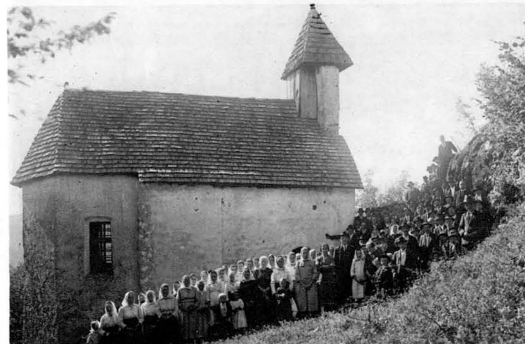
Kapelica sv. Katarine na Šumberku

Ljudstvo pripoveduje, da so zidali Kozjak in Šumberk istočasno z enim samim kladivom.