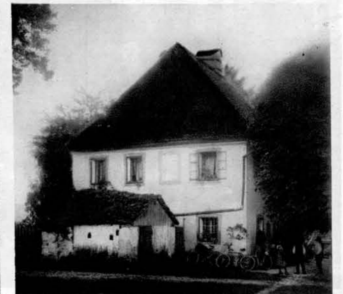
Rojstna hiša škofa Fr. Barage,

ki jo nastavljajo pred luknje med skalovjem in v katere love polhe žive, dočim jih one pasti na drevesih usmrte.