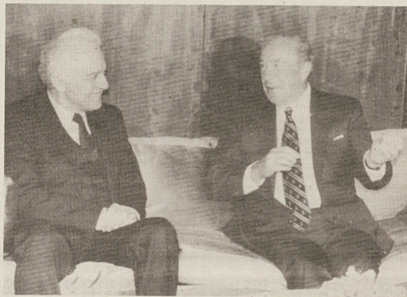
Zunanja ministra SZ Ševarnadze (levo) in ZDA Shultz sta v štiriinpolurnem pogovoru, na katerem bi prišlo do novih predlogov, a je bil, po mnenju obeh, »odkrit in stvaren«, pripravila bližnje srečanje na vrhu Reagan - Gorbačov, ki bo 19. in 20. novembra v Ženevi