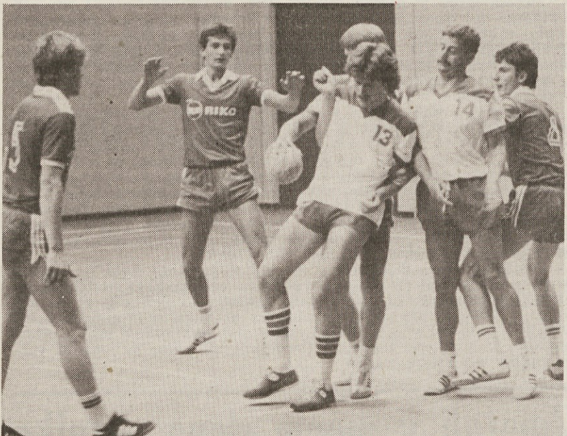
V tekmi z Inlesom iz Ribnice so Krasovi rokometaši doživeli visok poraz, a so svojo igro vseeno zadovoljni, saj v bližnjem prvenstvu D lige ne bodo imeli za nasprotnika tako močnih ekip