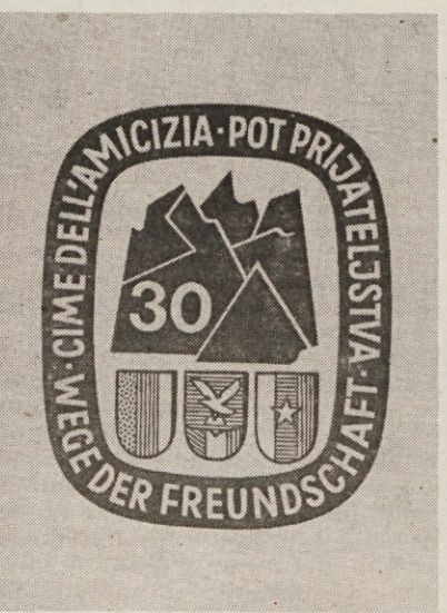
Knjižica Poti prijateljstva

sobotah in nedeljah. Pogačnikov dom na Kričkih podih bodo zaprli v ne- deljo, čeprav je možno, da ga bodo oskrbovali teden dlje. PD Radovljica pa je javila, da bodo tudi Roble- kov dom na Begunščici zaprli poj- trišnjem.