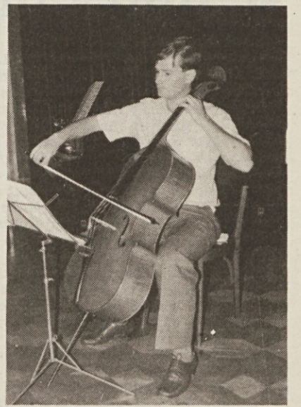
skratka približati tudi ta instrument in ustvariti večer, ki nam bo še dolgo v lepem spominu.