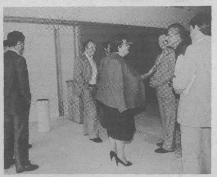
Pogovor pred posvetom