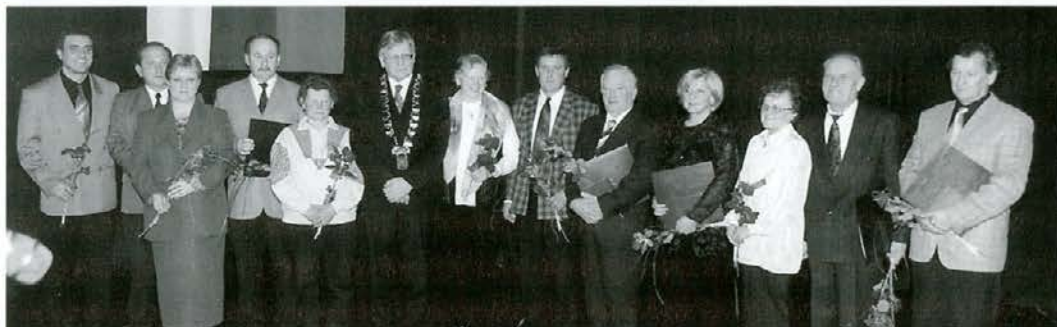
Vsi Bernekerjevi nagrajenci