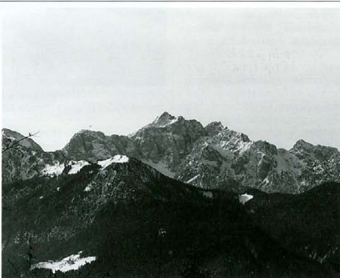
Raduha - tu so se kalili bodoči "himalajci".