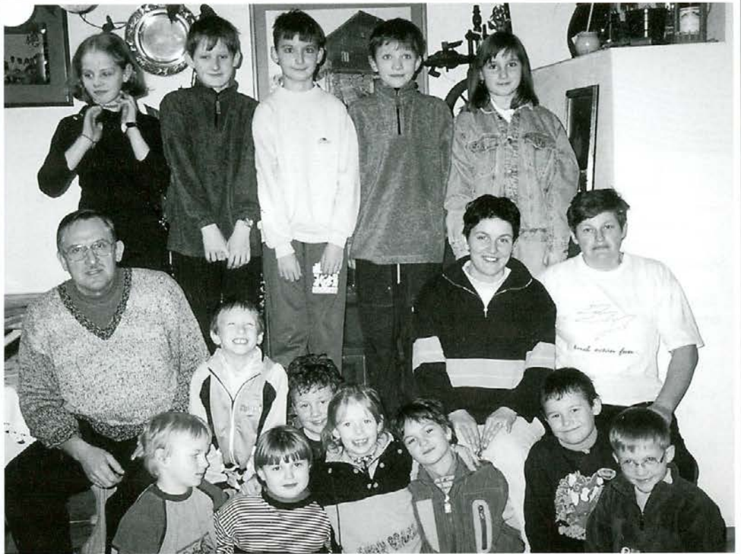
In še spominska fotografija za spomin.