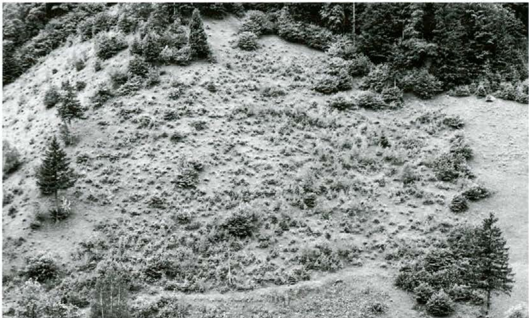
Zaraščanje kmetijskih površin.

Za revir Kozjak je značilna relativno visoka gozdnatost (65 %), kjer prevladujejo gozdovi iglavcev (72 %). Gozdovi so v zasebni lasti in tvorijo skupaj s kmetijskimi površinami za to območje značilno obliko celkov,