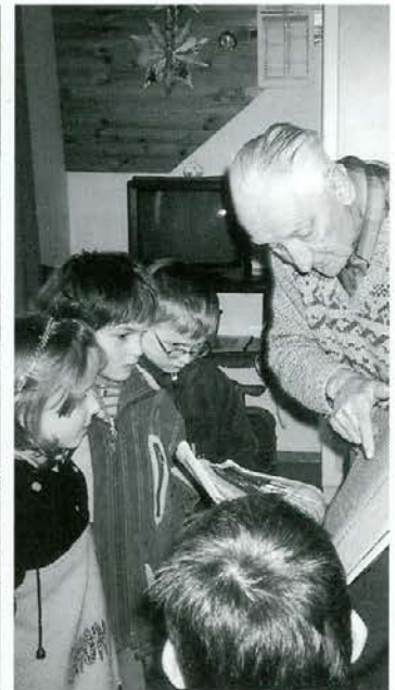
Dedek je zares veliko vedel o čebelah