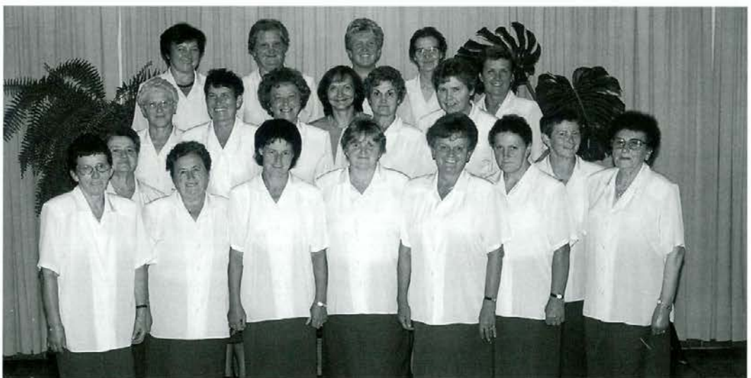
Ženski pevski zbor društva upokojencev Slovenj Gradec

V prelepi dvorani mestne hiše - Rathaus - so naše pevke med