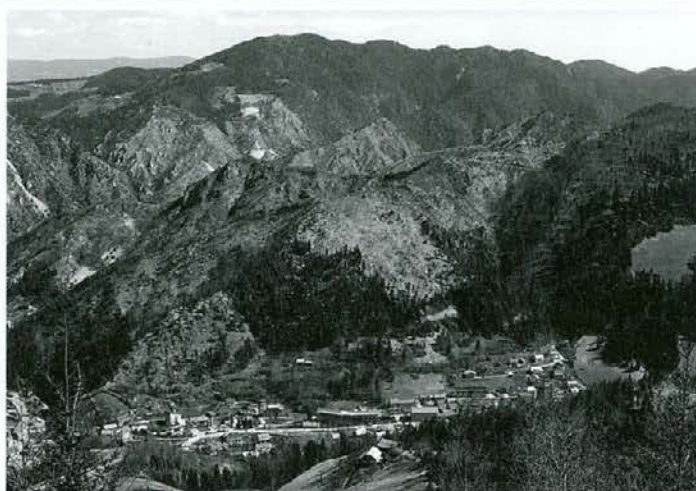
Črna s Tebrom

Tone Partljič je napisal komedijo, aktualno za vse večne čase, s poslansko vsebino, in s pomenljivim naslovom »Štirje letni časi«. Ta komedija ni bila v okviru Caffé teatra, vendar so bureni, dolg aplavz in pa nasmejana lica gledalcev dokazovala, da so igralci iz Prevalj in Mežice igro odlično odigrali.