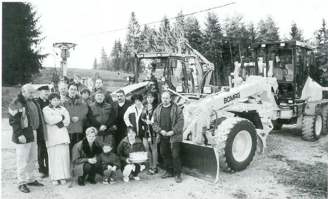
Slovesnosti ob žegnanju novega grederja BOMAG so se udeležili poleg domačih tudi sodelavci in prijatelji.

Poleg naštetega se ukvarja še s stojnim vzdrževanjem cestnih brežin in najbolj nevhvalnim delom - vzdrževanjem cest v zim-