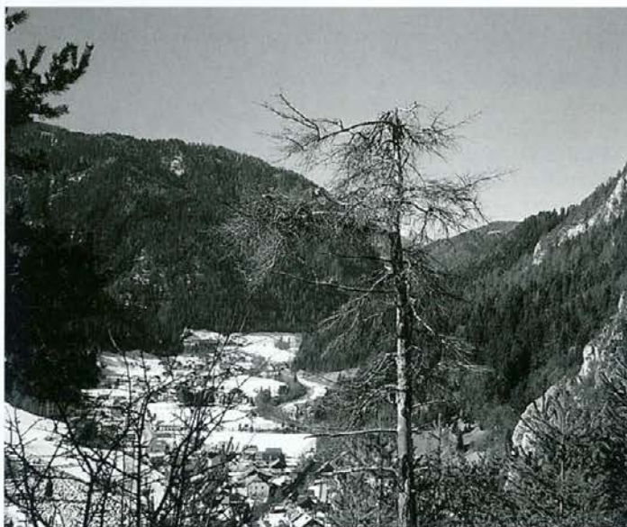
Pristava - kraj vrhunskih smučarjev