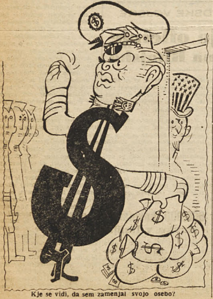
Kje se vidi, da sem zamenjal svojo osebo?

Obenem pa ob zaključitvi je intervencije predlagamo se izboljšajo in okrepijo za enjenje javnih nasadov, so tako važna za izboljšanje zdravstvenega stanja v celotni državi, da bi tudi služilo v okviru vsem občanom.