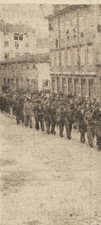
Tržačani so z orožjem v roki stopili v borbo proti okupatorju za osvoboditev Trsta.

stični okupator se je s svojimi poslednjimi ostanki srdito branil posebno pri Lazaretu v Mirli in na Opcinah. S topništvom so obstreljevali vse ceste, ki peljejo v mesto, da bi tako preprečili zmagoslavni pohod jugoslovanskih partizanov. Toda vse to ni nič zalego, prvega maja je bilo mesto osvobodeno.