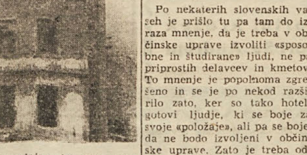
Ze šest let je minilo, odkar je končala zadnja vojna, toda stanovanjske hiše v Doberdolu se danes niso obnovile.