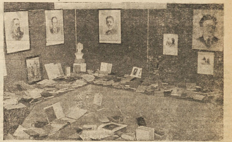
Pogled na del razstave slovenske knjige, ki jo je priredila SHPZ ob priliki občnega zbora v dvorani PD «Kraljiča» - Razstavo si je ogledalo mnogo ljubiteljev slovenske knjige - Ravnatelj nižje slovenske industrijske šole v Rovinju pa je obdel nabilo in si dovolil niti, da bi si jo ogledali dijak, ki obiskujejo omenjeno šolo.

Podobna preučitev vsega, kar smo videli na tej razstavi, ni zahtevala preveč prostora. Če bi hoteli razpravljati o raznih elementih, ki sestavljajo knjigo, bi morali govoriti o tipografskih vrstah, o obliki in arhitekturi strani, o delu tipografa in njegovi izvedbi s pomočjo krasilcev in grafičnih tehnikov, o vrednosti, naravi in tehniki ilustracij, o vezavi, o raziskovanjih in tendencah novega slovenskega tiskarstva. Zato se bomo ustavili same pri knjižnem ovitku in to zato, ker vemo, kako je iz neštetiš razlogov vsa javnost daleč od poznavanja problemov grafike. Iz lastnega izkustva pa vemo, da se tako delavci kot intelektualci in ljubitelji počasi približujejo zadevam grafike. Na podlagi raznih dokazov, ki sem jih pridobil s svojim opazovanjem lahko trdim, da je pozornost javnosti za «platinice» vedno bolj živa tako, da se pogosto in ne obotavljajo izražati katero koli menje, češar si ne bi upala izraziti o nobenem drugem elementu, ki sestavlja knjigo. In zakaj to? Ker se knjižni ovitek - zunanje odelo knjige - predstavlja takoj očesu, ki ga vsega objame in povzroči takojšnji pristen vtis, ki ga dobe elegantne žene ali prajeje lepega poslojca.