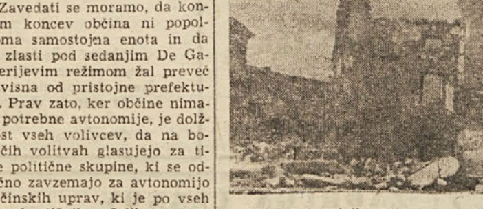
Ze šest let je minilo, odkar je končala zadnja vojna, toda stanovanjske hiše v Doberdolu se danes niso obnovile.

Z fašističnim terorjem skušajo titovci preprečiti naraščajočo osvobodilno borbo jugoslovanskih delavcev. Neznatni del ujetih rodoljubov je bilo pripeljanih pred takojšnovo sodišča, ki so pretvorjena v pomožni aparat zloglasne Rankovičeve Udebe. V zadnjih mesecih so ta sodišča uprizorila številne procese, od katerih bomo navedli ne nekaj in na katerih so bile obsodene večje skupine delavcev in kmetov: Velika skupina rudarjev rudnika Bor (vssk obtoženev je bil obsojen na 20 let); 25 delavcev iz mesta Stara Pazova (štirje so bili obsojeni na smrtno kazen); 22 železničarjev iz mesta Bradina (dva sta bila obsojena na smrt); 10 beograjskih železničarjev (35 je bil obsojenih na po 20 let, ostali pa na prisilno delo); 14 uradnikov iz Kragujevca (eden je bil obsojen na smrt); 5.303 srbskih kmetov (od katerih je 2.188 bilo obsojenih na dolgoletno ječo, 6.135 pa izposlavljeni «administrativnim sankcijam» — prisilnemu delu v visokim denarnim globam); 103 kmetije iz Makedonije (od katerih je bilo 49 obsojenih na smrtno kazen).