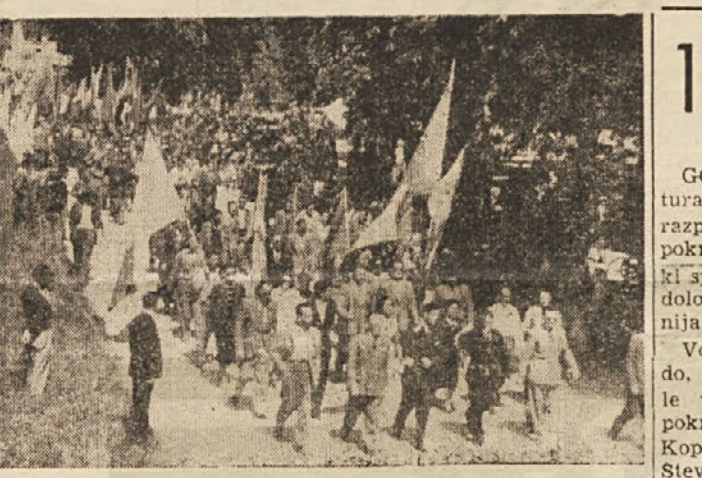
Z lanske prvomajske manifestacije v Gradiskih.

Letos bo osrednja pokrajinska prvomajska prireditev v Tržiču, ki je glavno industrijsko središče v pokrajini. Tako se bodo tisoči delavcev zbrali na svoji manifestaciji v kraju, kjer delajo. Manifestirali bodo za spoštovanje delovnih pogojev, za mirnodobsko proizvodnjo, za sprejem javencev v tovarne, za spoštovanje pravic kmetov, za delo na Krminko-gradiščanskem polju, za spoštovanje demokratičnih svobod in v tovarnah, predvsem v onih, kjer so po večini zaposlene žene in v katere uvajajo lastniki pravcato karnarsko disciplino; nadalje bodo manifestirali za zboljšanje življenjskih razmer upokojujencev in srednjega sloja prebivalstva.